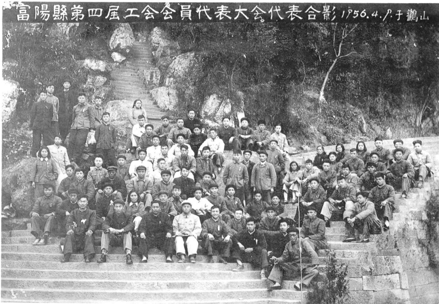
富阳县第四届工会会员代表大会合影