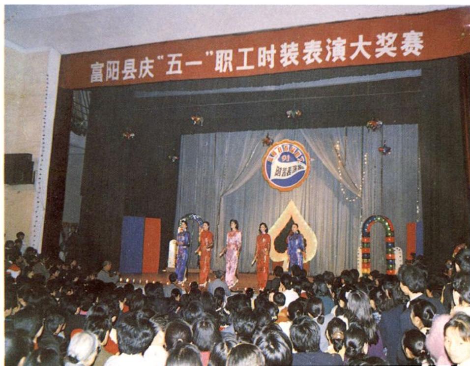
庆“五一”职工时装表演大奖赛

浙江省富阳总工会第二批赴福、莆、泉、石、柯、乐五市休养团合影 泉州市工人文化宫休养团赠 一九九〇年六月二十五日