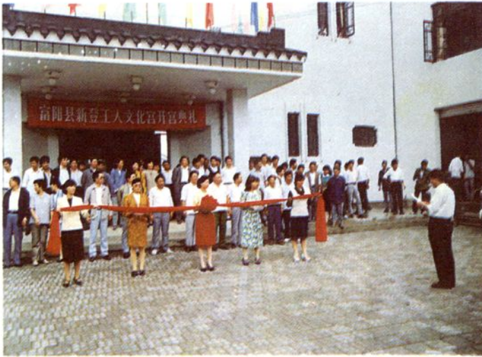
一九九〇年九月二十七日， 新登工人文化宫落成