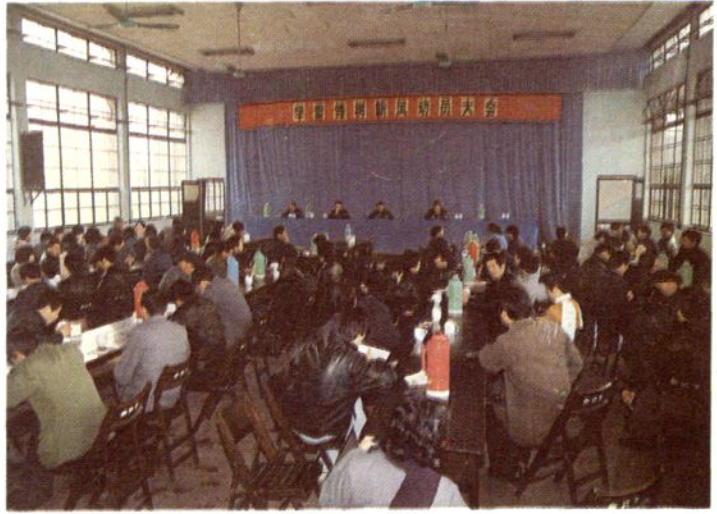
一九九〇年三月五日，县总工会 召开『学雷锋、树新风』动员大会