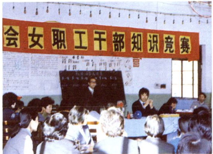
县工会女职工委员会 举办女职工知识竞赛