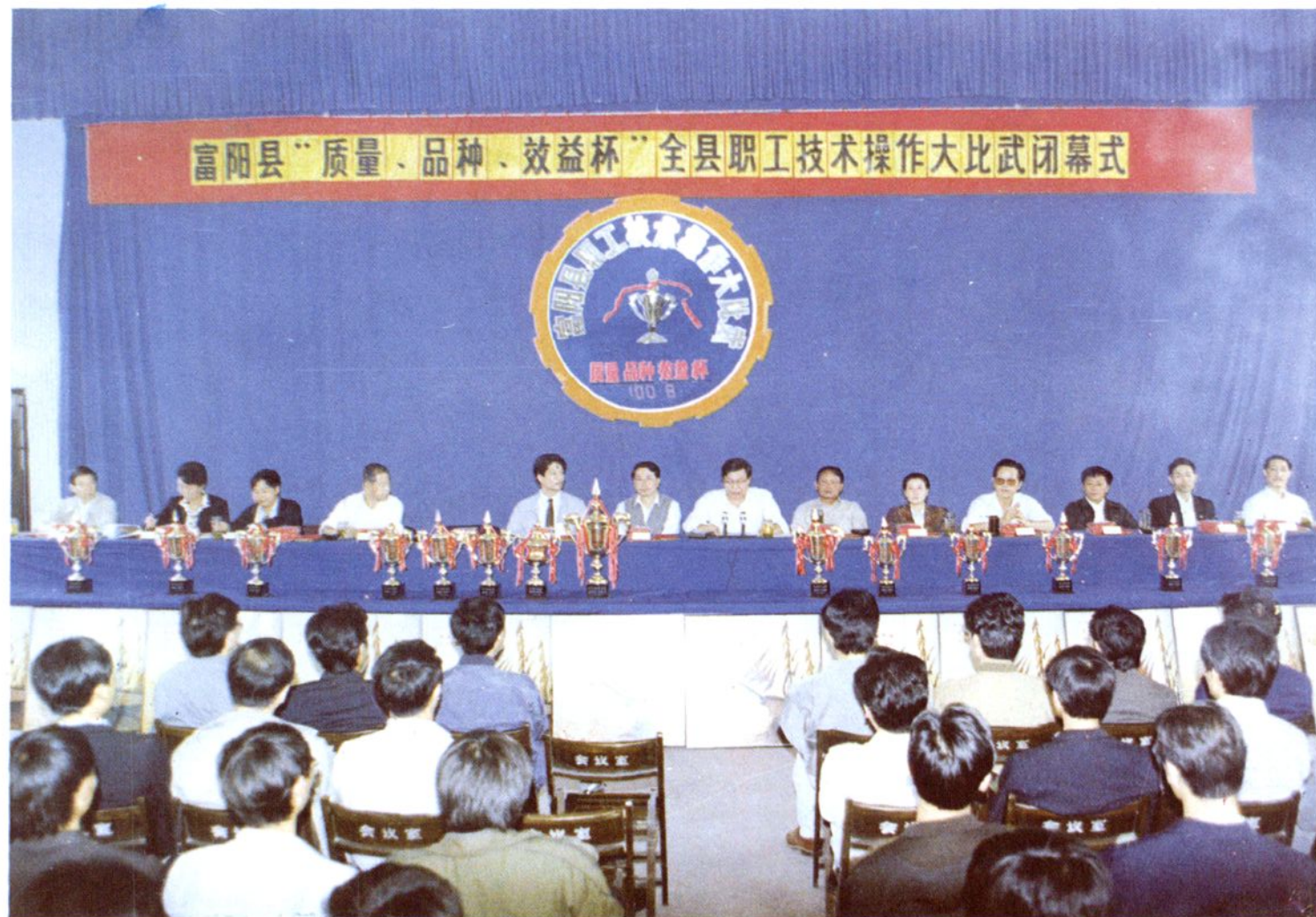
富阳县职工技术操作比武总结表彰大会