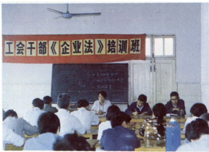
县总工会举办「企业法」培训班