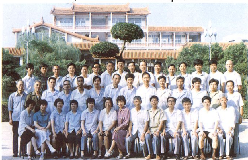
赴泉州休养团合影

浙江省富阳总工会第二批赴福、莆、泉、石、柯、乐五市休养团合影 泉州市工人文化宫休养团赠 一九九〇年六月二十五日