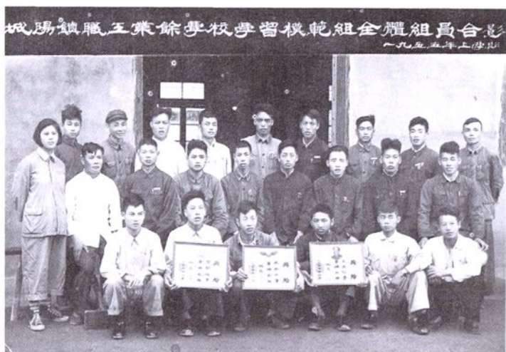
新登县城阳职业业余学校模范班合影