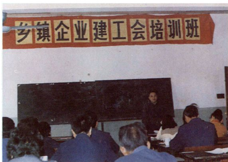
乡镇企业建工会培训班