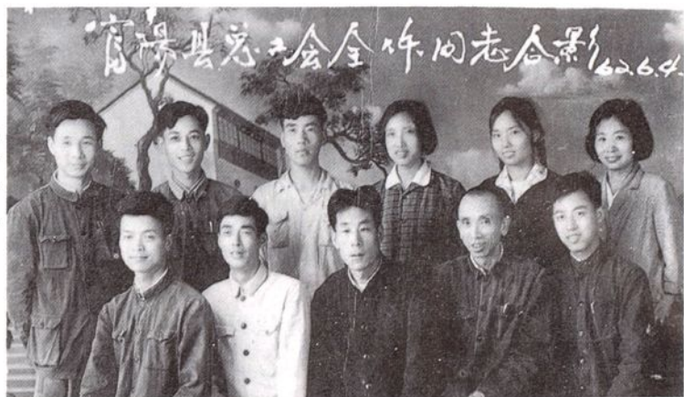
县总工会全体同志合影