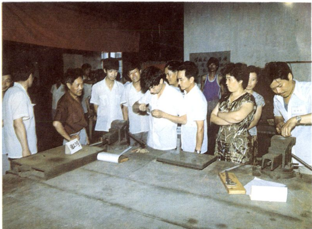
钳工操作技术比武现场