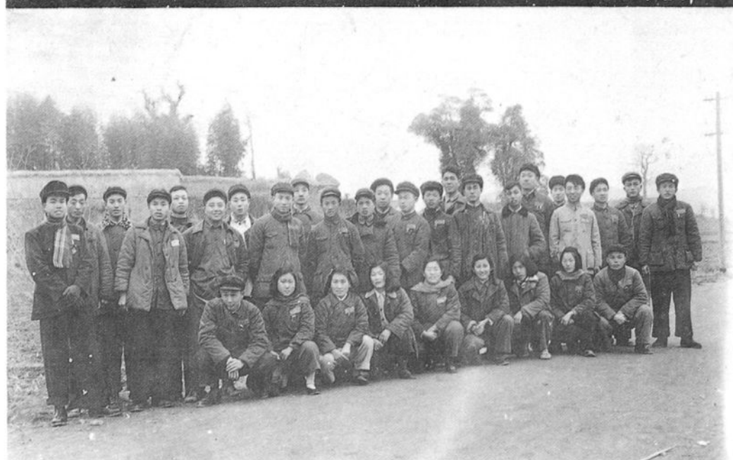
一九五六年浙江省工人访问团第三分团新登代表合影