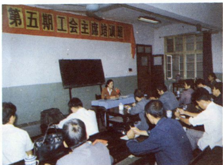
县总工会举办工会主席培训班