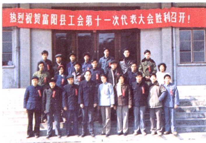
一九八六年富阳县总工会第十一届委员会合影