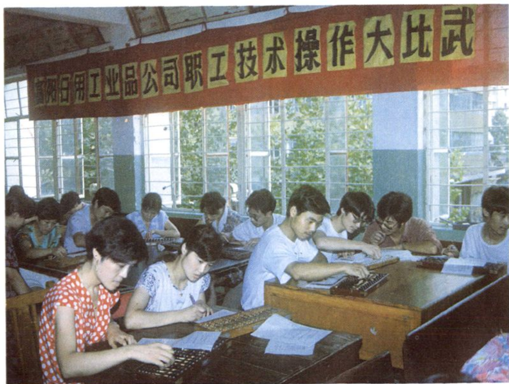
日用工业品公司技术操作比武