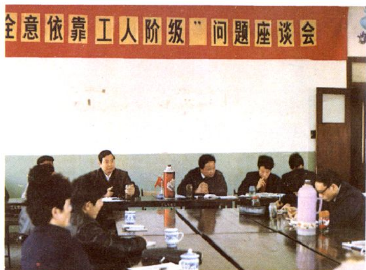
一九八九年十二月十六日， 县政府与县总工会召开联席会议， 讨论全心全意依靠工人阶级