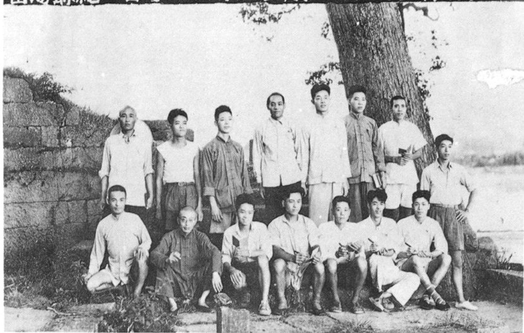
富阳县总工会第一次筹委会议全体委员合影