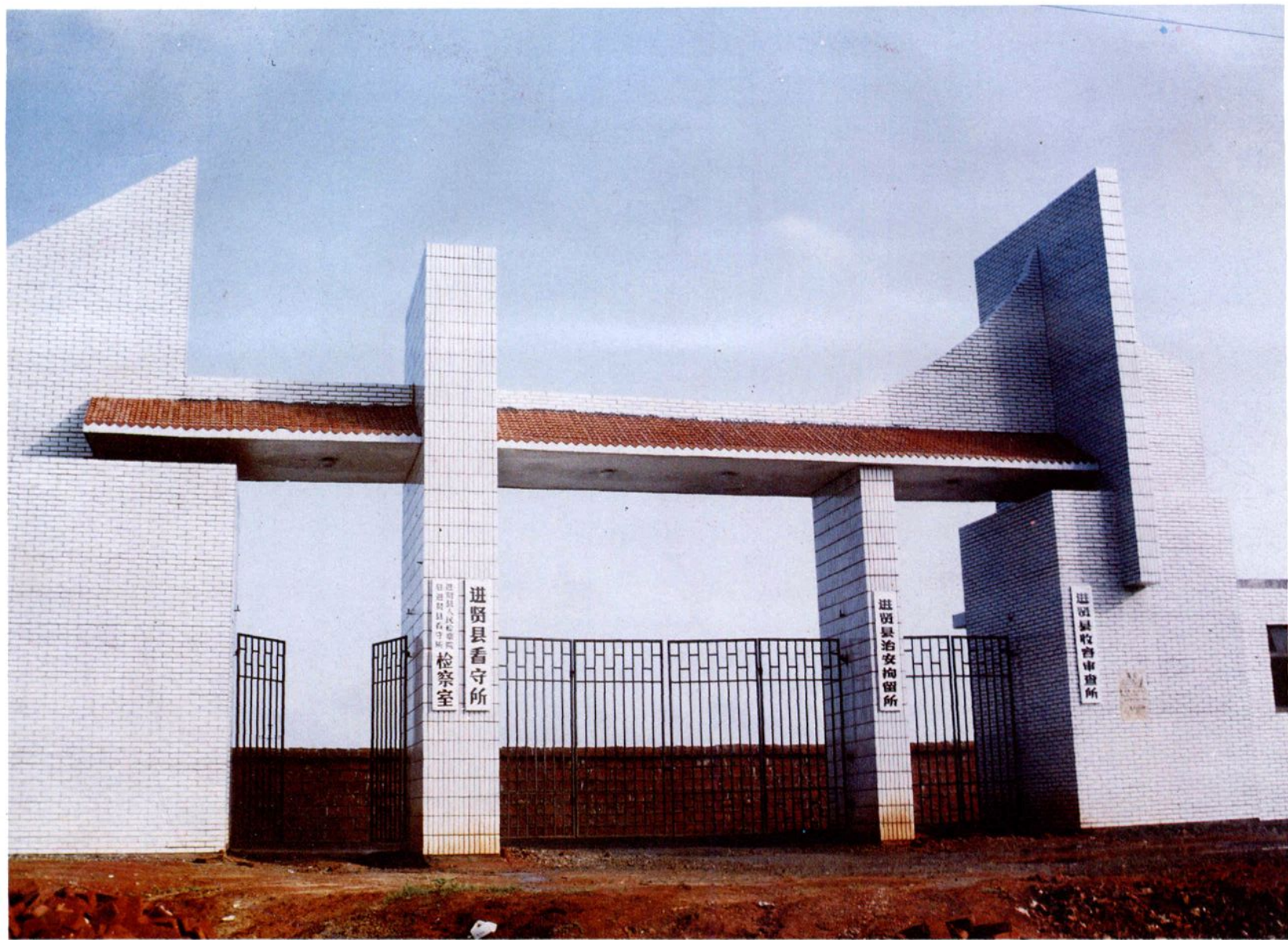
进贤县公安局看守所大门。