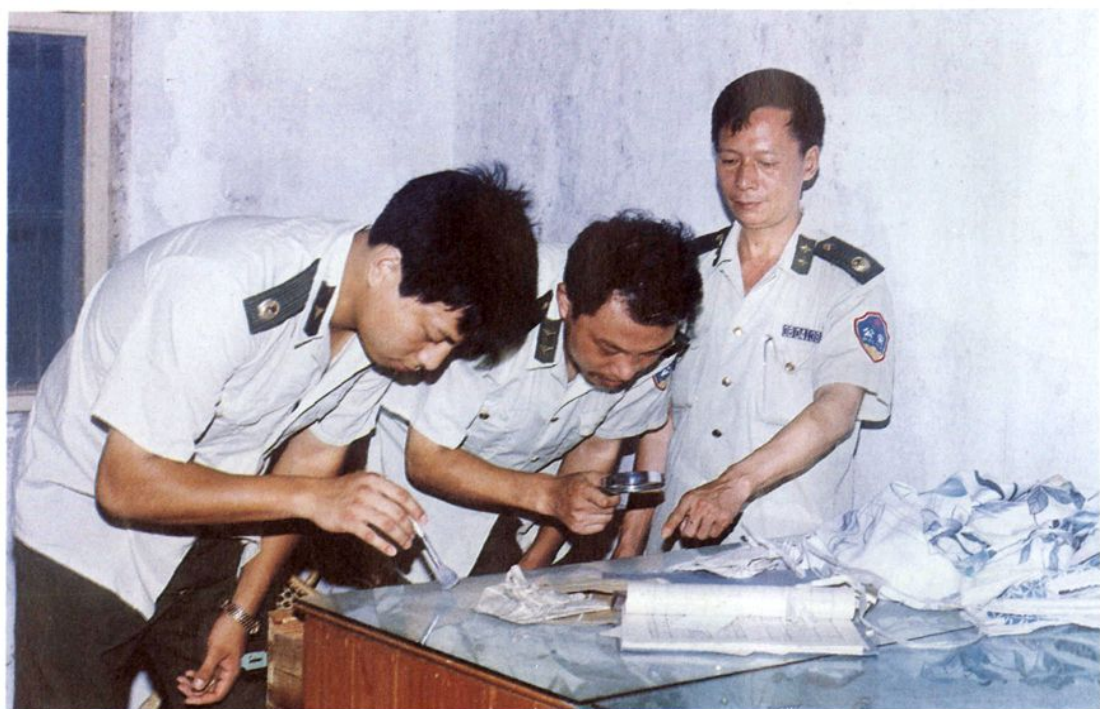
刑事侦察人员在勘察现场。