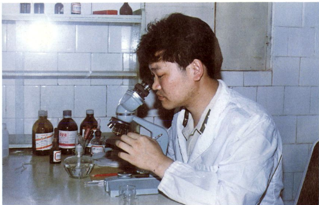
刑侦技术人员在化验分析。