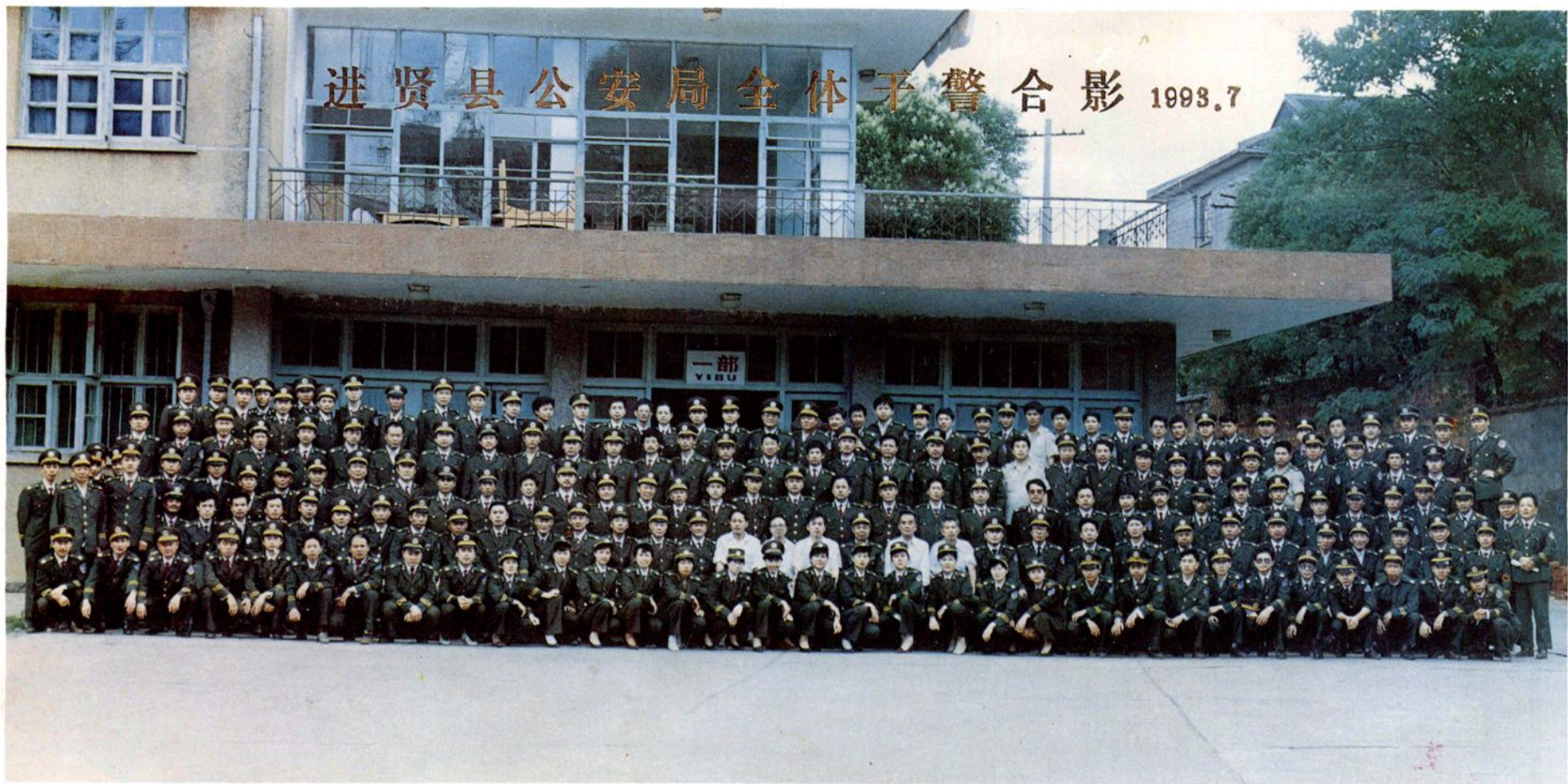
进贤县公安局全体干警合影。