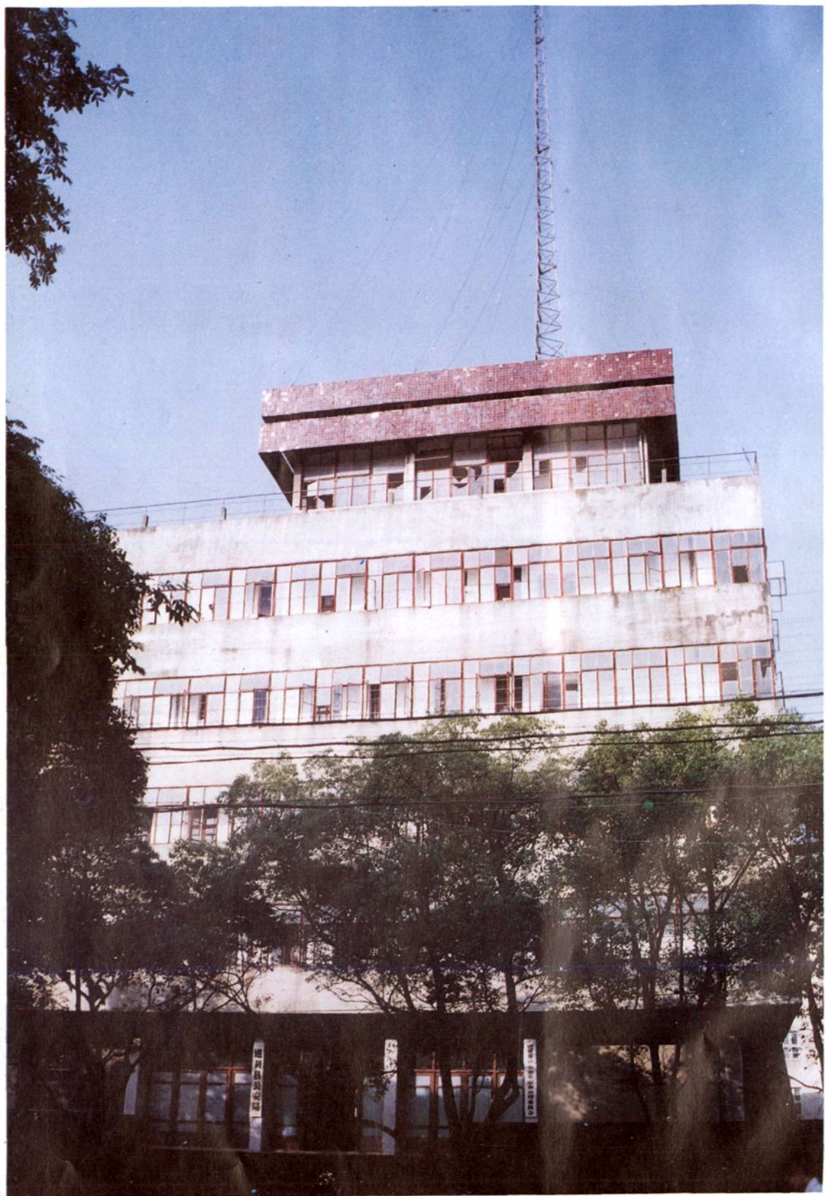
进贤县公安局办公大楼。