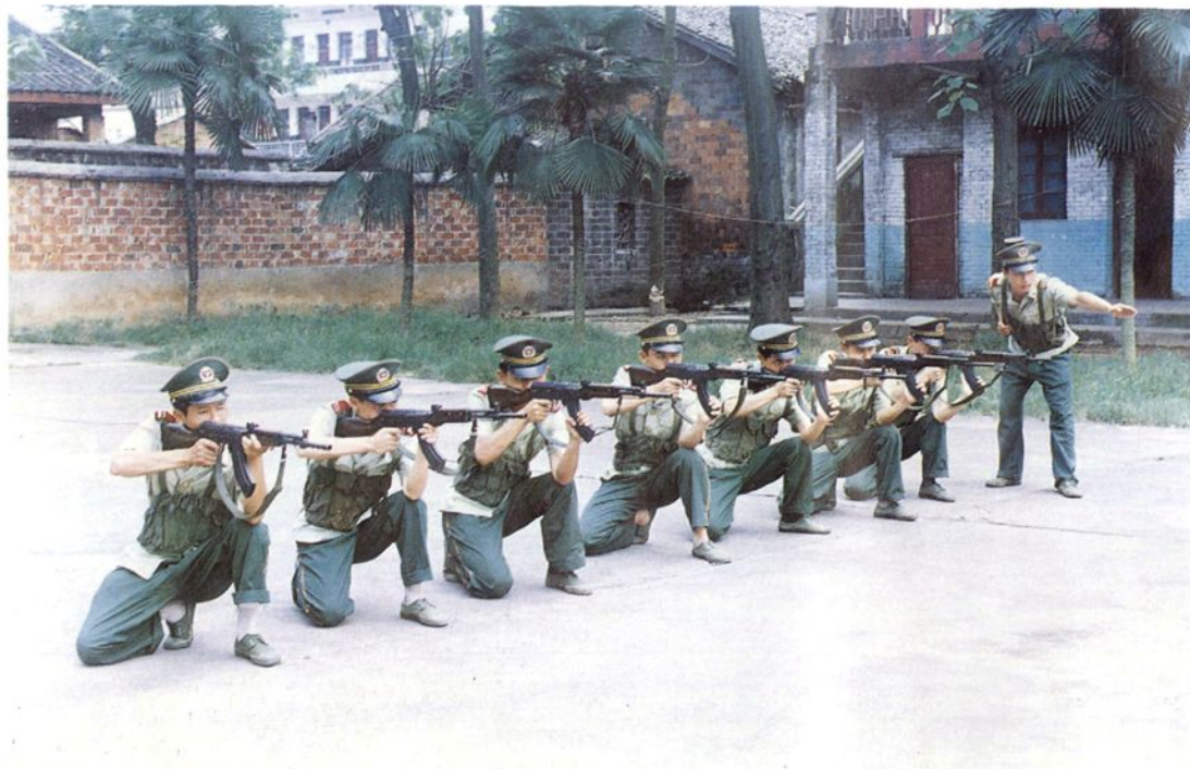
民警在进行射击训练。