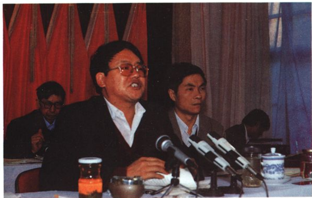
市长杨应楠在作政府工作报告的说明。