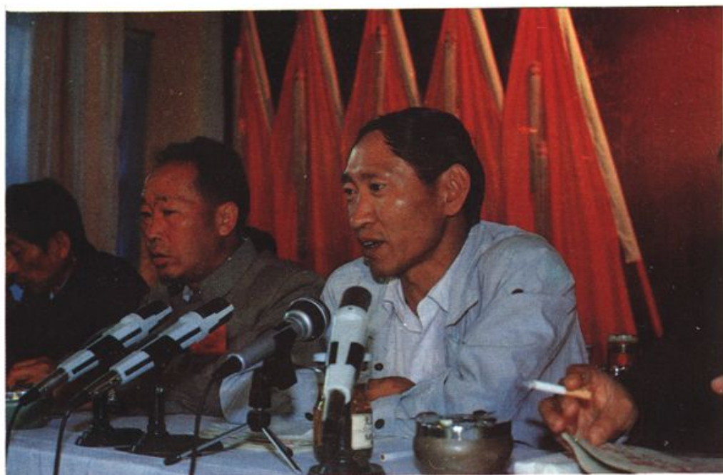
市委书记罗正富在市政协三届一次全会上讲话。