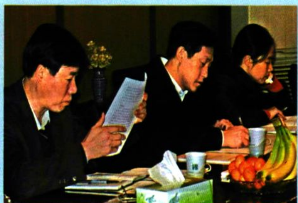
↑ 2006年12月，省科技厅厅长蒋泰维来我院调研。