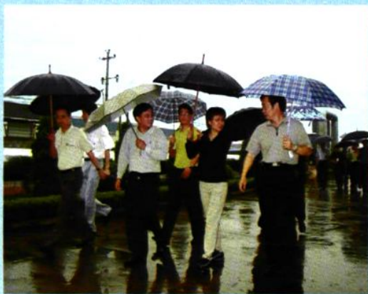
↑ 2004年4月，国家环保总局模范城市考察组视察我院控股的BOT公司。