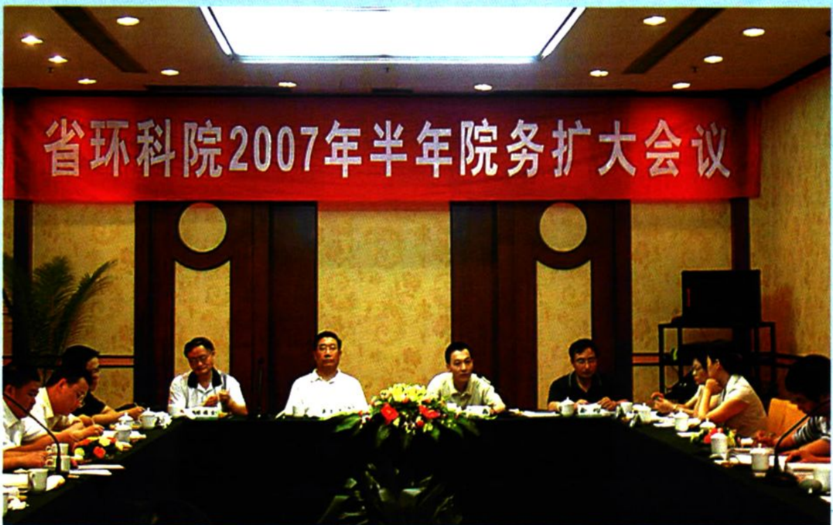
↑ 2007年7月，省环保局副局长吴玉琛参加我院院务扩大会议并作重要讲话。