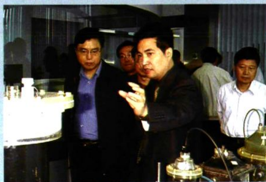
↑ 2001年5月，浙江省委书记张德江视察我院，鞠建林院长介绍重点实验室情况。