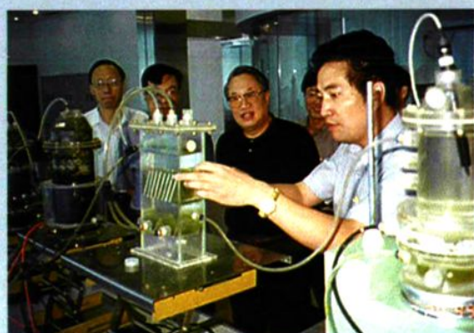
↑ 1999年7月，国家环保总局副局长宋瑞祥视察我院重点实验室。