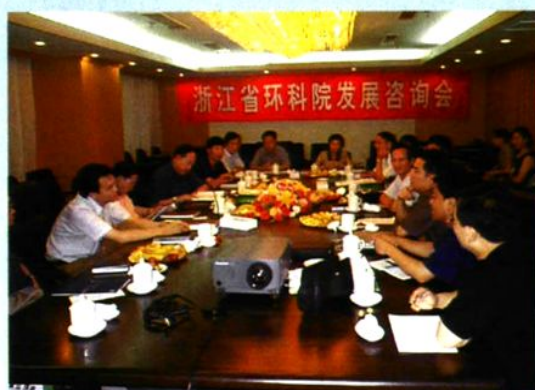
↑ 2001年7月，我院在北京召开院发展咨询会，国家环保总局科技司领导参加会议。