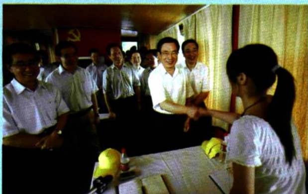
← 2007年6月，我院嘉兴分院党员参加南湖红船“水上党校”活动，巧遇贺国强、赵洪祝、吕祖善等中央和省领导，图为中央和省领导与嘉兴分院党员亲切交谈。