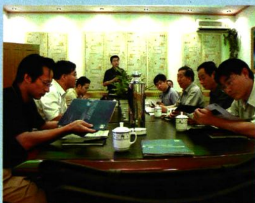
↑ 2002年7月，国家环保总局副局长王心芳来我院指导工作。