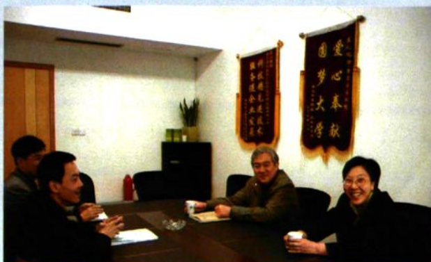
2007年11月，我院现任院党委委员、院长合影。 →