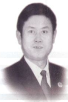
现任副检察长陈晓春