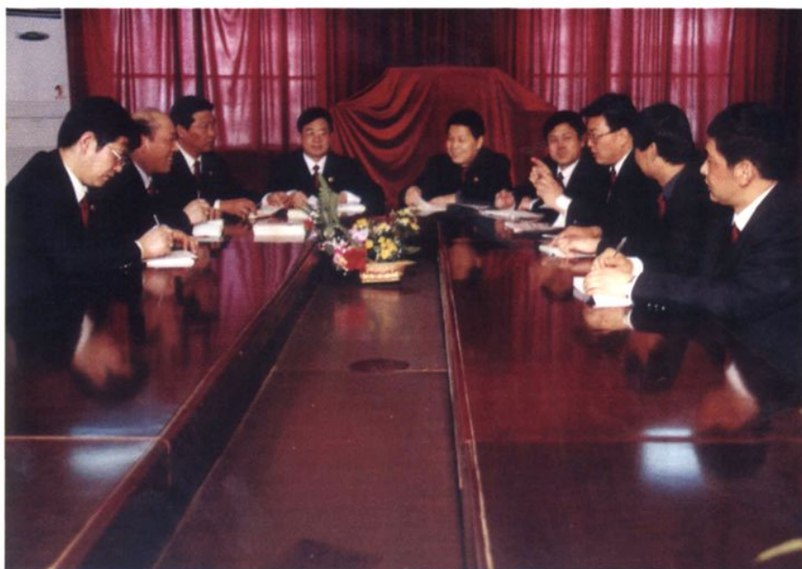
院务会议在研究工作