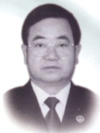
现任检察长范庚年