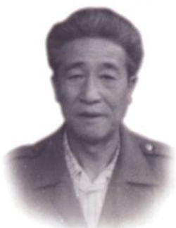
原副检察长吴树标