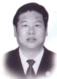
现任副检察长杜泽民