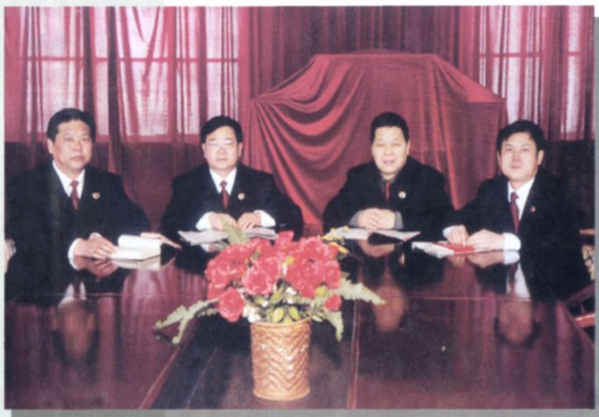
团结奋进的院领导班子