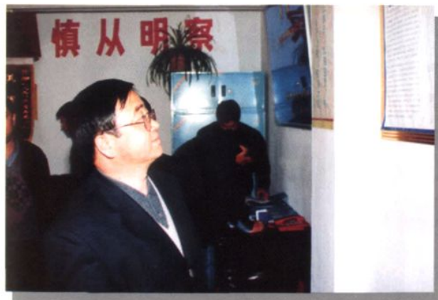
认真学习兄弟院先进经验