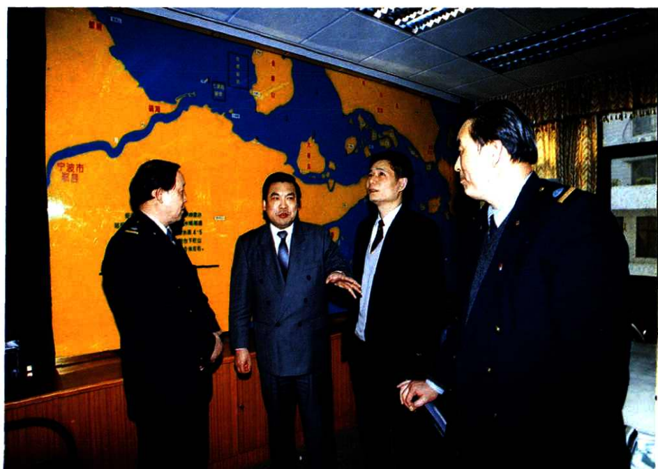
宁波市市委书记许运鸿、副市长吕国荣在宁波海监局视察。