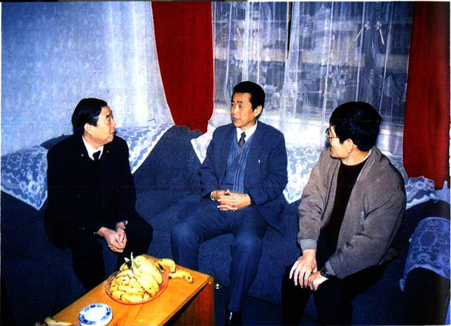
1987年10月11日,交通部 副部长林祖乙在宁波市副市长 叶信虎陪同下视察宁波海监局