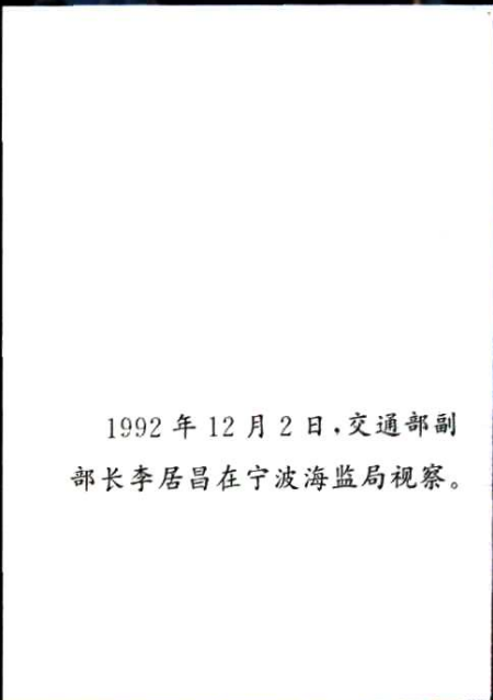
1992年12月2日,交通部副 部长李居昌在宁波海监局视察。