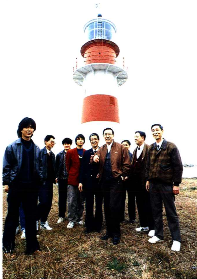
1995年1月18日,交通部副部长刘松金、安监局局长林玉乃在白节灯塔慰问职工。