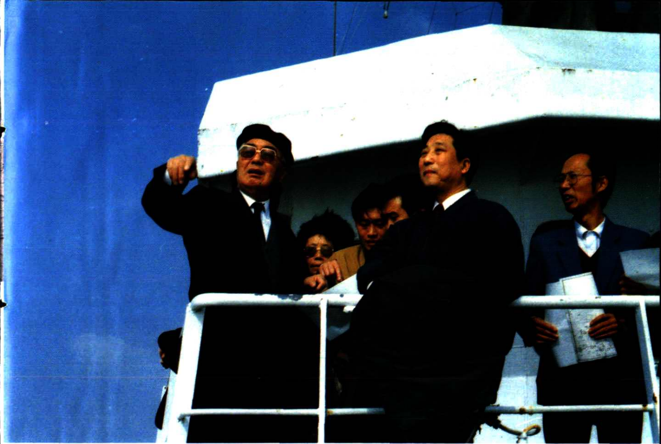
1992年11月7日,全国人大常委会副委员长荣毅仁视察大榭岛。