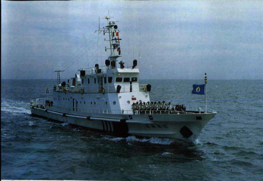
海监巡逻艇“东海巡 12 号”英姿