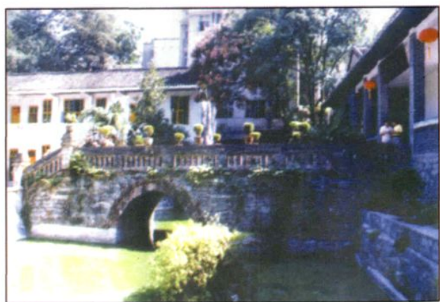
小 桥 月 池