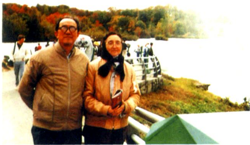
中国科学院院士肖纪美偕夫人