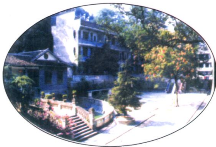
校 园 一 角