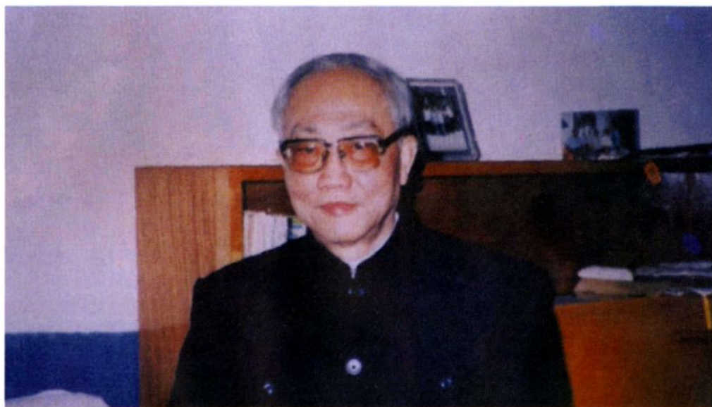
全国七届人大代表、著名化学专家、 全国五一劳动奖章获得者田家乐先生