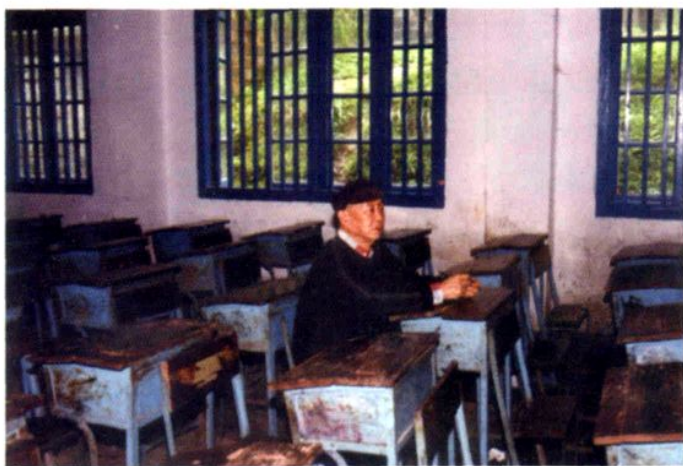
著名画家黄永玉在 童年读书时的教室