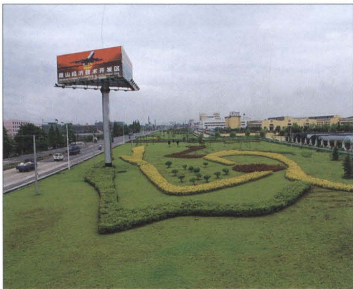
萧山经济技术开发区