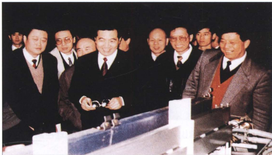
—一九九三年十一月二十三日中共中央政治局常委、书记处书记胡锦涛视察萧山。