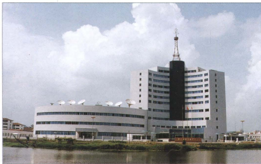
萧山广播电视中心