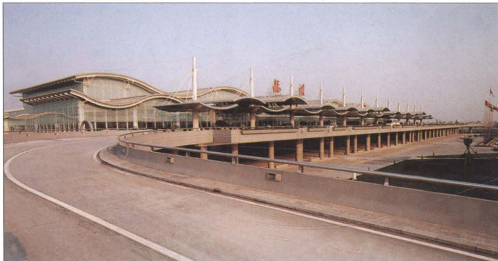
杭州萧山国际机场