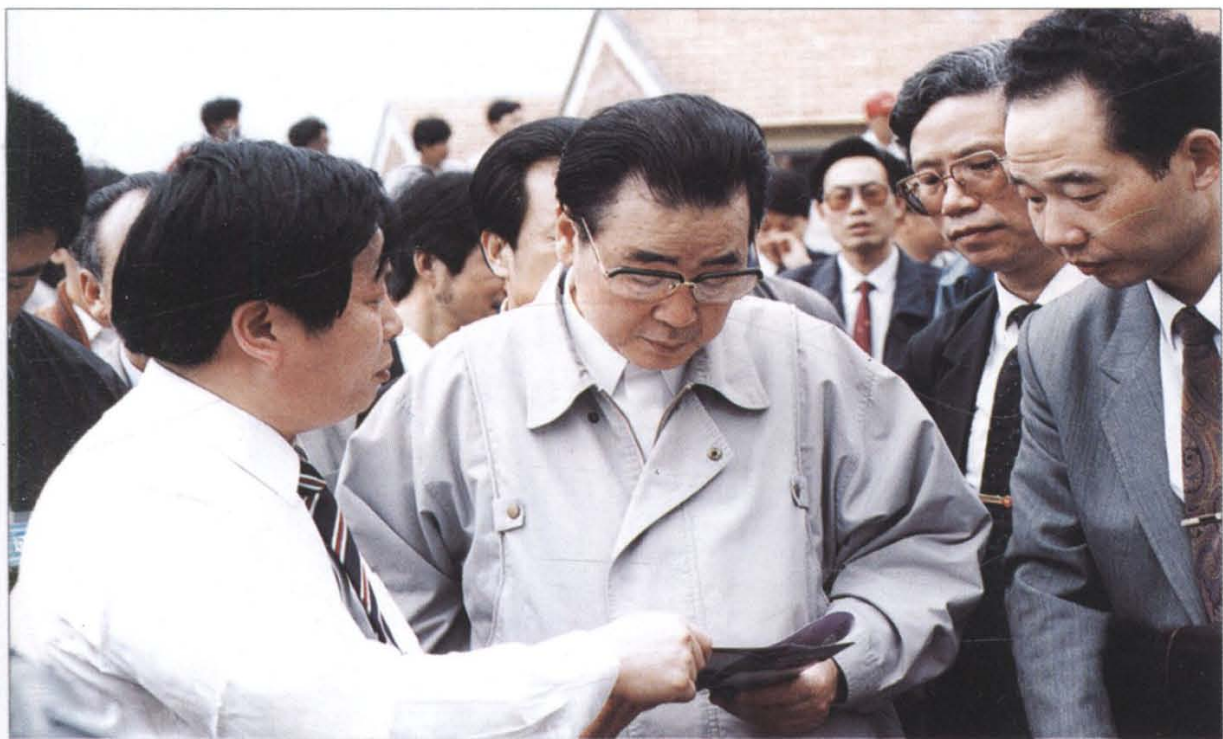
李鹏委员会长曾两次视察萧山。图为1992年5月李鹏总理在萧山钱江外商台商投资区考察。