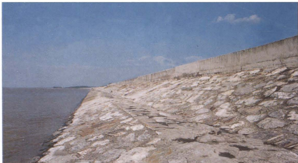
可抵御五十年一遇大潮的标准堤塘