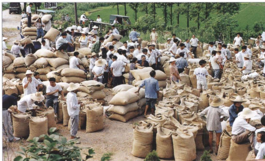
农业连续获得十三个丰收年