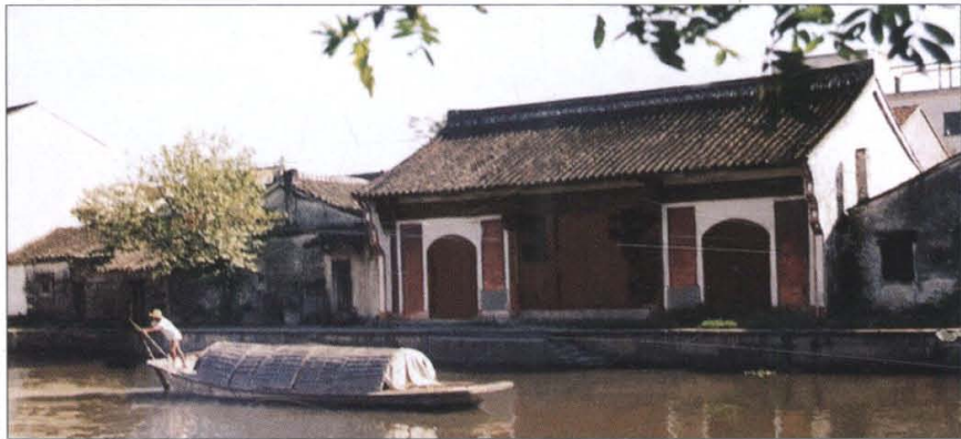
衙前农民协会旧址