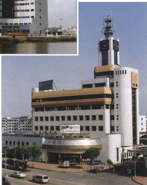
萧山电信营业大楼