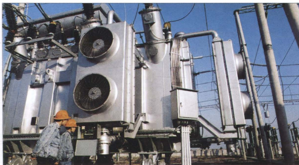
欣欣向荣的萧山电力事业