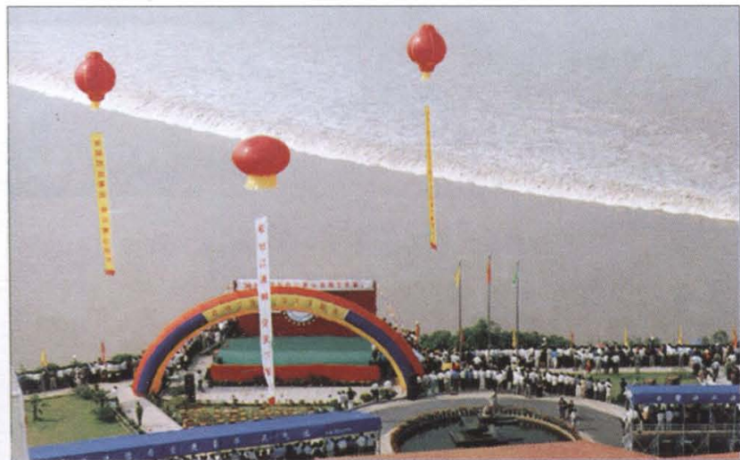
钱江观潮节 一年一度的中国国际(萧山)