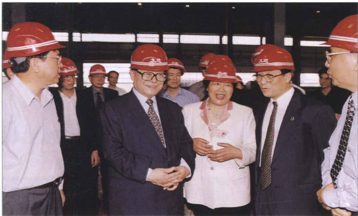
1991年以来，江泽民总书记曾三次视察萧山。图为2000年5月11日，江泽民总书记在萧山视察。