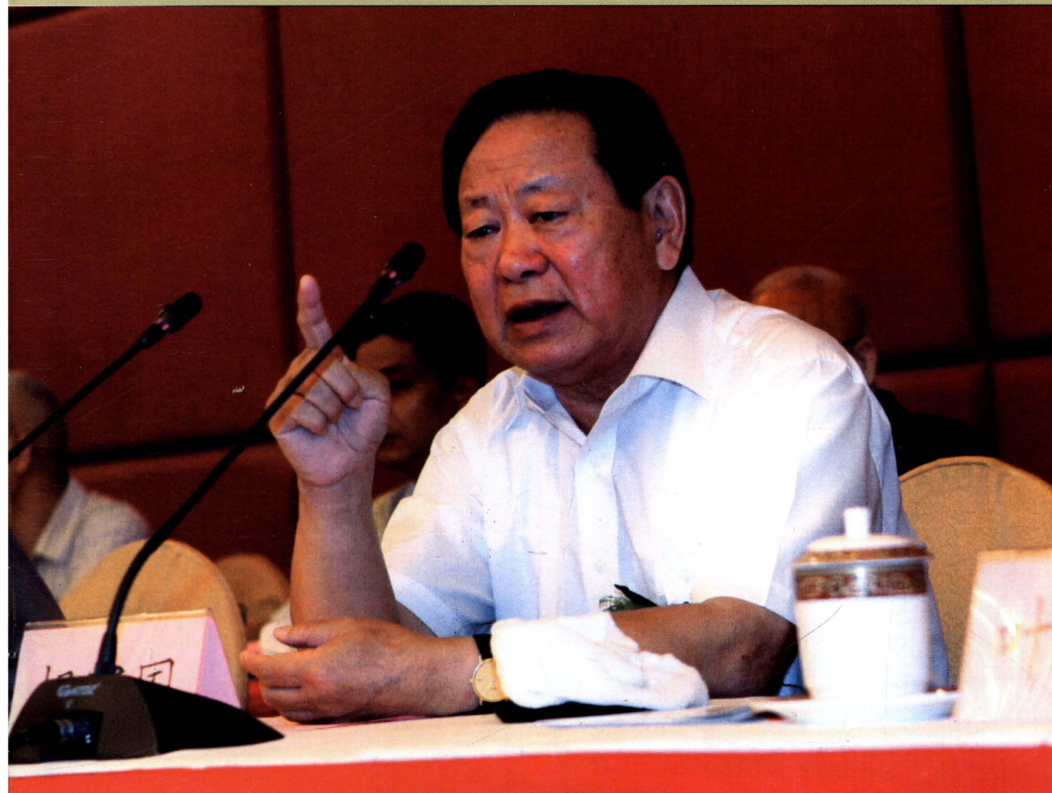
原中共中央委员、山西省委书记 胡富国