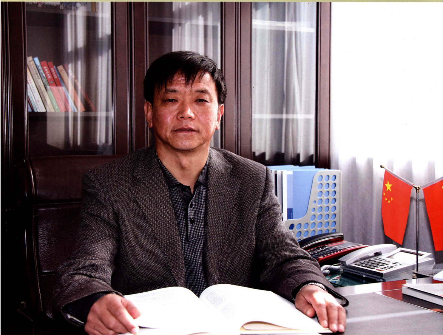
长子县人大常委会主任 花俊富