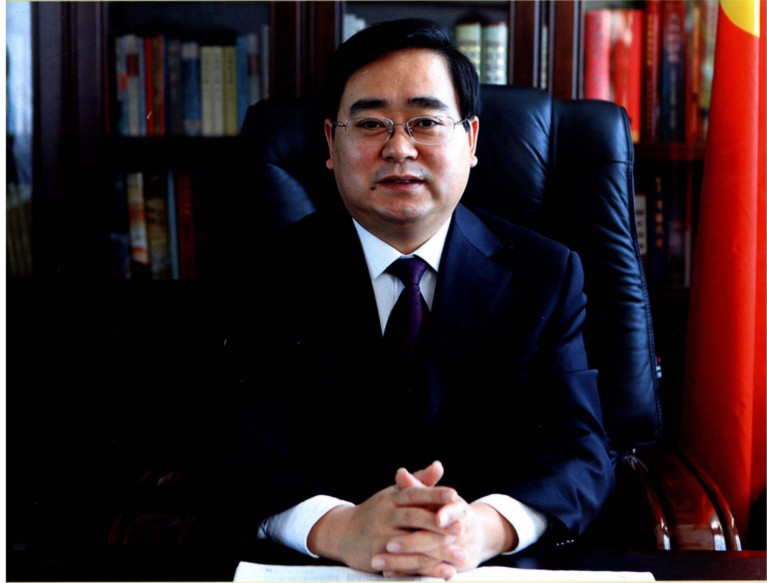
长子县人民政府县长 卢展明