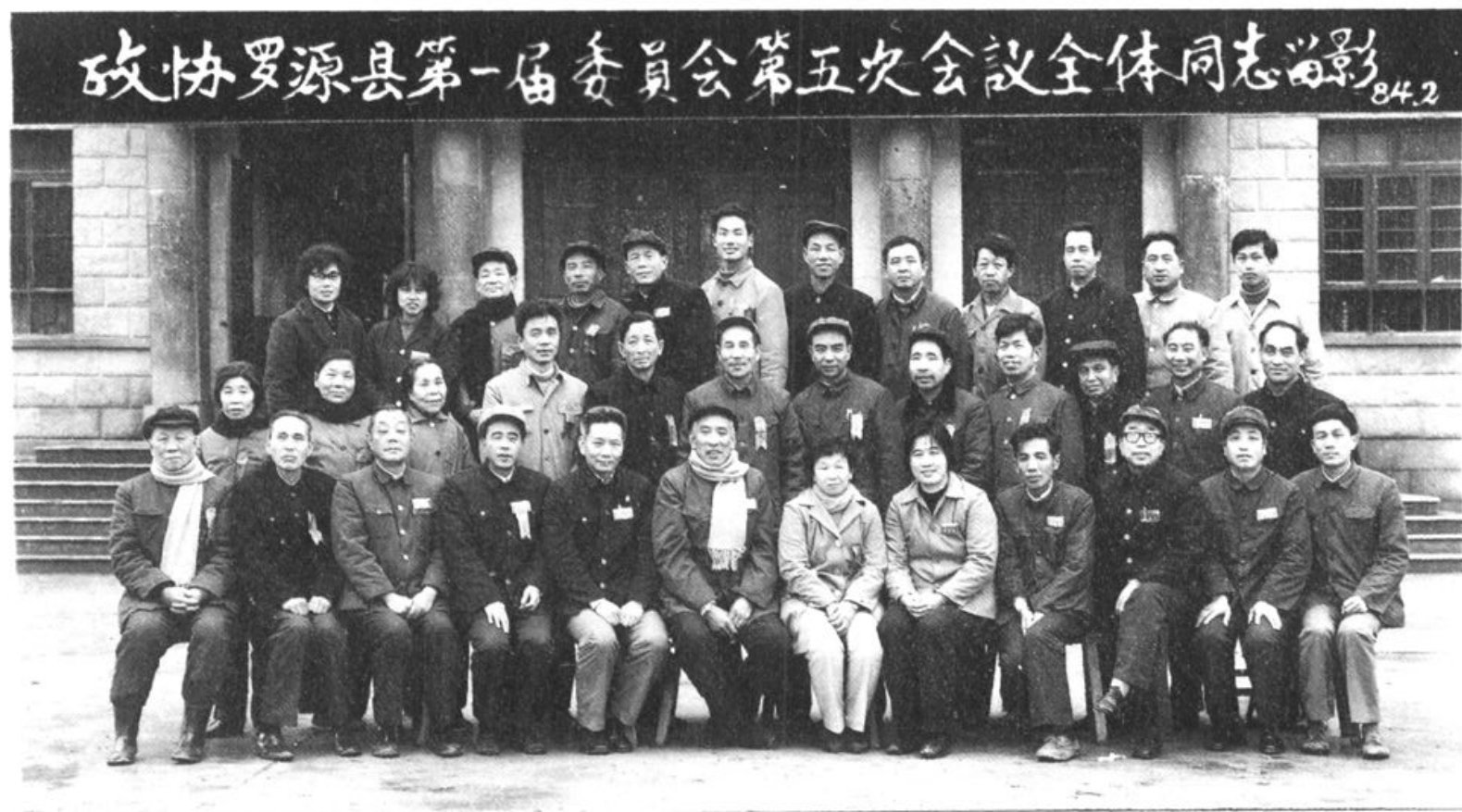
政协罗源县第一届委员会全体委员合影