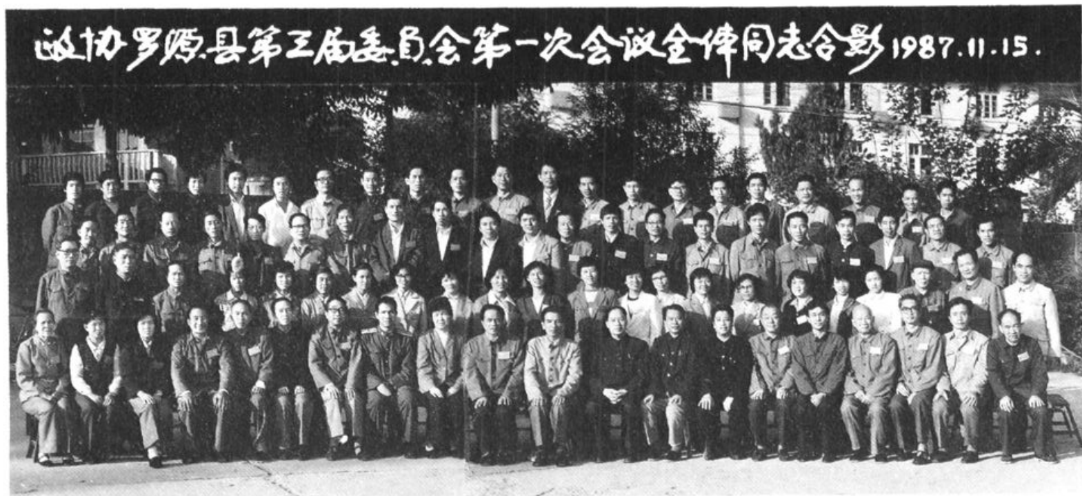
政协罗源县第三届委员会全体委员合影