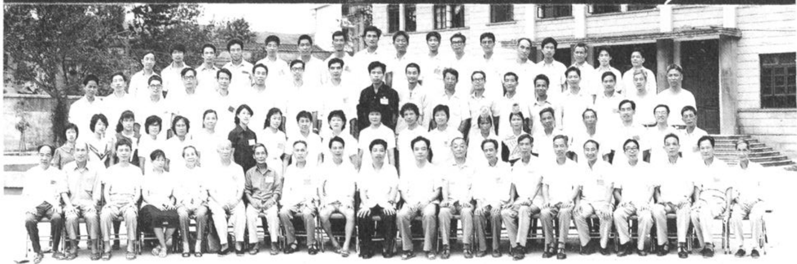
政协罗源县第二届委员会全体委员合影