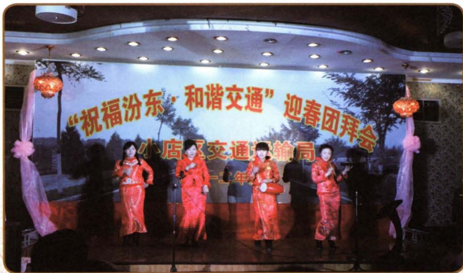
2012年1月，小店区交通运输局举办迎春团拜会。