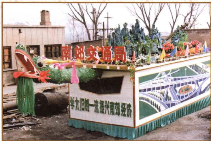
1995年南郊区交通局制作的社火和彩车