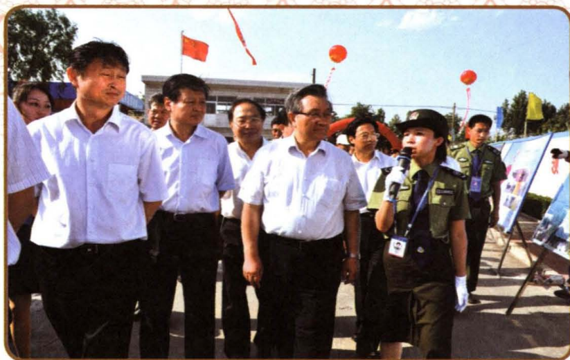
2009年7月23日，时任交通运输部部长李盛霖（前右二）一行视察小店区治超工作。