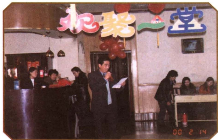
2000年春节期间，小店区交通局举办欢聚一堂联欢会。