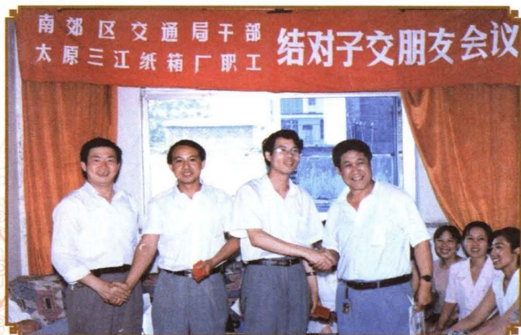
1997年6月，南郊区交通局干部与三江纸箱厂职工结对子。