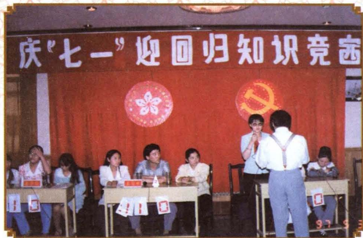
1997年5月，南郊区交通运输局举办庆“七一”迎回归知识竞赛。