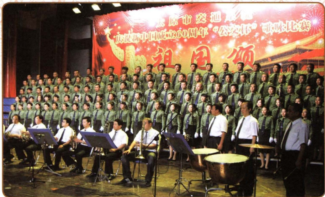
2009年9月，小店区交通局组团参加太原市交通系统庆祝建国60周年“公交杯”歌咏比赛，荣获三等奖。