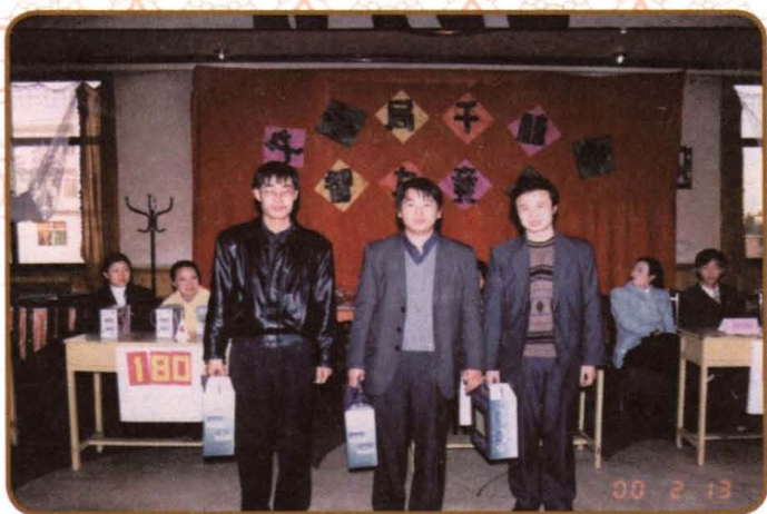
2000年，小店区交通局举办“千喜杯”职工智力竞赛。