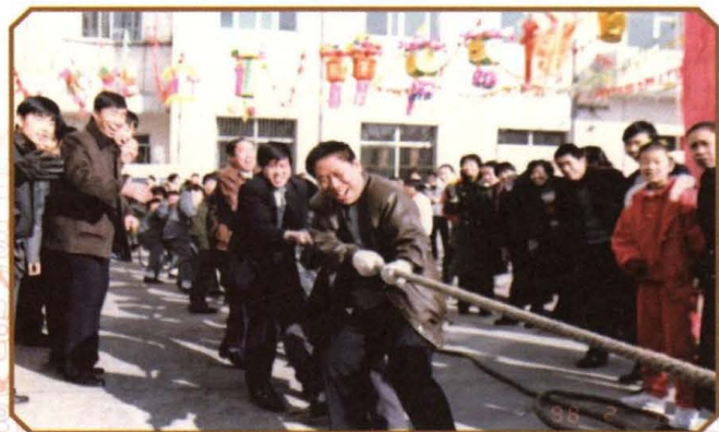
1996年春节期间，南郊区交通局举办拔河比赛。