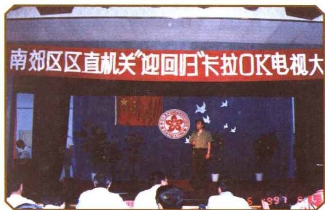
1997年6月，南郊区交通局组团参加区直机关卡拉OK电视大赛。