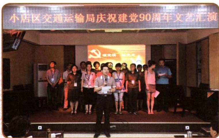
2011年7月，小店区交通运输局举办庆祝建党90周年文艺汇演。