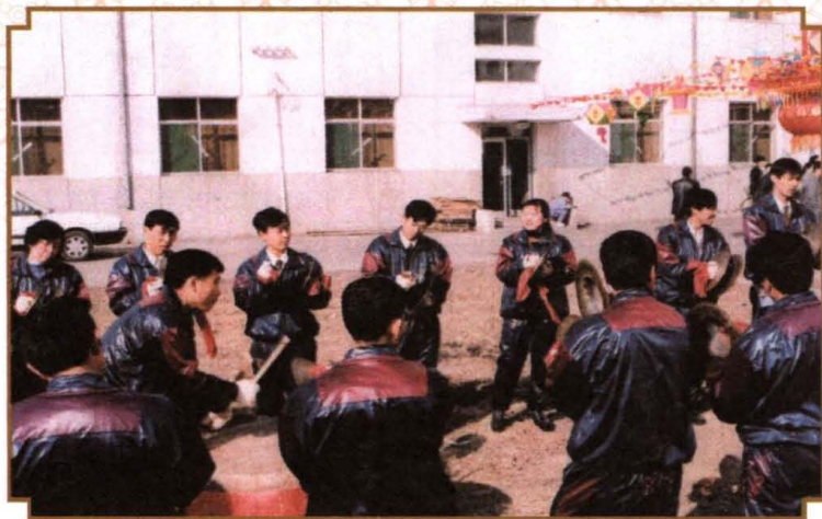
1997年，南郊区交通局锣鼓队进行排练。