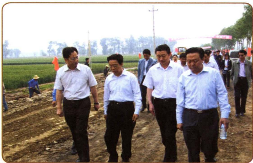
2009年5月，时任小店区区长常青（前左一）陪同副省长牛仁亮（前左二）等省市领导视察小店区乡公路郝南线改建工程。