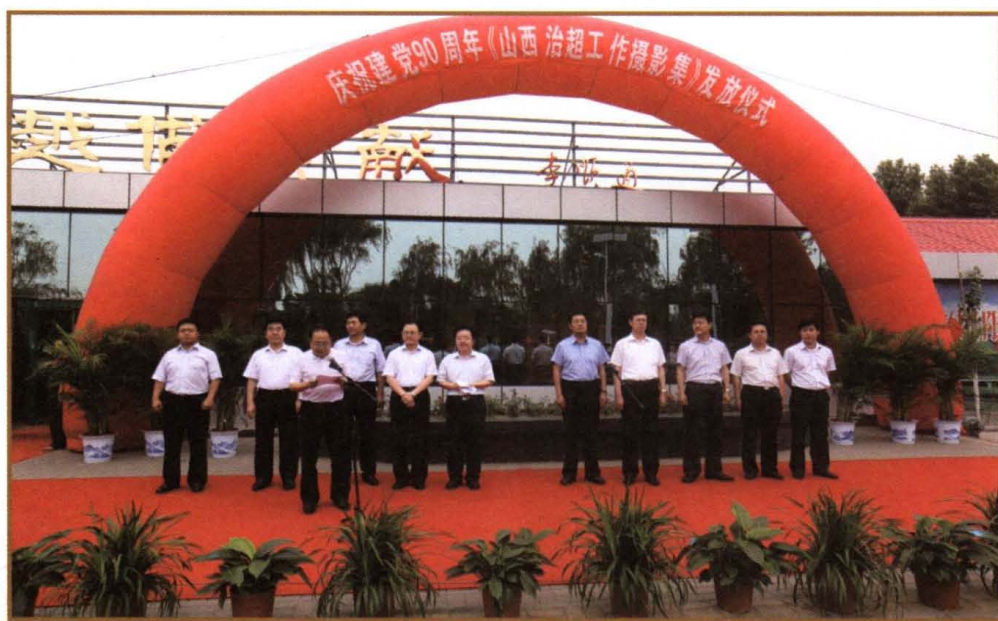
2011年7月1日，省治超办“庆祝建党90周年《山西治超工作摄影集》发放仪式”在刘家堡超限检测站举行。时任省治超领导小组副组长、省政府副秘书长崔国红，省治超领导小组组长特别助理李顺通，太原市常务副市长李俊明，时任小店区区委副书记、区长陈向阳，副区长张耀等省市领导出席了发放仪式。