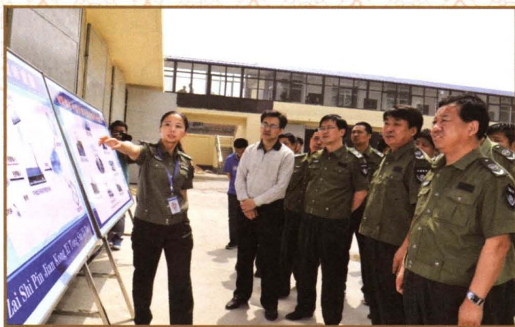
2011年5月30日，全省治超观摩会领导参观小店区治超工作。