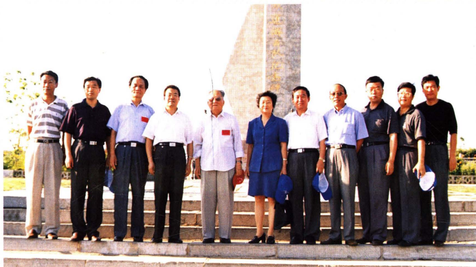
2001年9月，原山东省人大常委会主任李振视察微山工作。县委书记、县人大常委会主任秦绍忠，县委副书记、县长孔维民陪同视察。