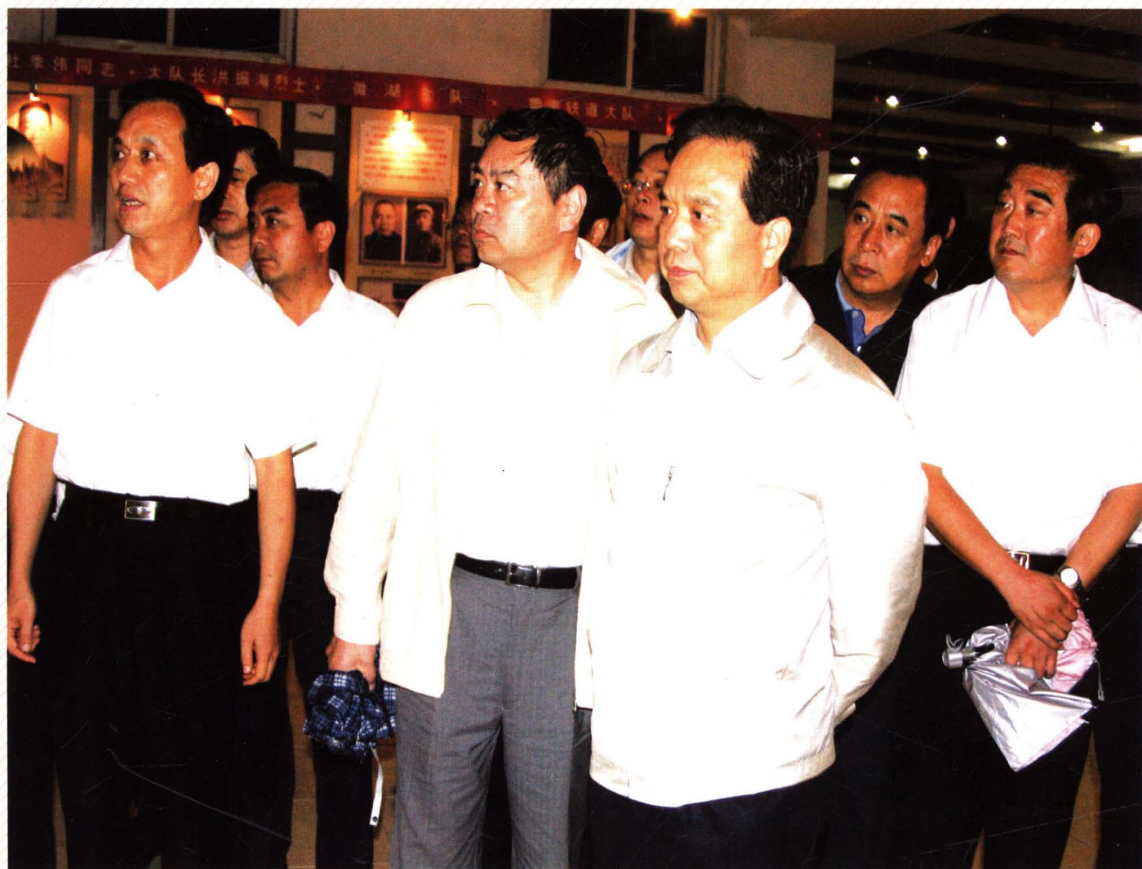
2007年8月31日，山东省委书记、省人大常委会主任李建国来微山调研鲁南经济带规划建设。县委书记、县人大常委会主任罗心光陪同调研。