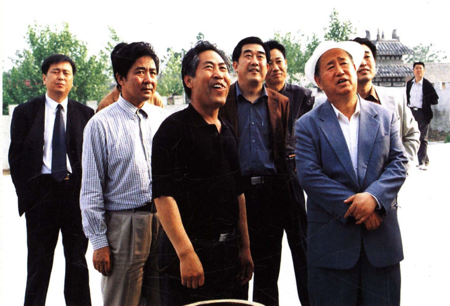
2004年5月12日，原中共中央政治局委员、全国人大常委会副委员长姜春云视察微山工作。县委书记、人大常委会主任孔维民，县委副书记、县长罗心光陪同视察。