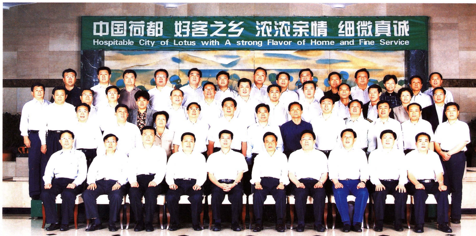
2006年10月17日，山东省委书记、省人大常委会主任张高丽视察微山工作。济宁市委书记、市人大常委会主任孙守刚，县委书记、县人大常委会主任孔维民，县委副书记、县长罗心光陪同视察。