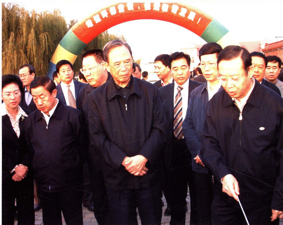
2005年10月31日，中共中央政治局委员、国务院副总理曾培炎来微山调研南水北调山东段治污工作。山东省委书记张高丽，省委副书记、省长韩寓群，县委书记、人大常委会主任孔维民陪同调研。