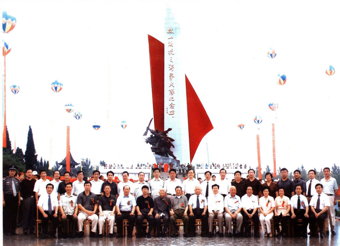
2004年7月16日，原山东省委书记梁步庭，原微湖大队政委孙新民，山东省委副书记王修智，济宁市委书记、市人大常委会主任贾万志，县委书记、人大常委会主任孔维民，县委副书记、县长罗心光，人大常委会副主任、党组书记李玉启出席“微山湖抗日游击大队纪念碑”落成仪式。碑名为梁步庭题写。