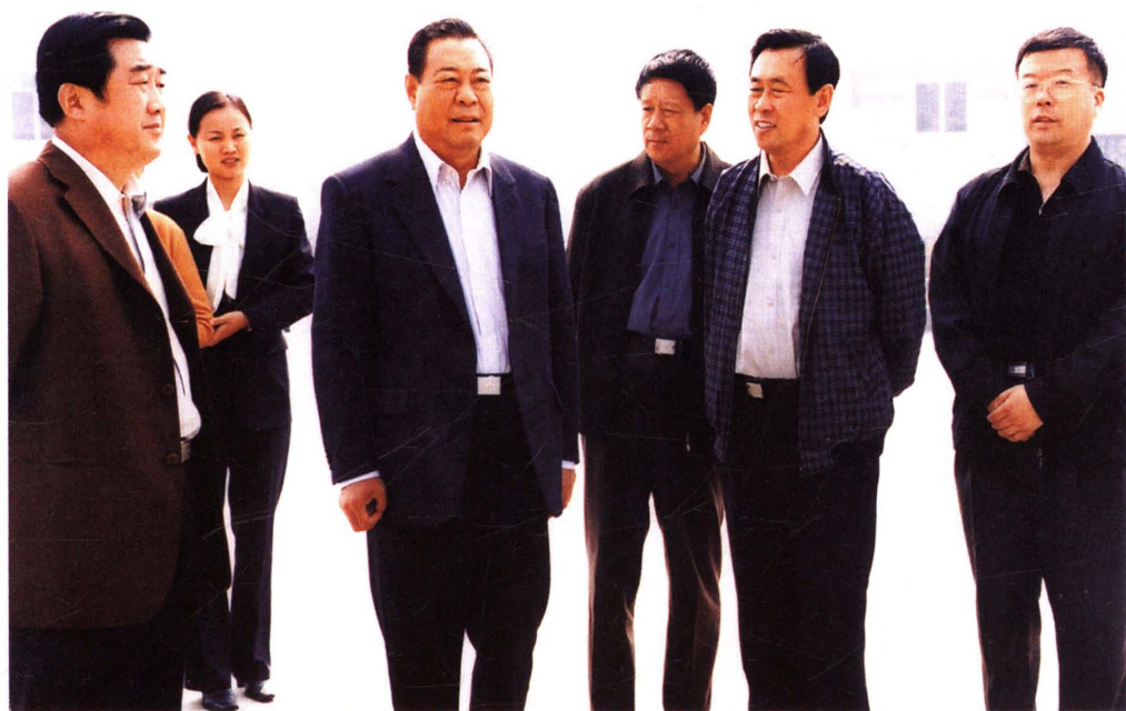
2004年10月11日，全国人大常委会委员、全国人大农村与农业委员会副主任委员李春亭在济宁市人大常委会副主任梁东成，县委副书记、县长罗心光，县人大常委会副主任、党组书记李玉启陪同下视察微山工作。