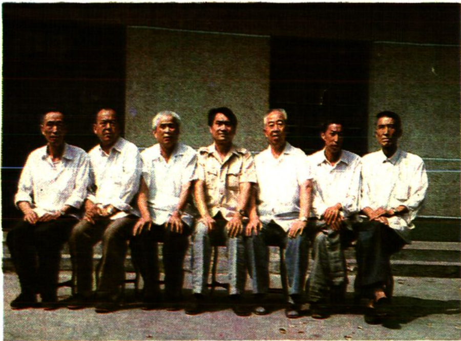
内乡县粮食局领导班子（自左至右）