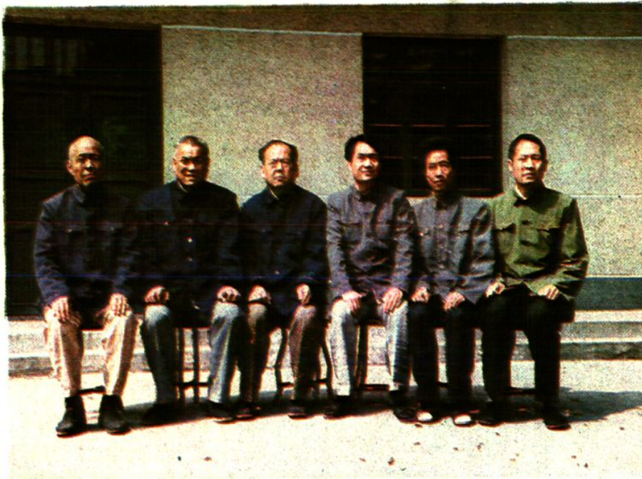
内乡县粮食志编辑室人员（自左至右）