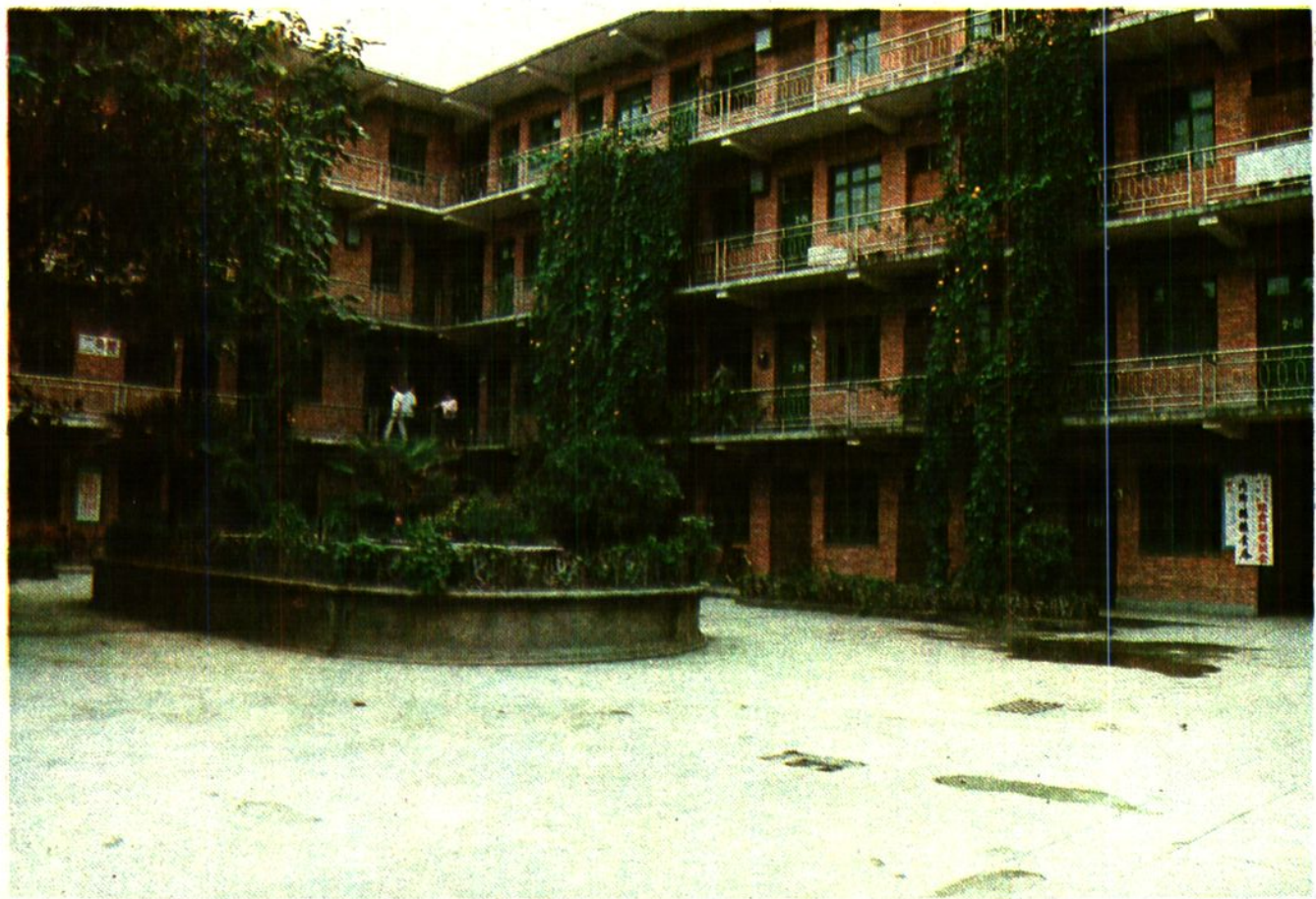
内乡县粮食局办公大楼