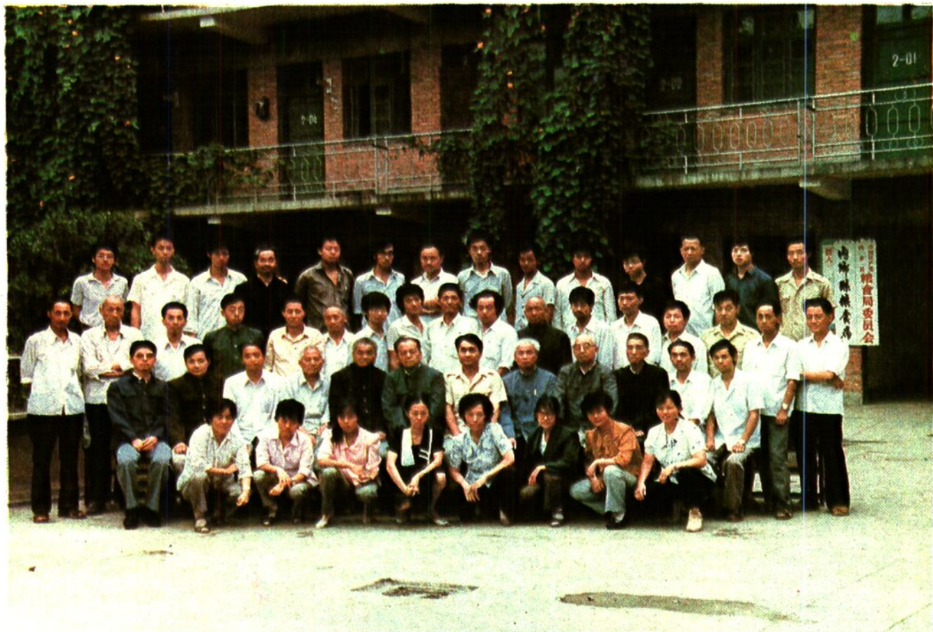
内乡县粮食局全体同志合影