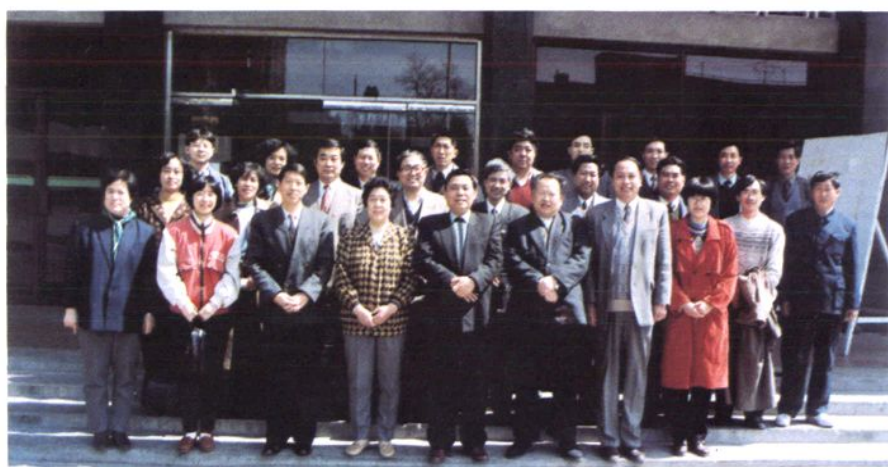
新委员学习班合影 (一九九六年四月十日)