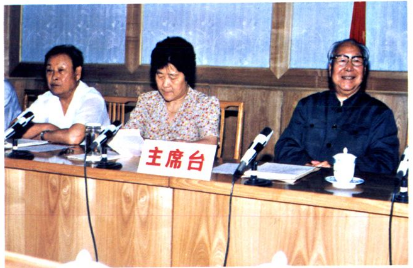
右图：市政协召开“滦东抗战研讨会”，原冀东军区司令员李运昌（右一）出席并讲话。市政协主席朱桂英、原副主席孙学海和李运昌同志在主席台上。