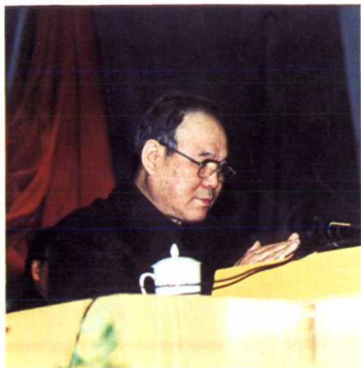
市委书记白芸生致辞祝贺。