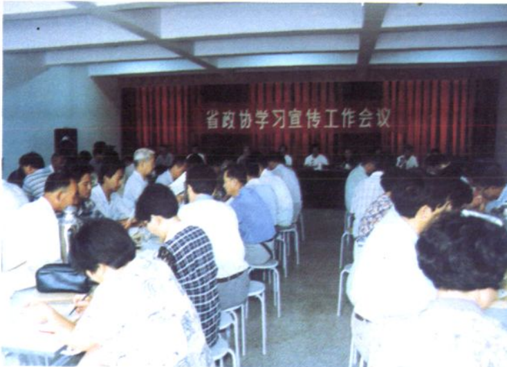
省政协学习宣传工作会议在我市召开。