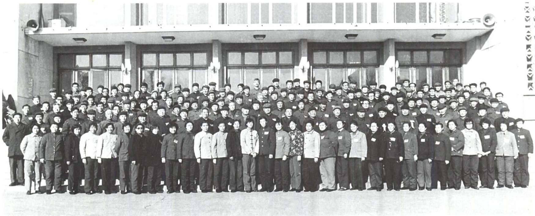
1983年12月4日，市政协六届一次会议全体委员合影。