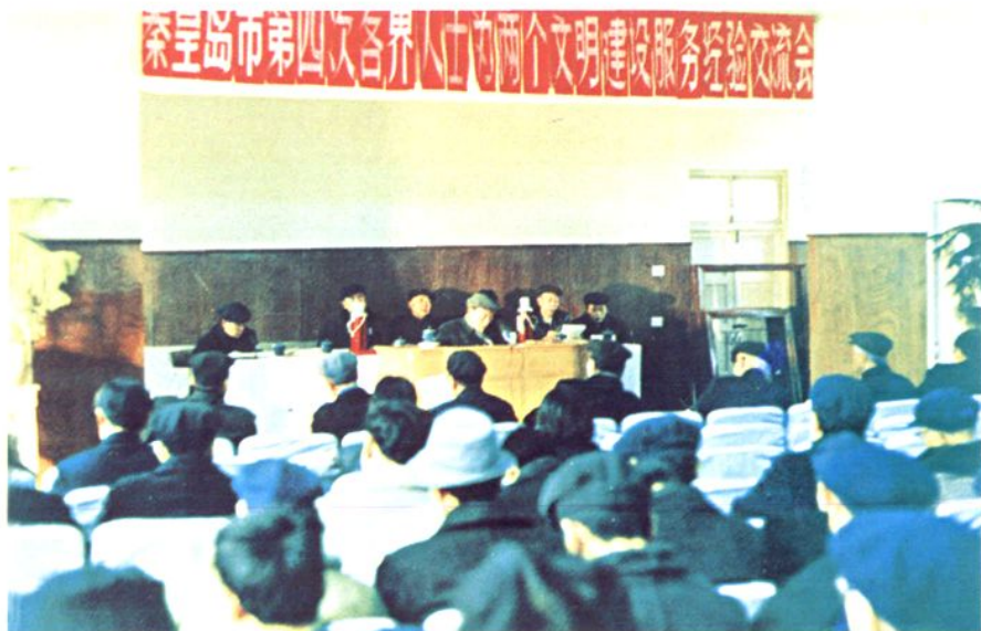
(右图)：秦皇岛市第四次各界人士为两个文明建设服务经验交流会会场(一九八九年十二月十九日)。