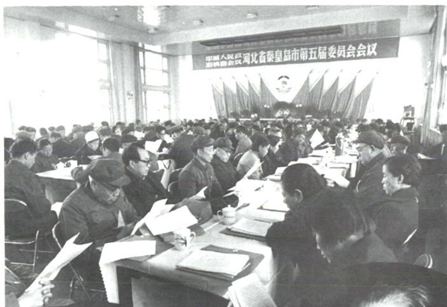
上图：1981年11月6日，秦皇岛市政协五届一次会议在海滨路招待所召开。