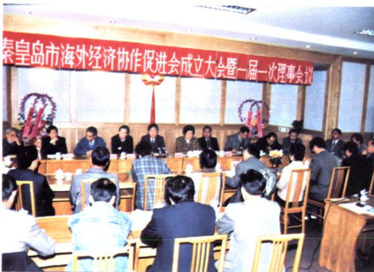
左图: 市海外经济协作促进会成立大会会场。