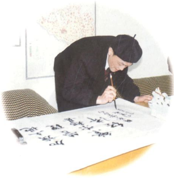
1993年2月国家土地局副司长刘育成来郑视察并题词。