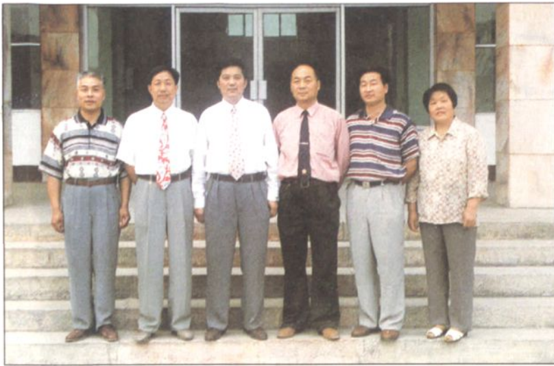
县土地局领导班子成员