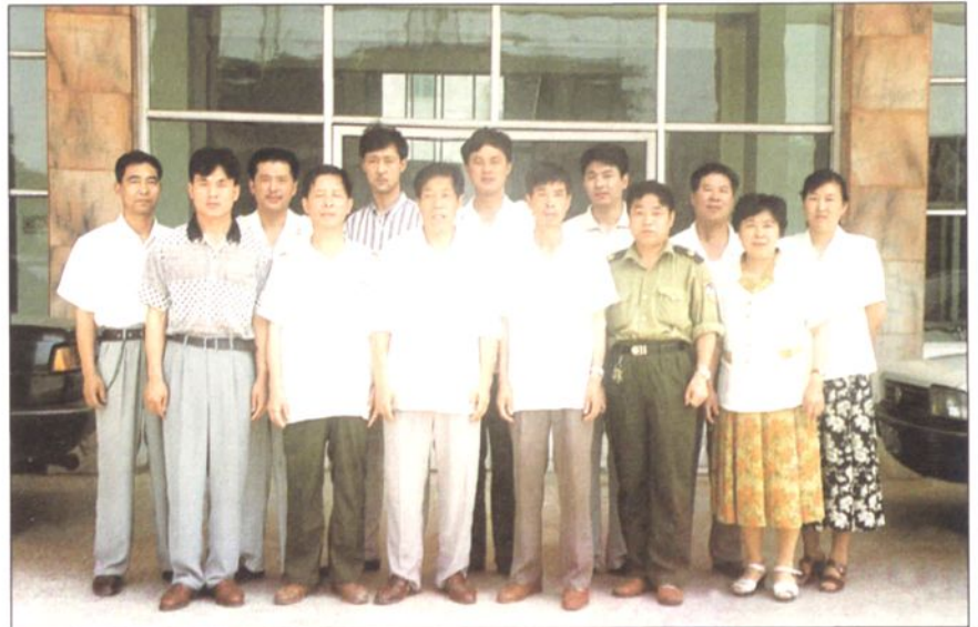
各乡镇土地所所长副所长