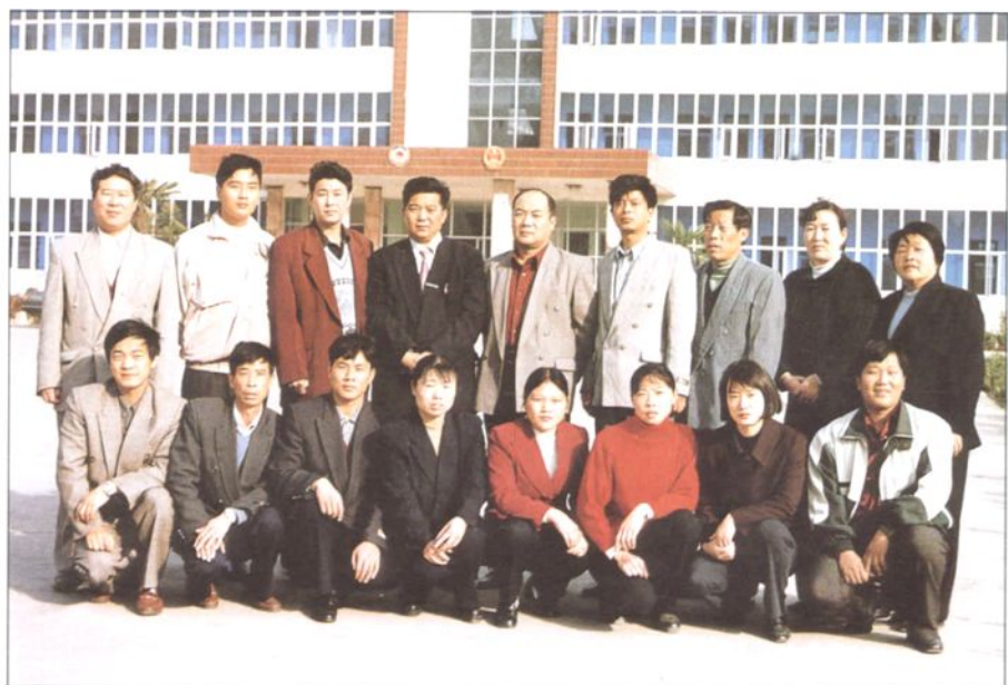
土地志编辑组全体人员