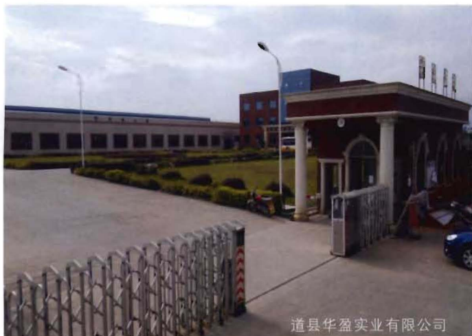
道县华盈实业有限公司