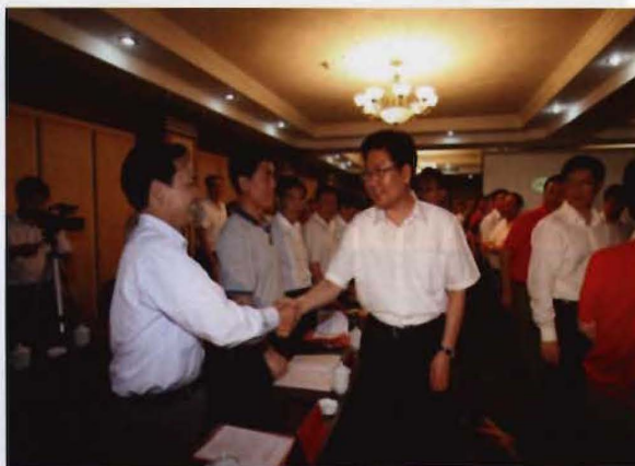
2008年6月，省委书记张春贤（前排左二）到道县指导抗洪救灾工作