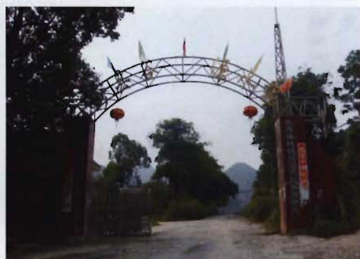
县水泥厂（2005年4月更名为道县谷源水泥有限公司）