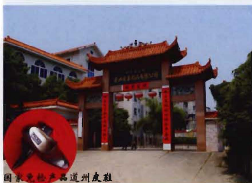
国家免检产品 道州皮鞋