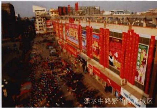
濂水中路繁华商业街区