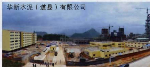
华新水泥（道县）有限公司