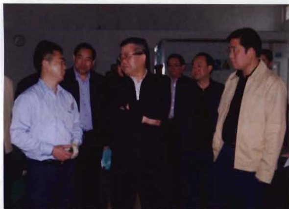
2009年3月，省政协主席胡彪（前排中）考察道县工业园