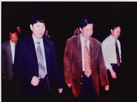
1999年4月，洛湛铁路预可评估团到道县考察评估