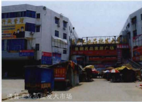
道县工业品批发大市场