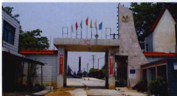
县冶炼总厂（2002年9月更名为道县冶炼有限公司，2005年4月更名为鑫利锰业）