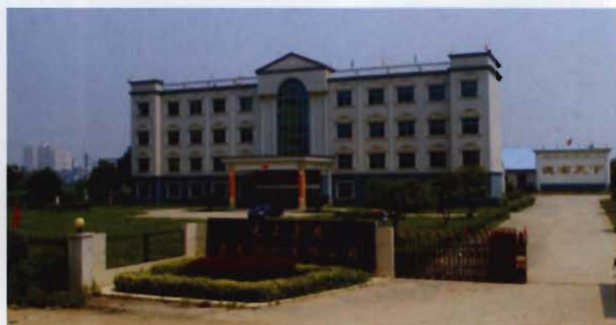
大上集团鑫龙纺织有限公司（2003年6月由县糖厂更名）