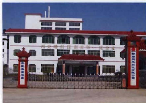
湖南科茂林化有限公司