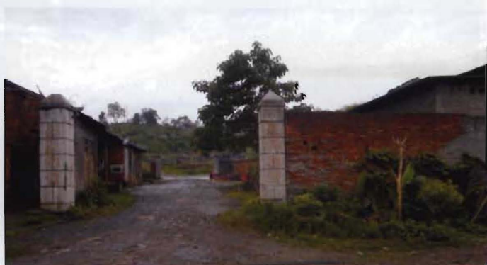
2003年的道县氮肥厂（2004年破产改制）