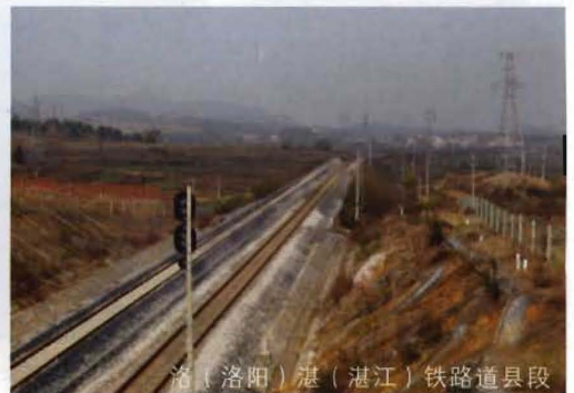
洛(洛阳)湛(湛江)铁路道县段