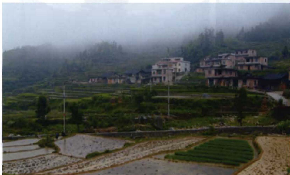
洪塘营乡大洞田村