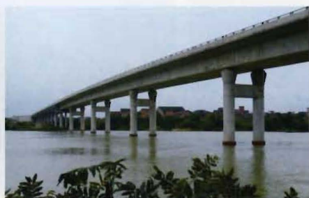
厦(厦门)蓉(成都)高速公路道县段