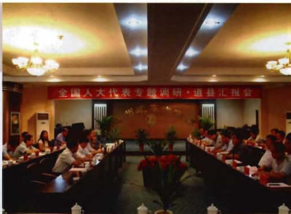
2009年8月，全国人大代表在道县专题调研