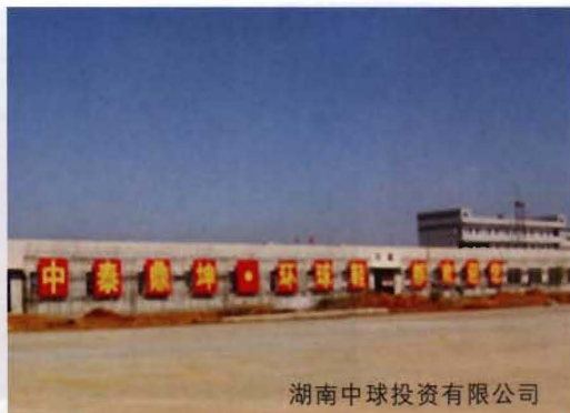
湖南中球投资有限公司