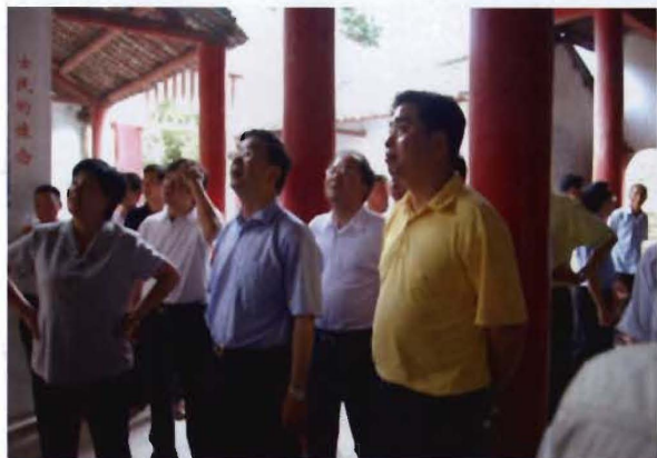
2008年5月，省长周强（前排中）到道县濂溪故里考察工作