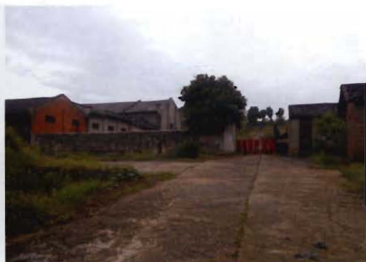
2003年的道县化工厂（2004年破产改制）