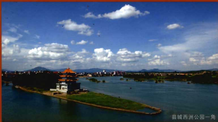
县城西洲公园一角