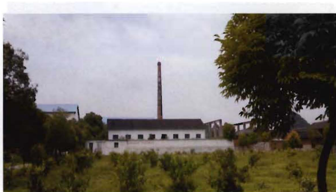
寿雁糖厂（2005年10月更名为谷源粮油食品湖南有限公司）