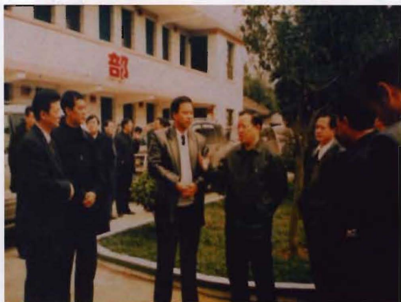
2004年10月，省长周伯华（左四）视察道县福利院