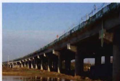
道(道州)贺(贺州)高速公路道县段