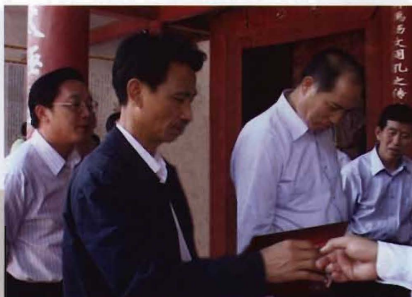
2011年4月，副省长郭开朗（右二）在市委书记黄天锡（右三）的陪同下到道县考察工作