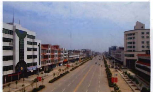
县城道州北路剪影