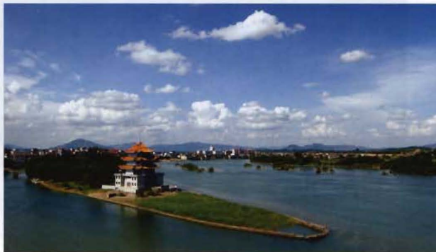
县城西洲公园一角