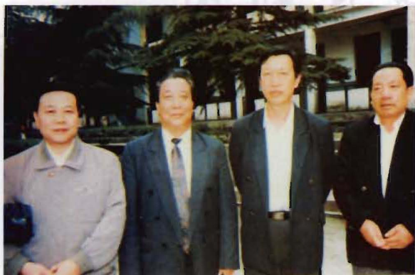
1997年8月，省政协副主席范多富（左二）到道县视察工作