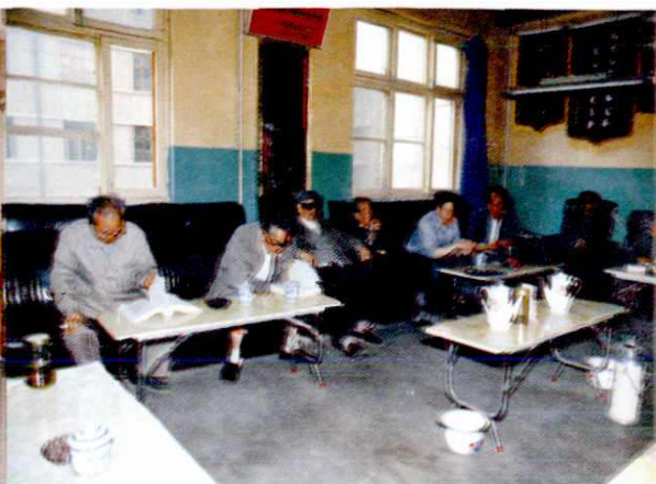
卫生志编委讨论审稿