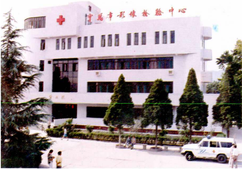
市医学影像检验中心