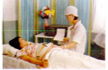
母婴同室 围产期检查