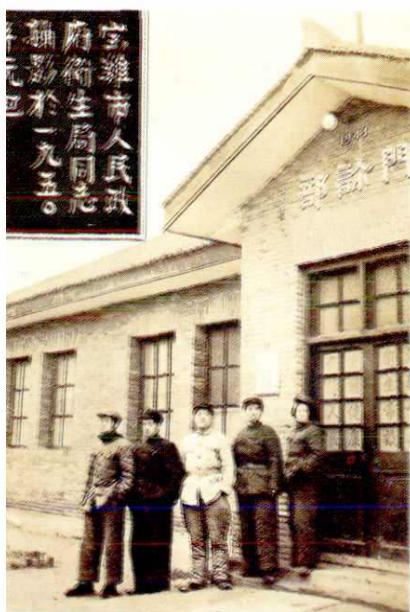
1943年建起的宝鸡实验 卫生院门诊部