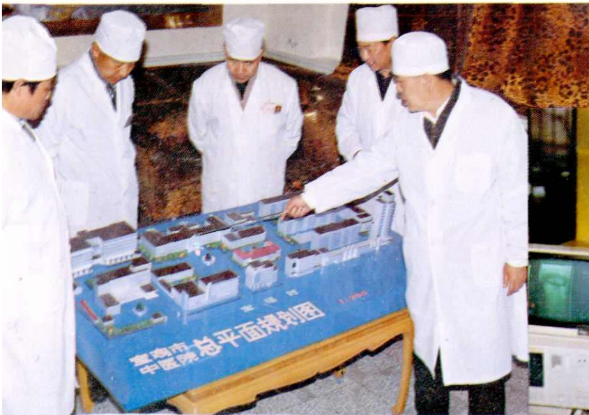
市中医医院领导班子研究医院发展规划