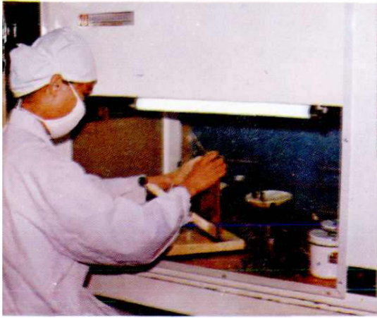
市血站开展成分输血