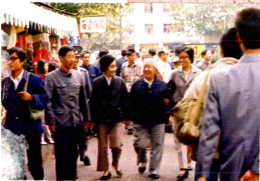
陕西省人大副主任刘力贞（左四）在建国路市场检查卫生。