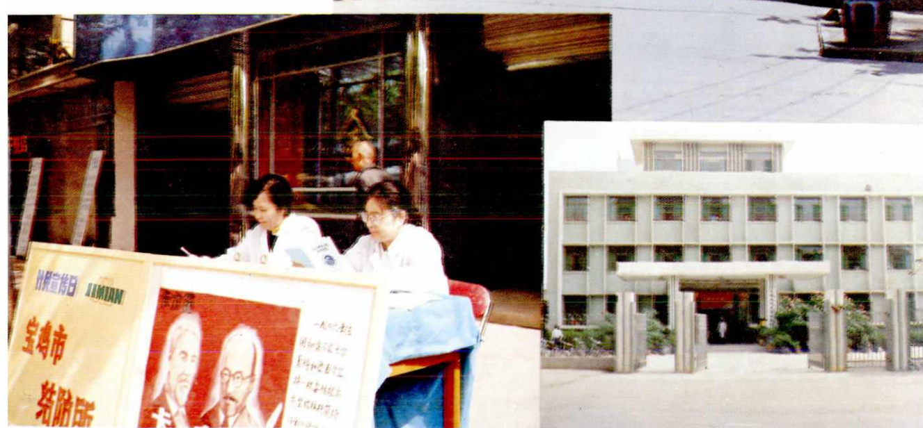
市结防所医务人员上街宣传