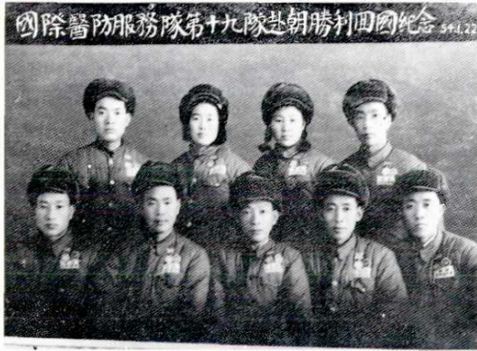
宝鸡市医务人员合影