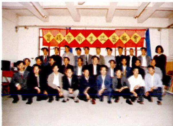
《宝鸡市卫生志》审稿会人员合影