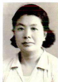
宝鸡市第一任 卫生局局长李光晓 (1954)