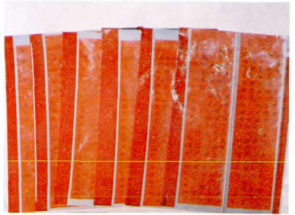
中医邓氏世家铭文 (1929)