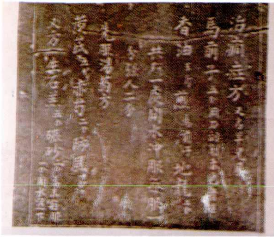
强和亭立《集验良方》碑一角