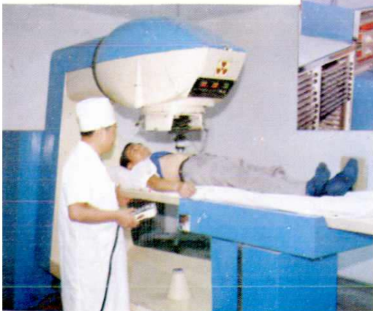
市肿瘤医院钴60治疗机