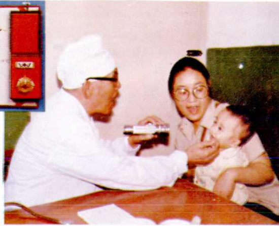
全国劳模刘云山主任医师为小儿诊病