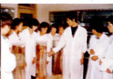
市卫校解剖试验课