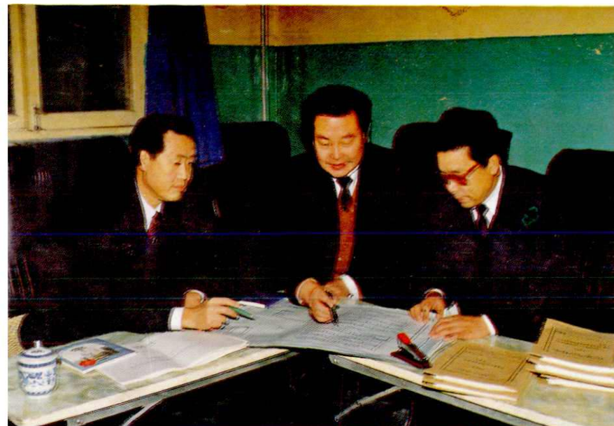
市卫生局领导班子 研究区域卫生发展规划