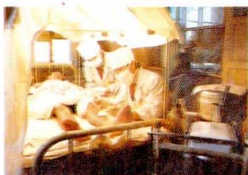
铁路医院处理烧伤病人