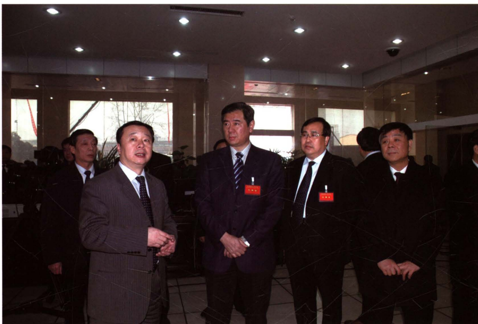
2008年1月8日，山东省常委、副省长王军民到矿观看煤矿生产安全应急事故模拟演练。