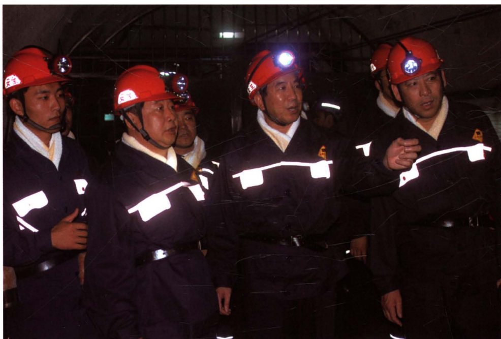
2008年9月18日，省军区司令员谭文虎（左二）来矿考察。