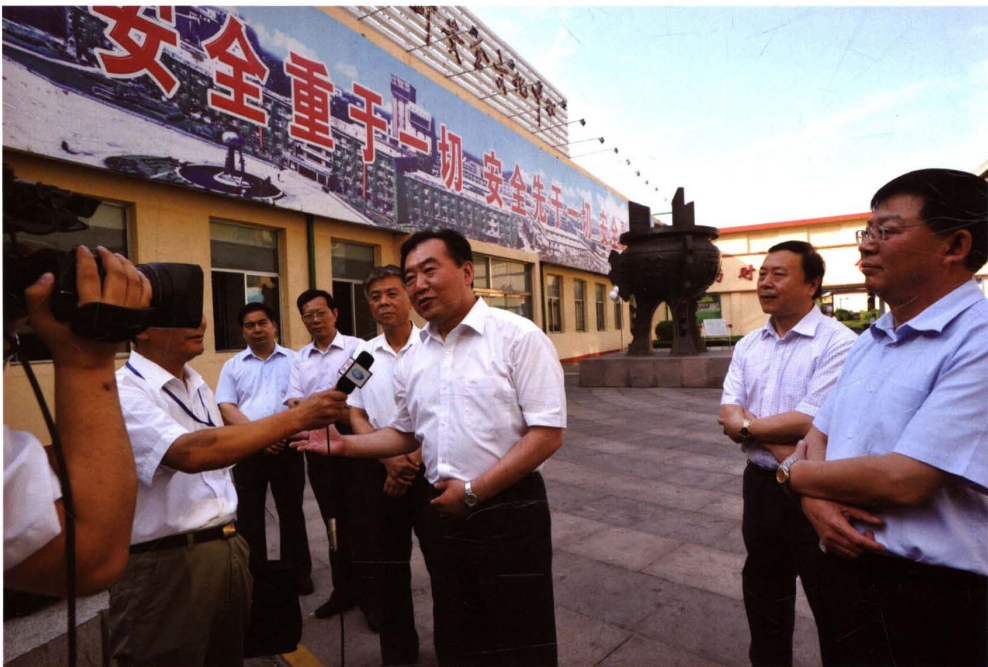
2009年6月23日，国家煤矿安全监察局副局长黄毅（中）到矿视察。