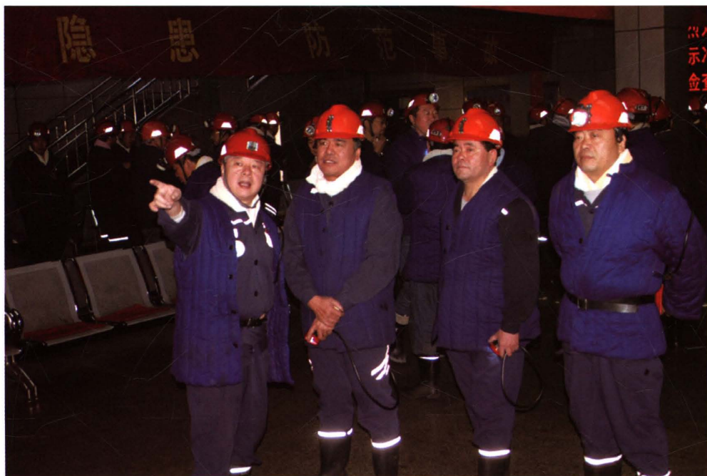
2008年12月8日，山东省煤炭工业局安全管理处领导一行，在集团公司安监局等相关部门的陪同下对矿进行质量标准和“双基”建设检查验收。