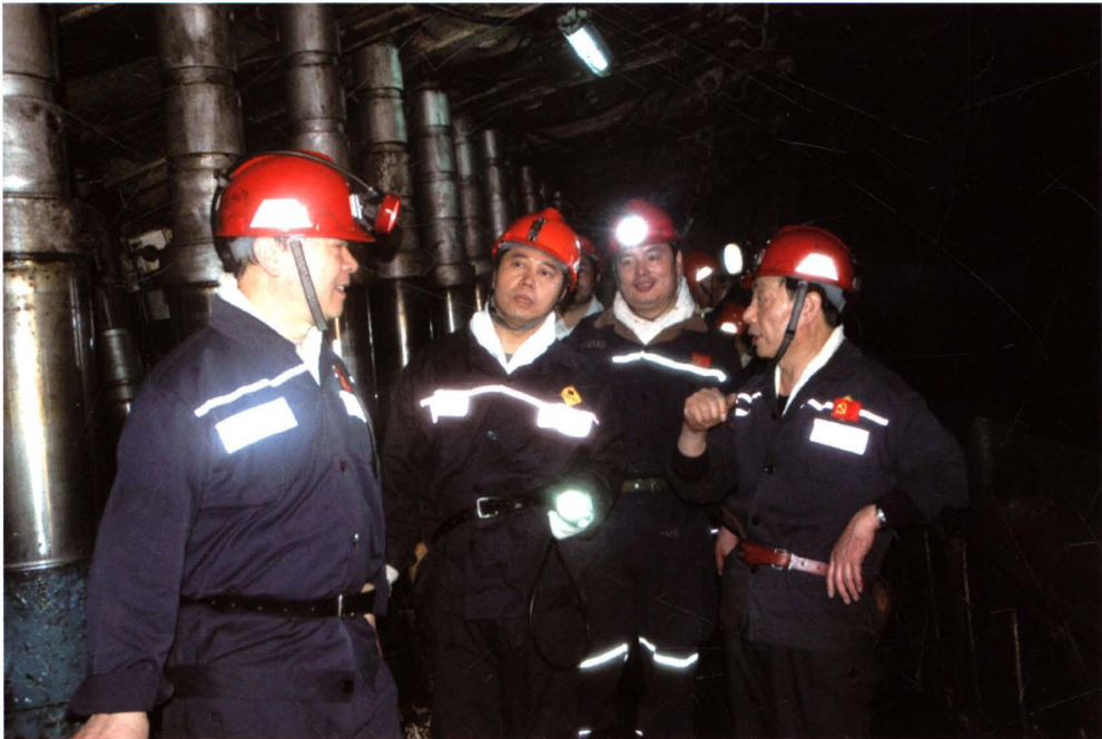
2009年3月5日，中共中央政策研究室领导到矿考察。