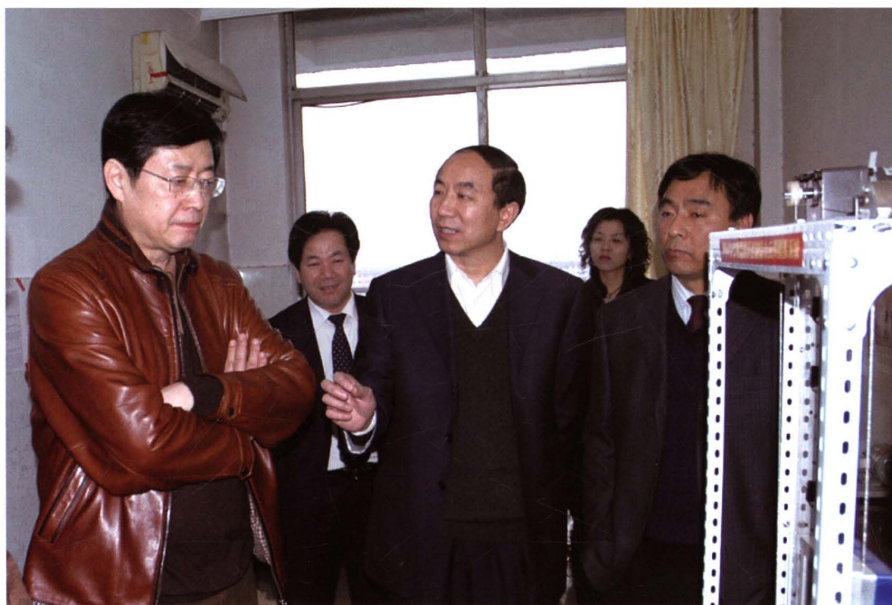
2009年3月7日，煤炭工业协会职业技能督导组到矿督导职业技能大赛。