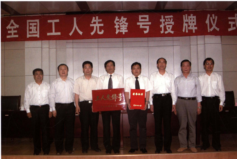
2009年5月7日，中国总工会能源化学工会领导到矿对综采二队进行工人先锋号授牌。