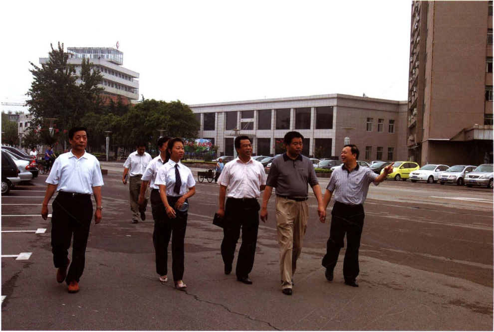
2007年8月7日,省国资委驻兖矿集团监事会常务监事等一行来矿参观考察。