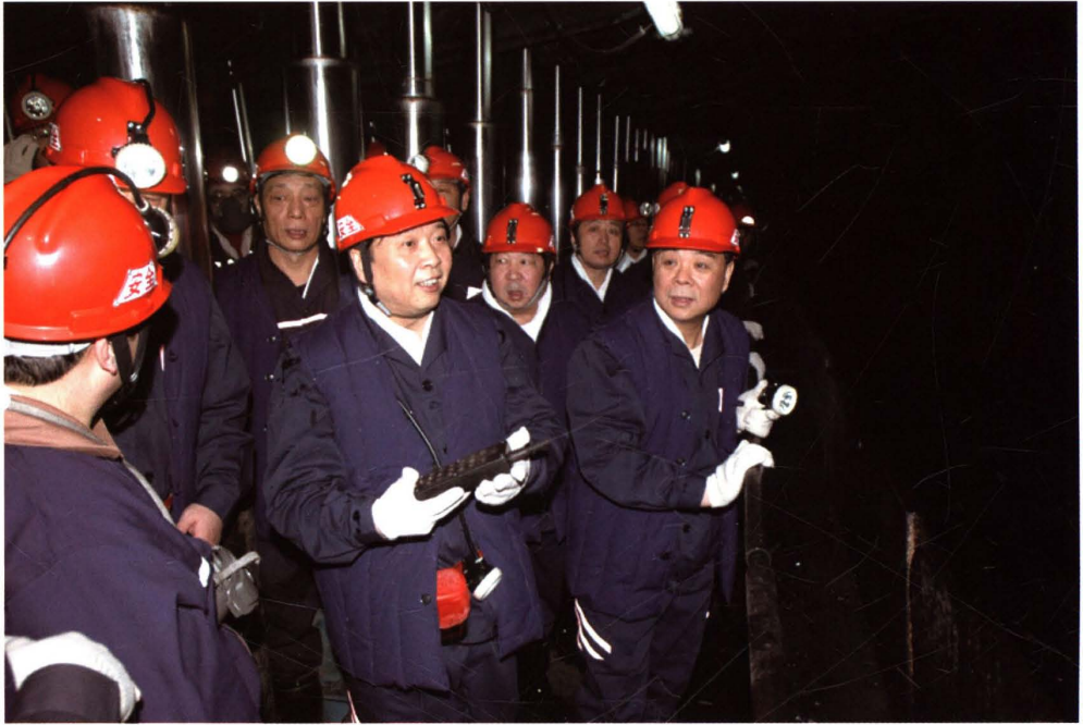
2008年2月6日，山东省省长姜大明(中)到矿井下视察工作。山东省委、济宁市委、集团公司董事局领导及矿长、党委书记陪同下井。