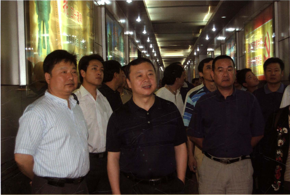
2007年6月21日，北大国学高层管理者研讨班一行40余人来矿参观考察。