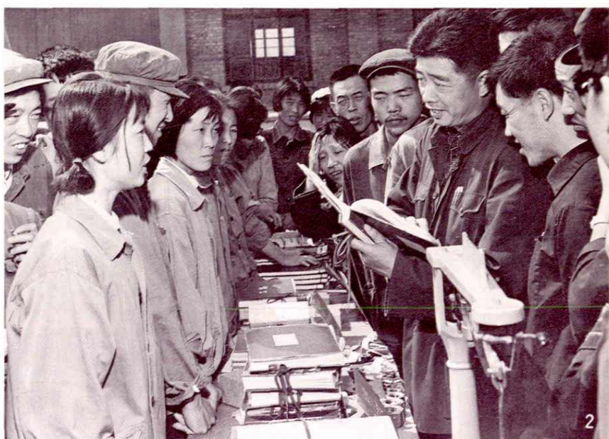
1、钳工技术表演 2、化工岗位练兵