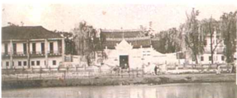
1956年，興民中學校址南院(東西樓)