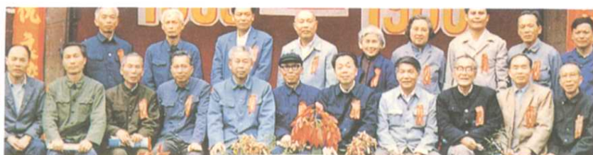
五十年代復辦後的部分教師留影