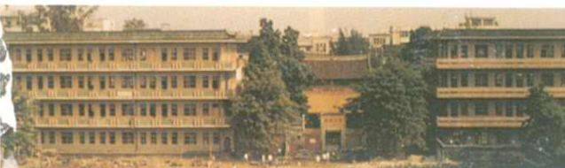
興民中學文峯書院(左)與先賢樓(右)(1988年南院)