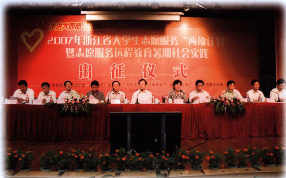
2007年7月，浙江省大学生志愿服务“两项计划”暨志愿服务远程教育暑期社会实践出征仪式在学校举行，省委副书记夏宝龙（中）出席仪式并视察学校。校党委书记姚成荣（右二）出席。