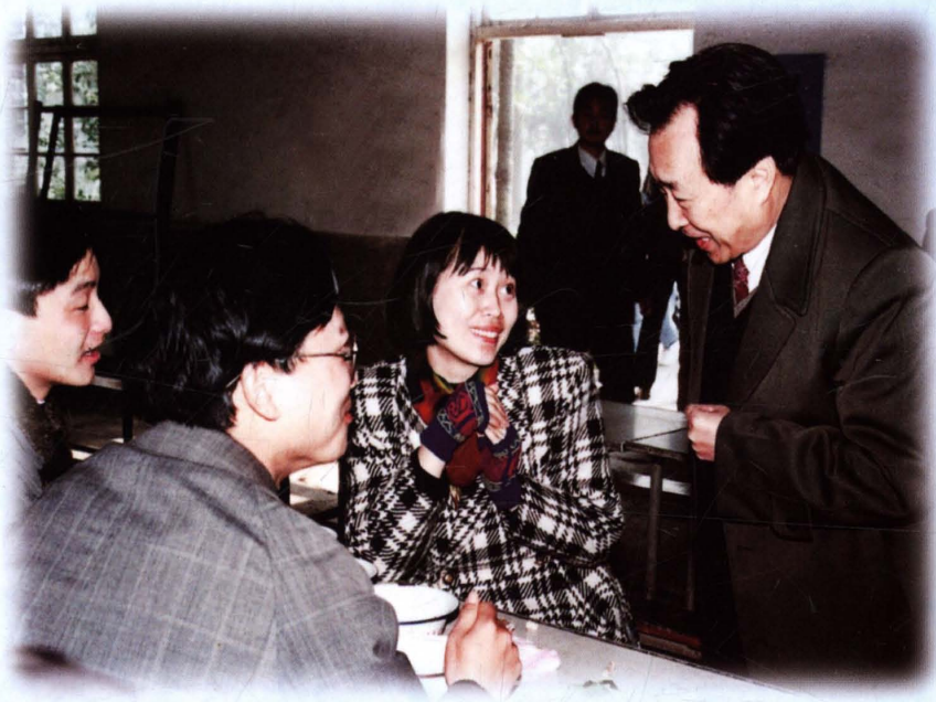
1993年12月，省委副书记、省政协主席刘枫（右一）来学校视察。