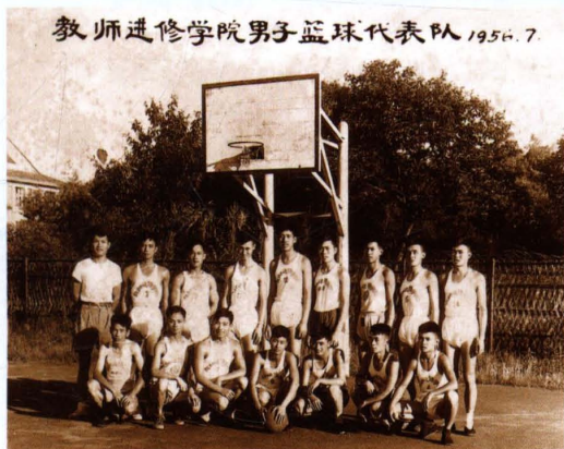
1956年7月，学校男子篮球队队员合影。