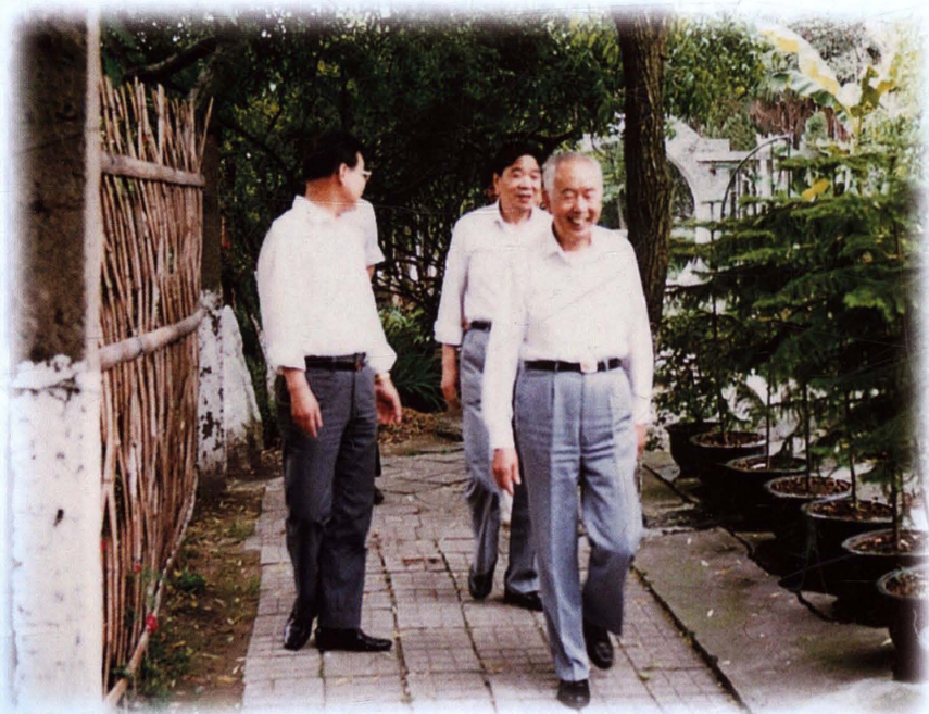
1992年5月，省政协主席王家扬（前）视察学校，校党委书记周永祥（左二）、校长叶朝阳（左一）等陪同视察。