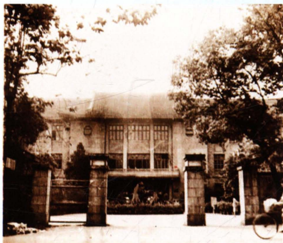
1955—1956年学校初创期间，曾借用位于杭州市文二街的杭州师范学校新建校舍，图为当时校门场景。