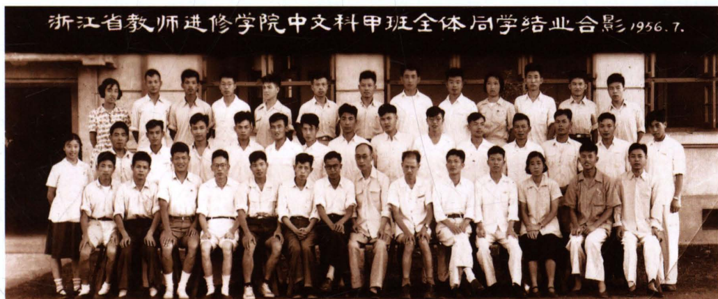
浙江省教师进修学院首届中学教师进修班中文科（1955.10—1956.07）甲班全体同学结业合影。