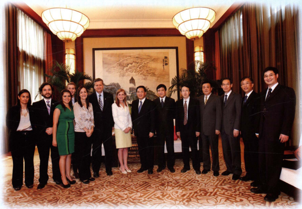
2013年9月，省长李强（前排左五）、省教育厅厅长刘希平（右五）等在杭会见前来参加学校拉美研究论坛的外宾。校长洪岗（右一）陪同会见。