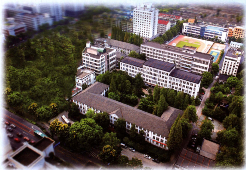
文三路校区俯瞰图