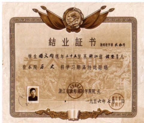
1956年7月，首届中学教师进修班学生结业证书。