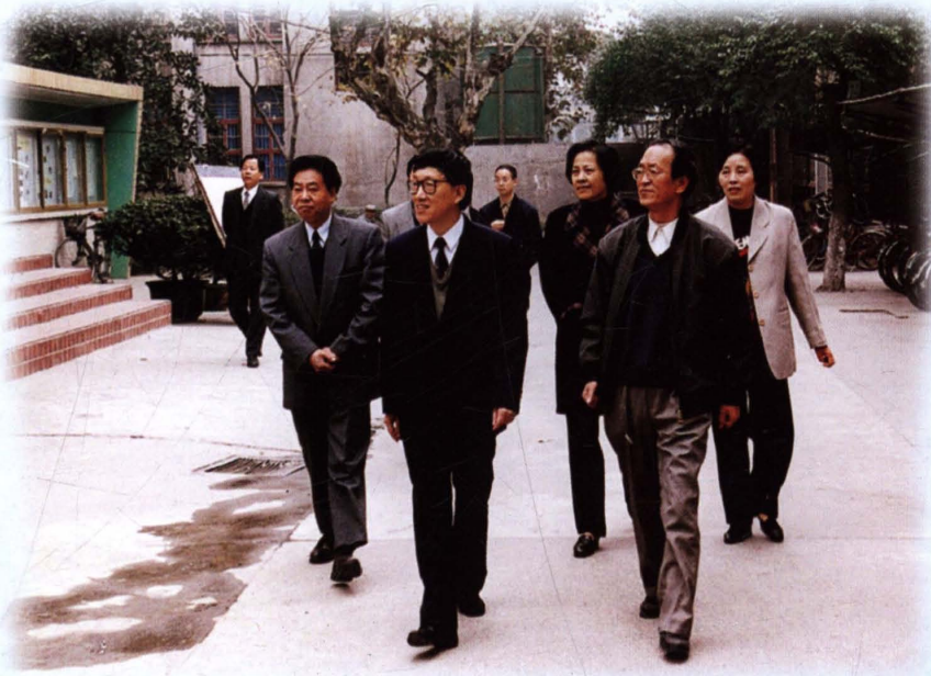
1998年，省委副书记、省纪委书记刘锡荣（前排左一）来学校视察，校党委书记吴聚芳（前排右一）等陪同视察。