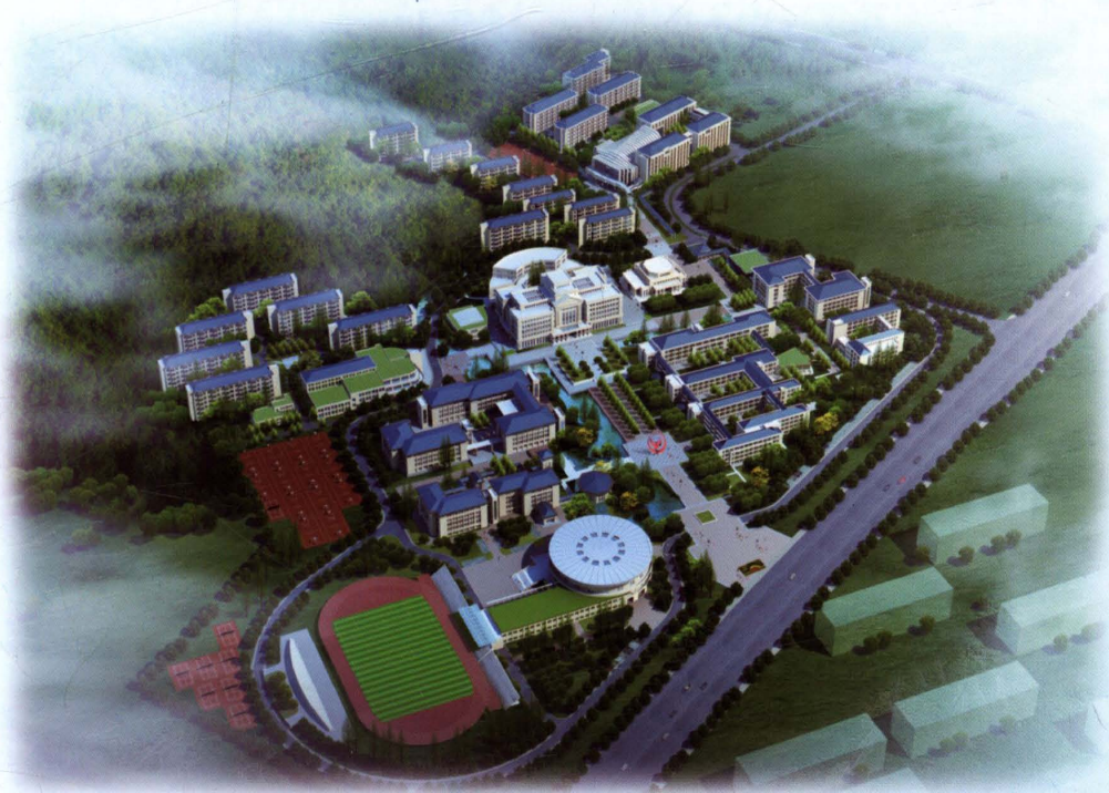
小和山校区鸟瞰图