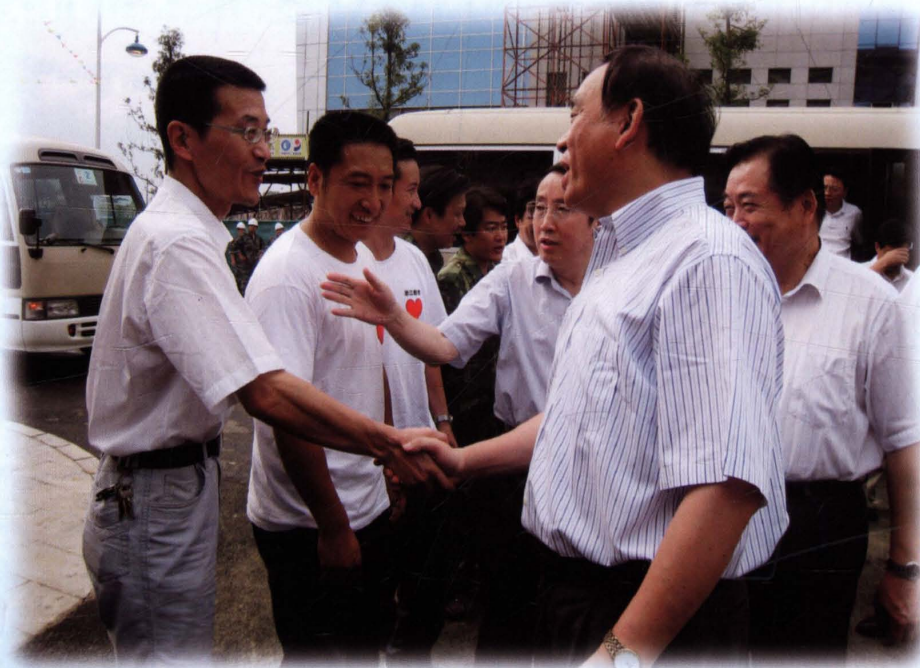
2010年9月18日，浙江省省长吕祖善（右二）、四川省省长蒋巨峰（右一）、浙江省教育厅厅长刘希平（右三）等专程来到四川省青川县教师进修学校，看望参加浙江省帮扶青川中小学教师全员培训的首期学员和培训专家。