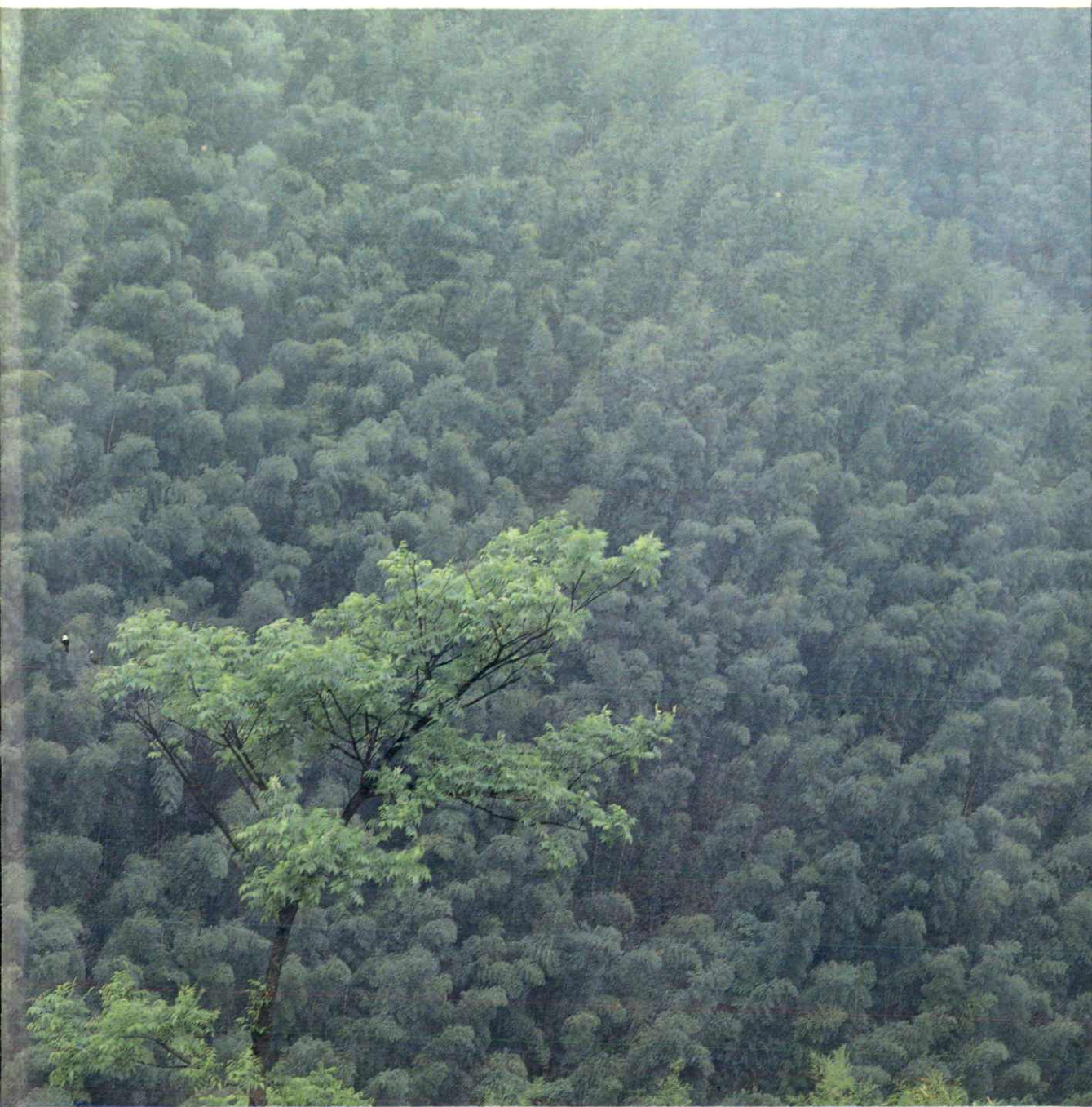
广 德 甘 溪 沟 竹 林