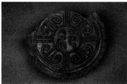
西岭遗址出土“郿”字瓦当

“郿”字从秦汉以后一直沿用到新中国成立后，1964年9月，国务院颁布《汉字简化方案》改“郿”为“眉”字使用至今。后文中，凡原“郿”字均作“眉”。