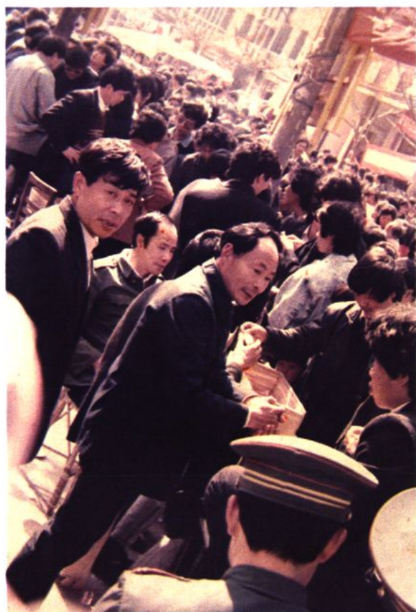
社会福利有奖募捐现场一角