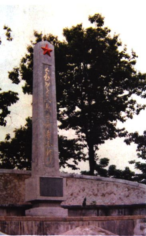
金贯真烈士纪念碑