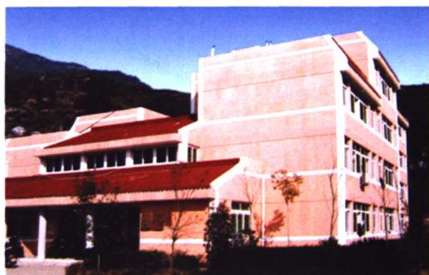
永嘉县社会福利中心一角