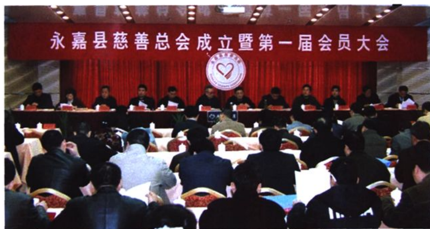
永嘉县慈善总会 成立大会