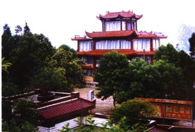
中国康乐第一村——康乐山庄一角