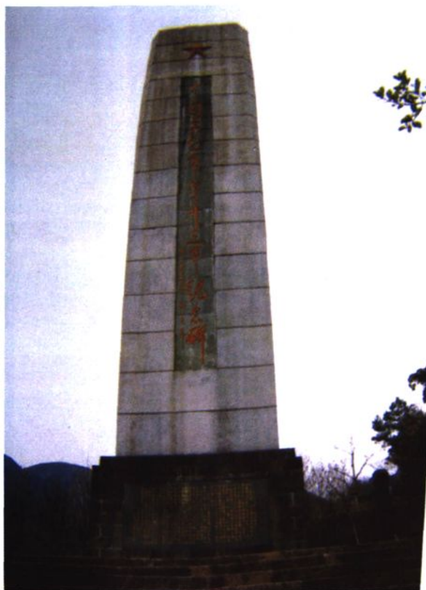
中共工农红军第十三军纪念碑