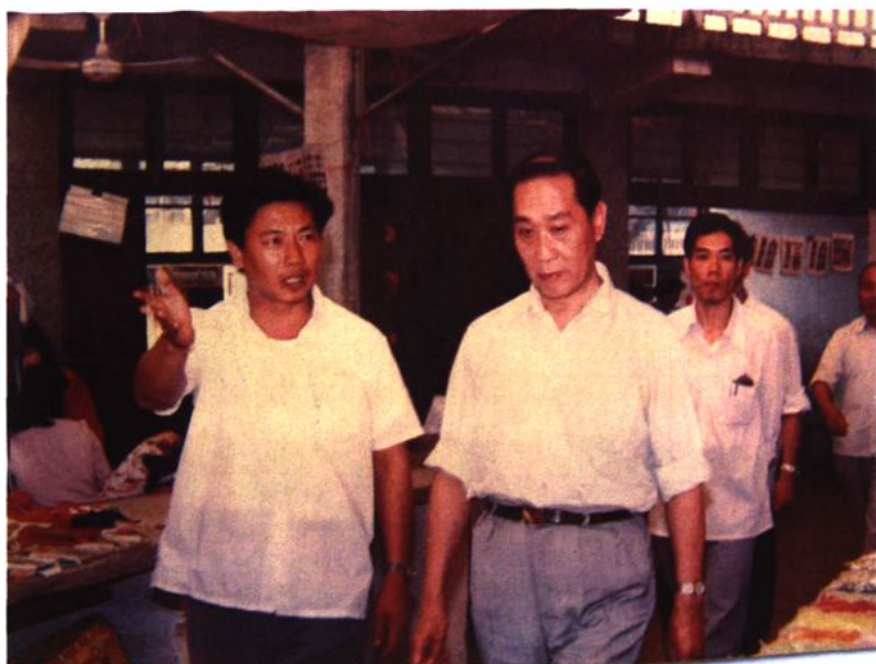
1986年5月21日， 原民政部崔乃夫部长视察 桥头纽扣市场