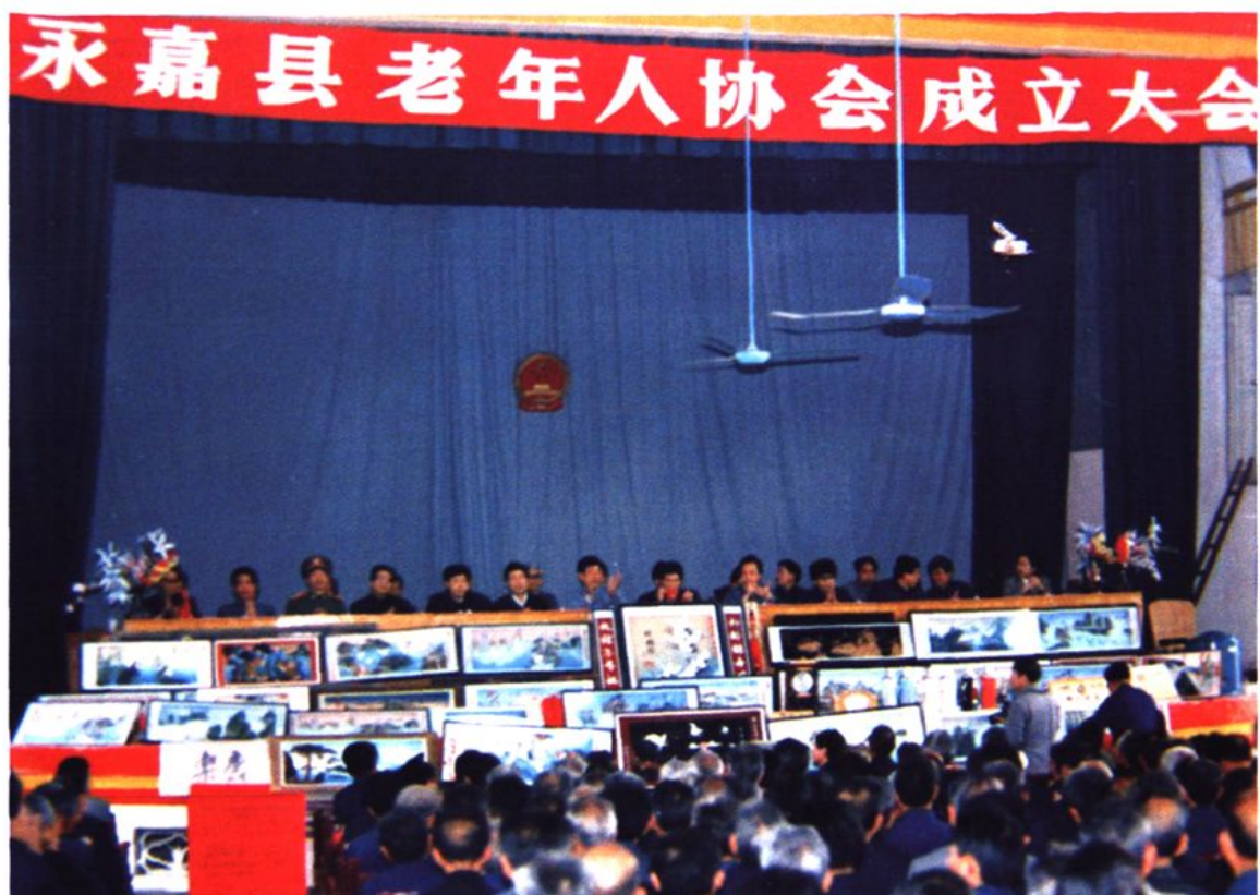
1987年8月30日，永嘉县老人协会成立