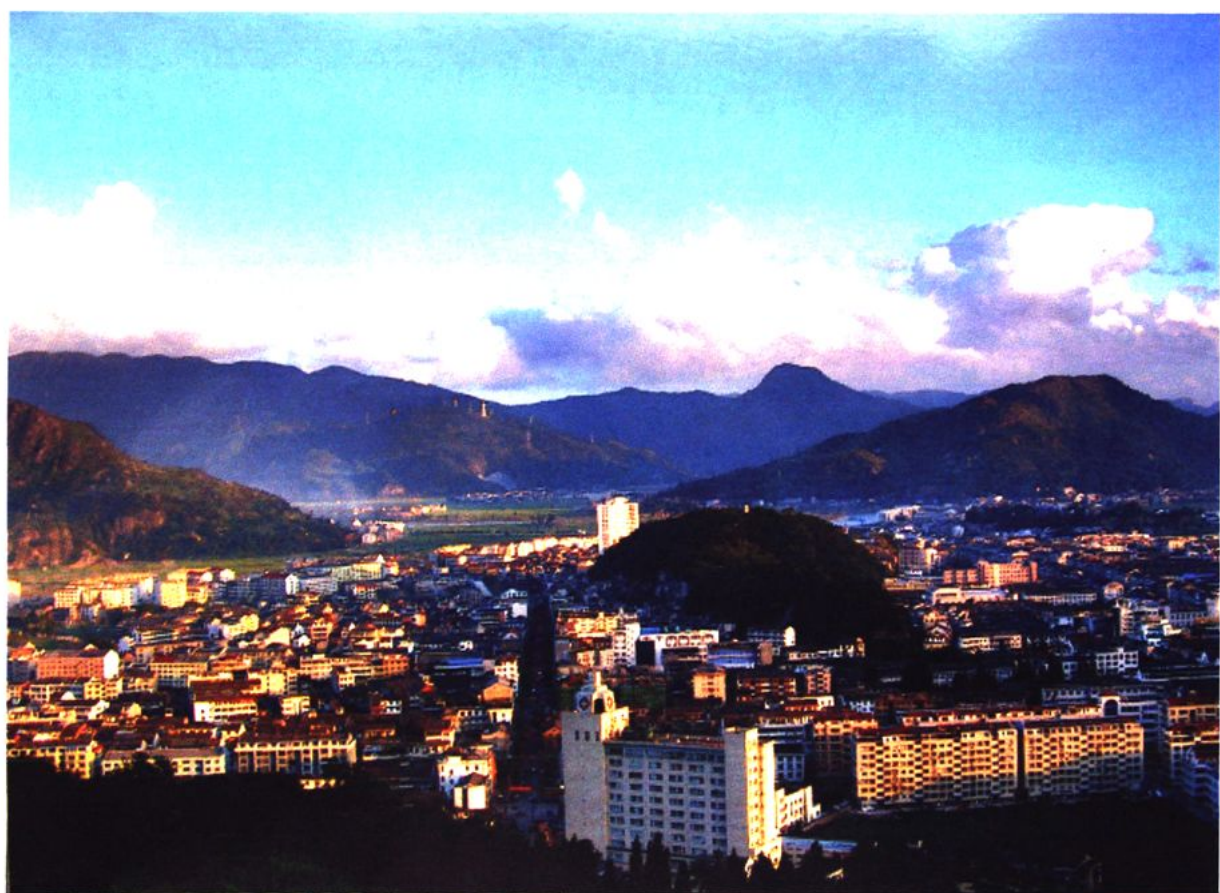
永嘉县城概貌图