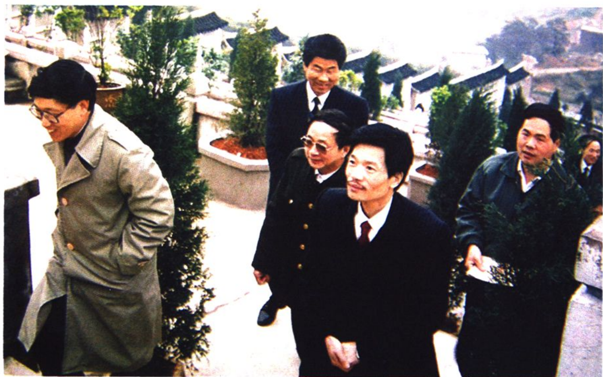
原浙江省刘锡荣副省长视察康乐山庄