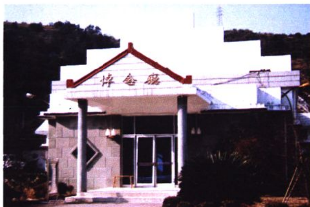
永嘉县殡仪馆一角