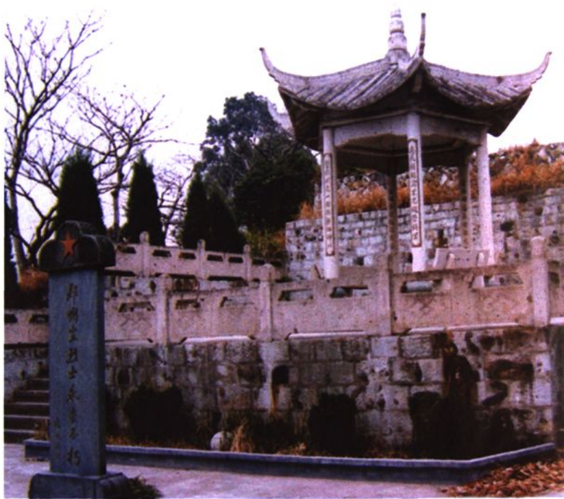
郑恻尘烈士纪念亭