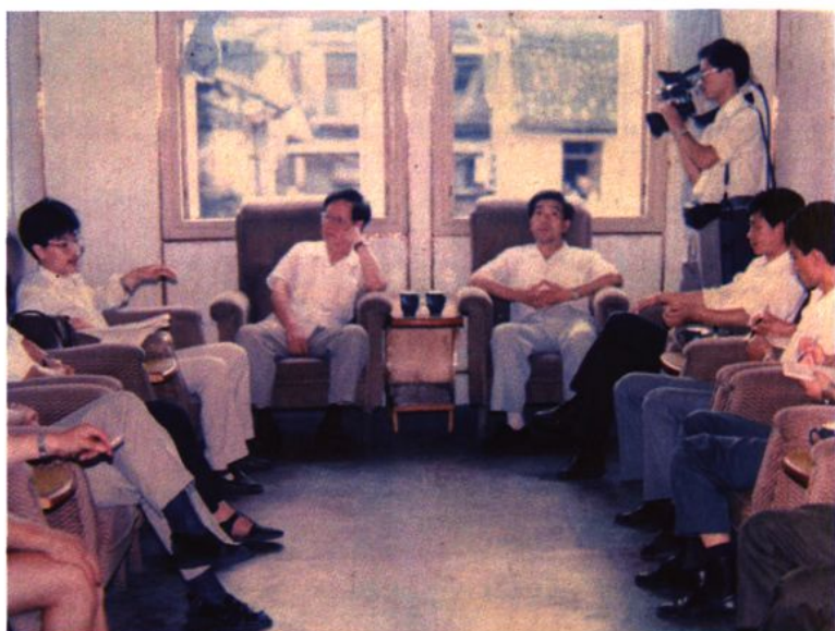
1991年9月13日， 原民政部连尹副部长视察 桥头镇基层政权建设 情况