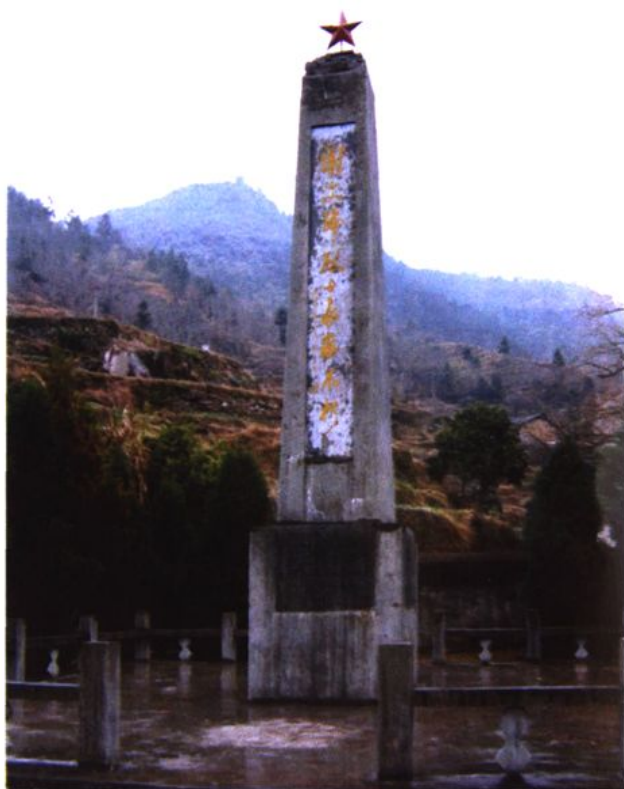
谢文锦烈士纪念碑