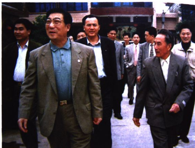
原浙江省柴松岳省长 视察康乐山庄