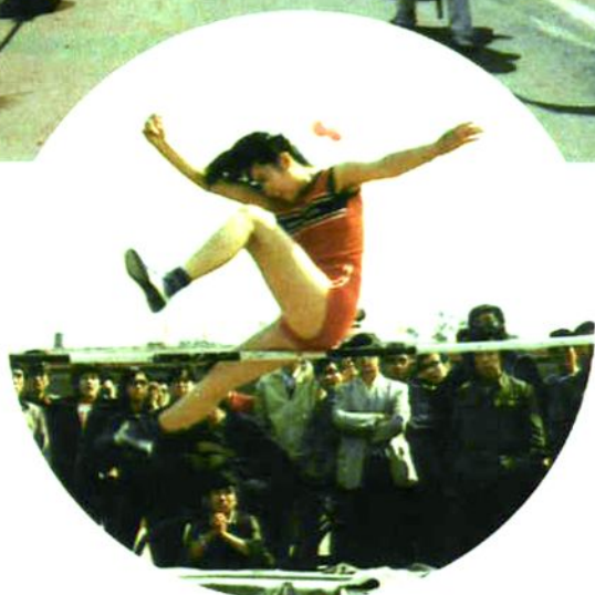
报社运动员们在市直机关运动会上参加各个项目的比赛。