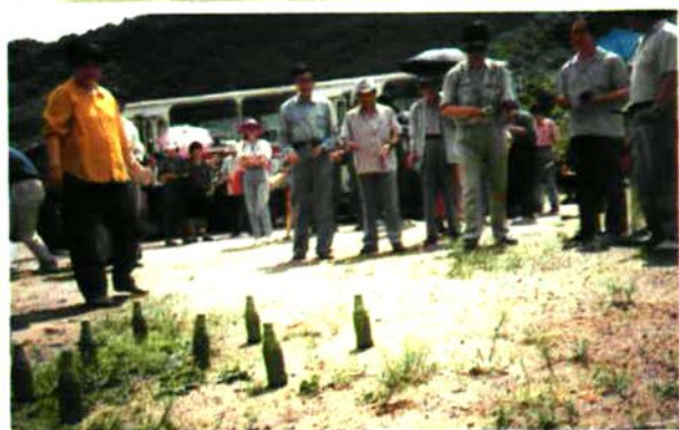
▲ 报社职工们在三道关进行文体活动。

报社领导十分重视职工的文化娱乐活动,除了扩建体育场、装修俱乐部、设置健身房外,并在每年的旅游旺季组织职工到镜泊湖、三道关、绥芬河等旅游胜地开展活动,丰富职工文化生活。