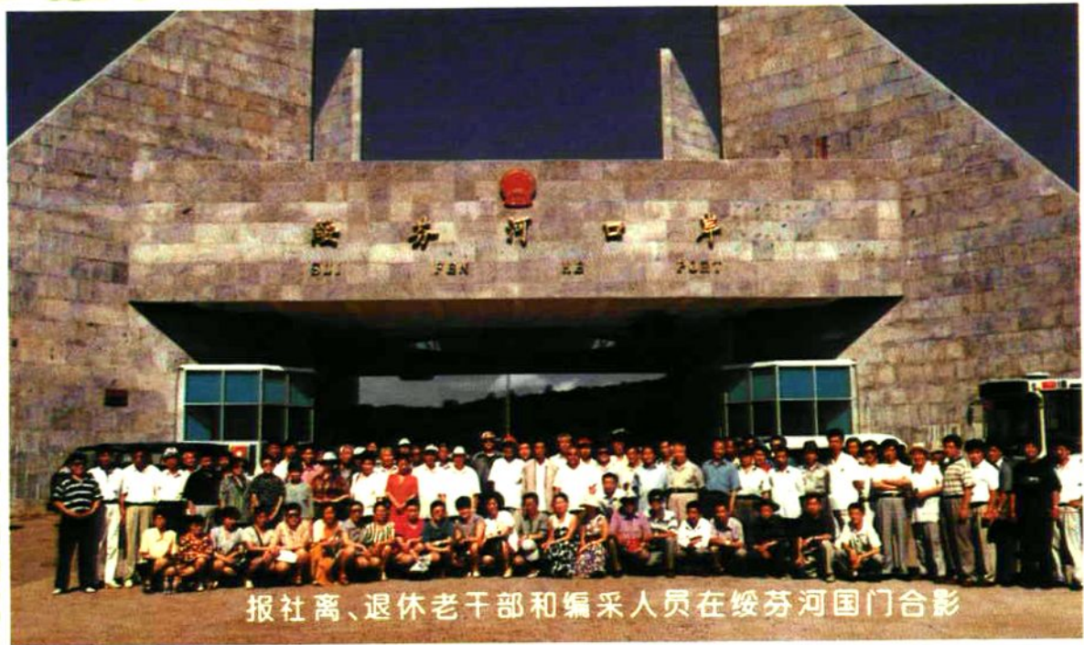
报社离、退休老干部和编采人员在绥芬河国门合影

报社领导十分重视职工的文化娱乐活动,除了扩建体育场、装修俱乐部、设置健身房外,并在每年的旅游旺季组织职工到镜泊湖、三道关、绥芬河等旅游胜地开展活动,丰富职工文化生活。