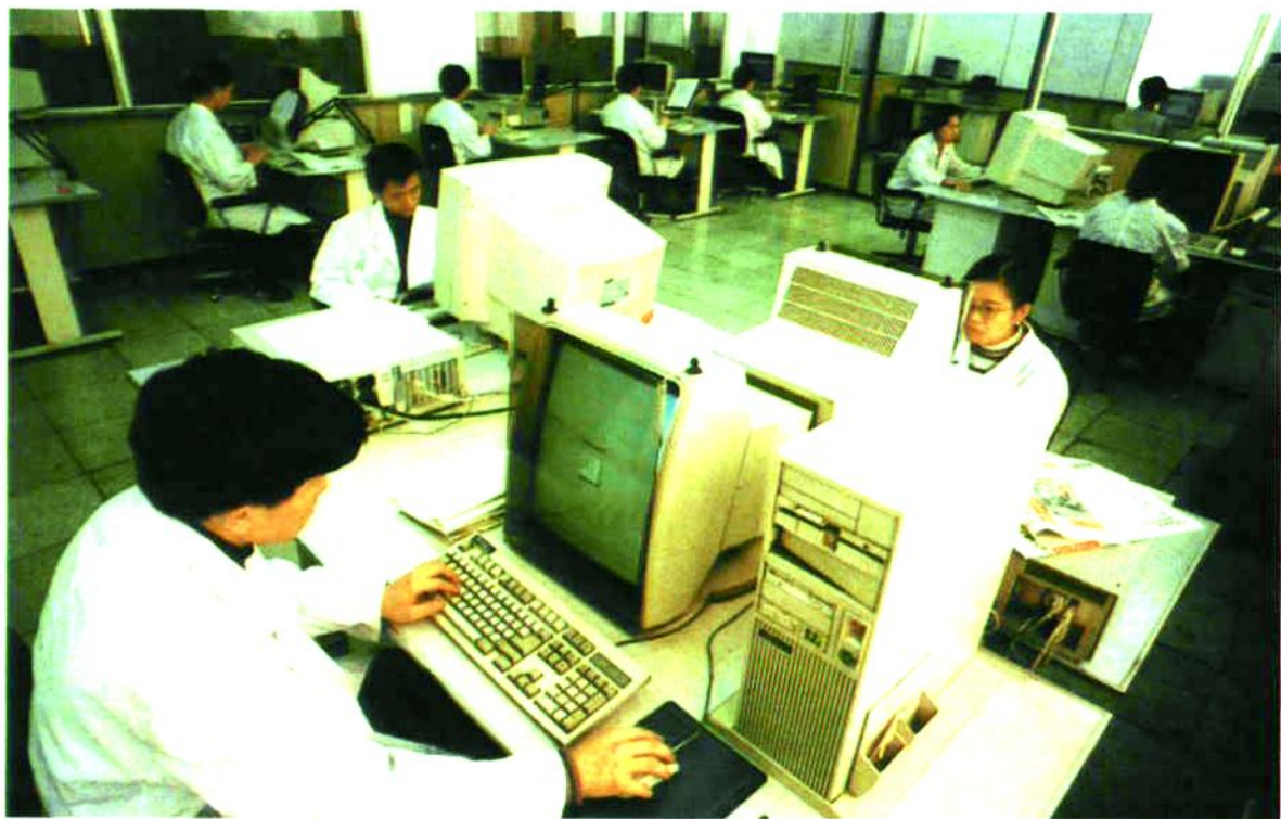
图为激光照排车间工人在用微机排版。

1990年5月1日，报社在北大方正集团公司协助下，在全省率先采用了“激光照排”先进技术，在报纸成版、印刷技术上，彻底告别了“铅与火”。