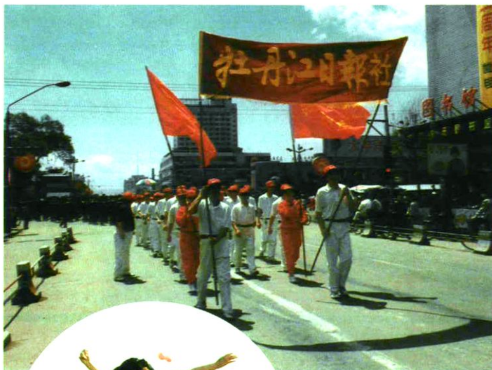
图为报社代表队高举横幅进入运动会会场。

牡丹江日报社职工文体活动非常活跃，报社有篮球场、健身房等体育设施。每年在市直机关职工运动会上都能夺得好成绩。