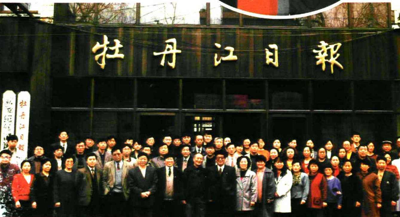
报社领导同志和出席第四届工会会员代表大会的代表合影。