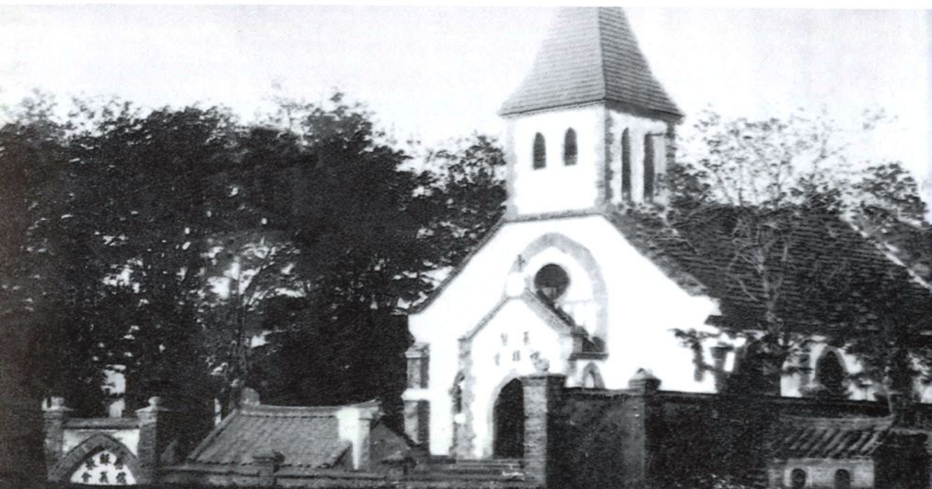
德国教会在即墨花园村建的基督教礼拜堂，萃英书院旧址