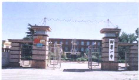
20世纪90年代学校大门