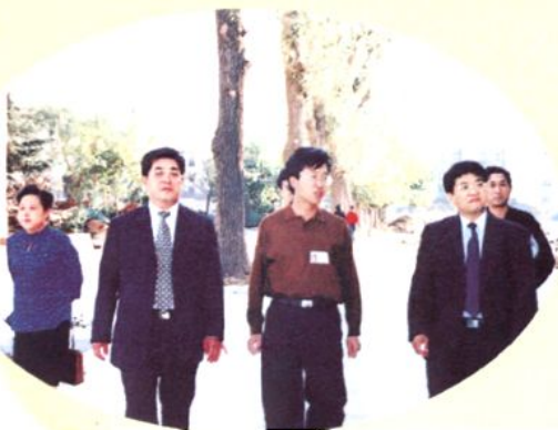
2002年，青岛市副市长马论业（左二）到学校视察工作