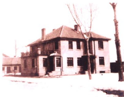
信义中学时期牧师住宅楼