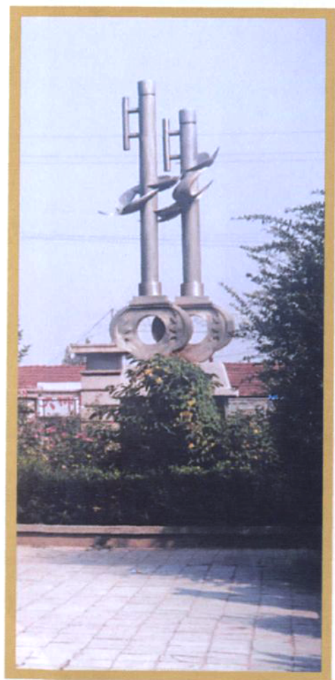
建校90周年校庆时所建雕塑