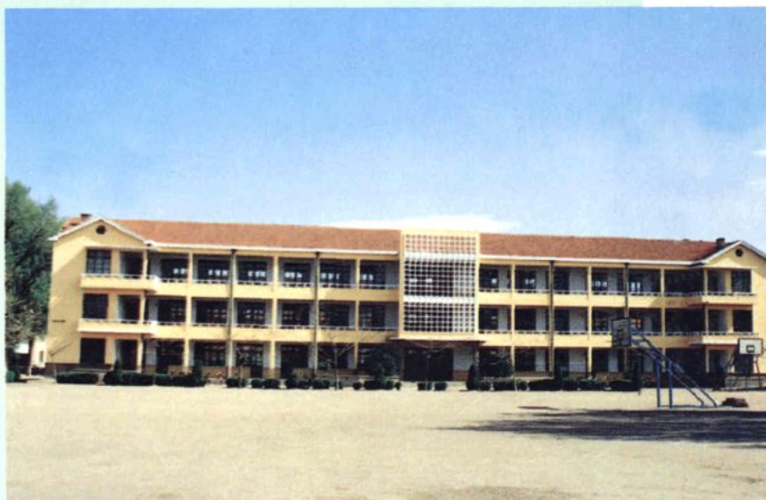
一九八四年建教学楼（二〇〇三年拆除）