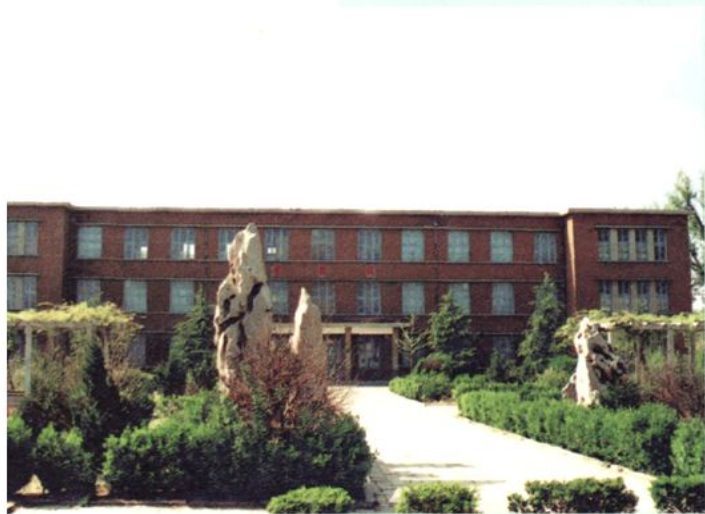
1981年建实验楼（2002年拆除）