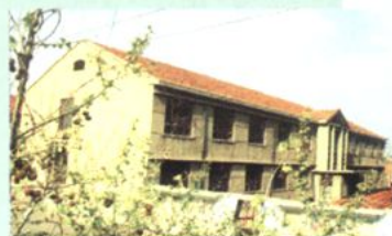
20世纪80至90年代学生宿舍楼