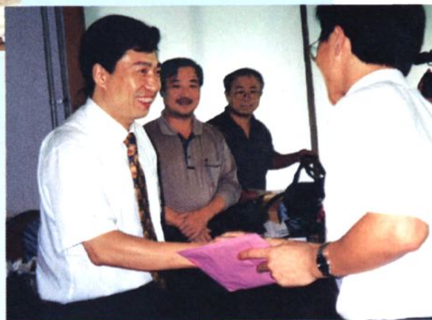
2003年教师节，即墨市市长李宽端到学校看望慰问教师