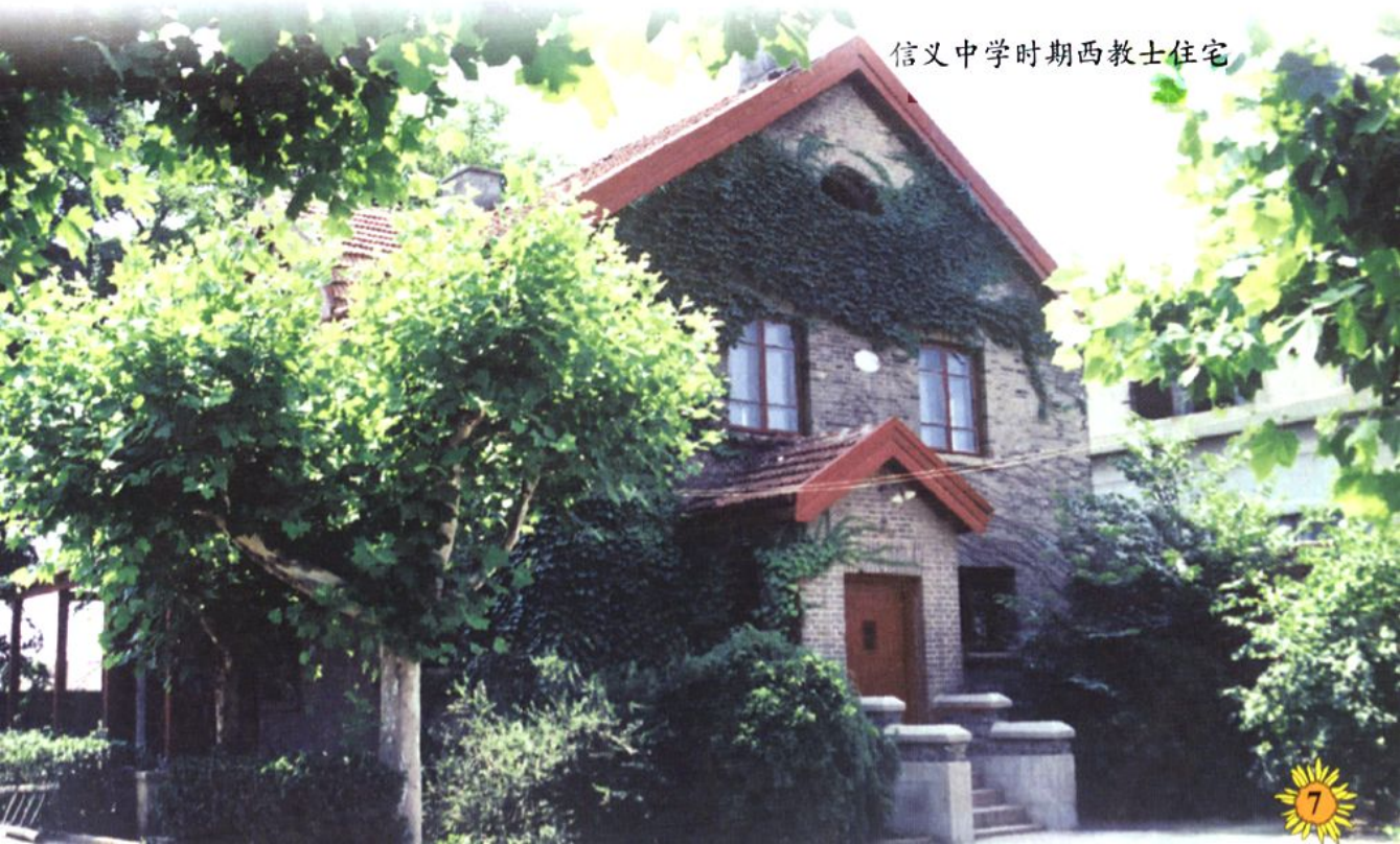
信义中学时期西教士住宅