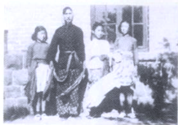
20世纪50年代学校秧歌队