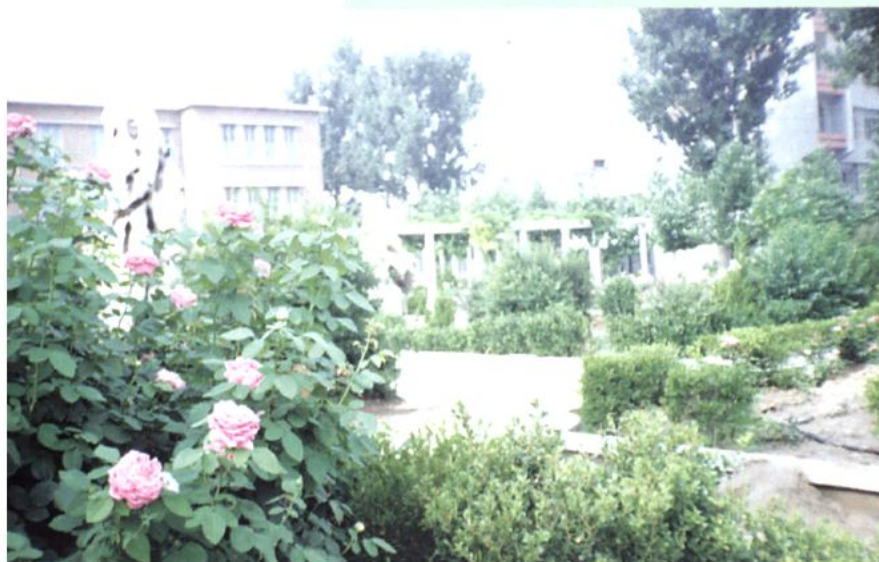
二十世纪八十至九十年代校园一角