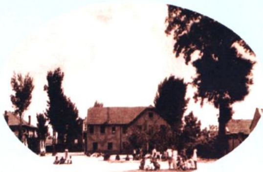
信义中学时期校园一角