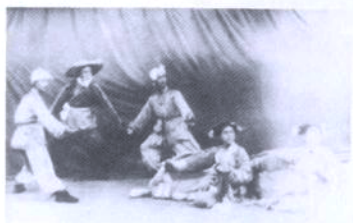
20世纪50年代学校排演的剧目《送公粮》剧照