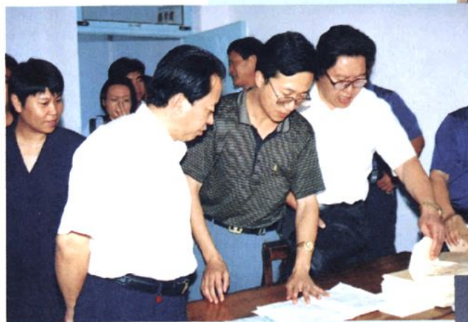
2000年教师节，中共即墨市委书记张洪训到学校看望教师