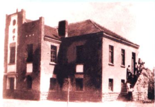
信义中学时期礼堂