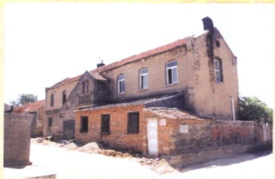
私立萃英初级中学旧址（现磨市街24号）