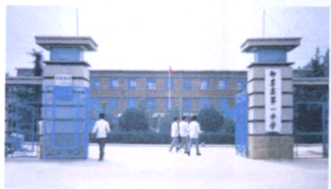
20世纪80年代学校大门