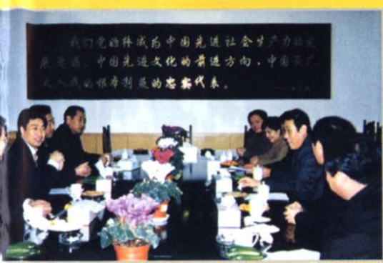
市领导慰问财政干部职工，对财政工作提出重要要求。