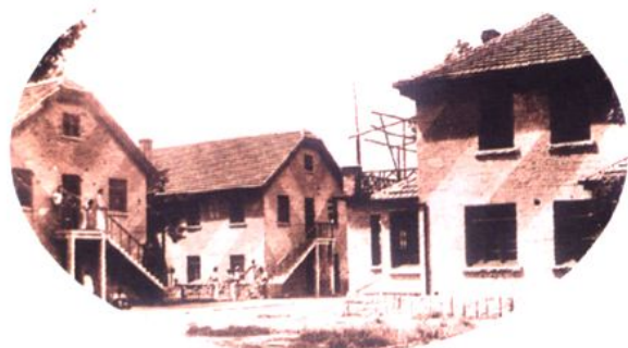
信义中学时期学生宿舍楼