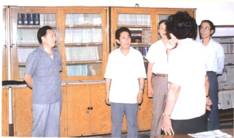
1991年，国家教委副主任柳斌（左一）到学校视察工作