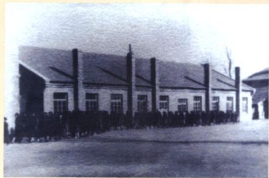
日军侵华期间，在校园建的马棚，后改为信义中学教室、宿舍。