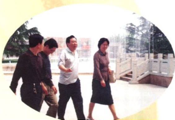
2004年，青岛市副市长王修林（右二）到学校视察工作