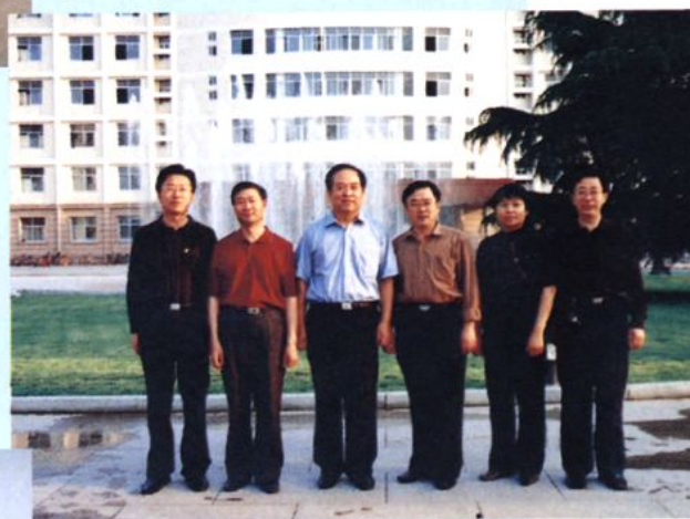
2004年，山东省委高校工委副书记田建国（左三）到学校调研