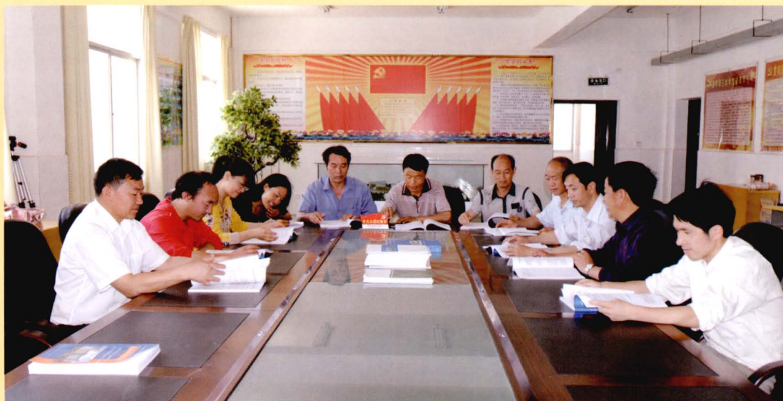
2009年3月《罗平三中校志》编纂工作会