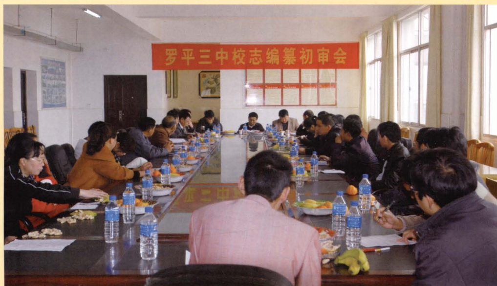
2012年2月《罗平三中校志》审稿会