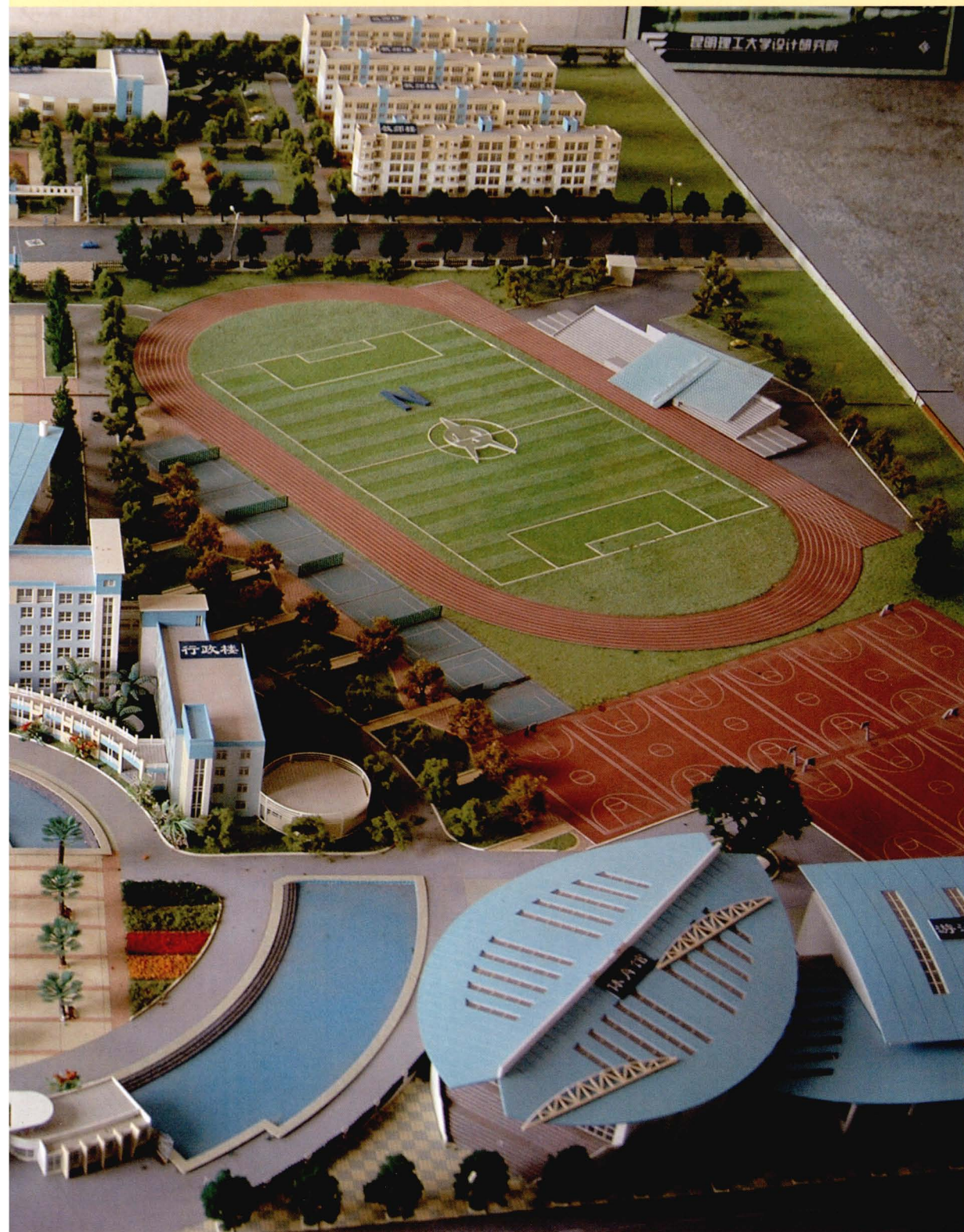
2003年规划设计校舍平面图