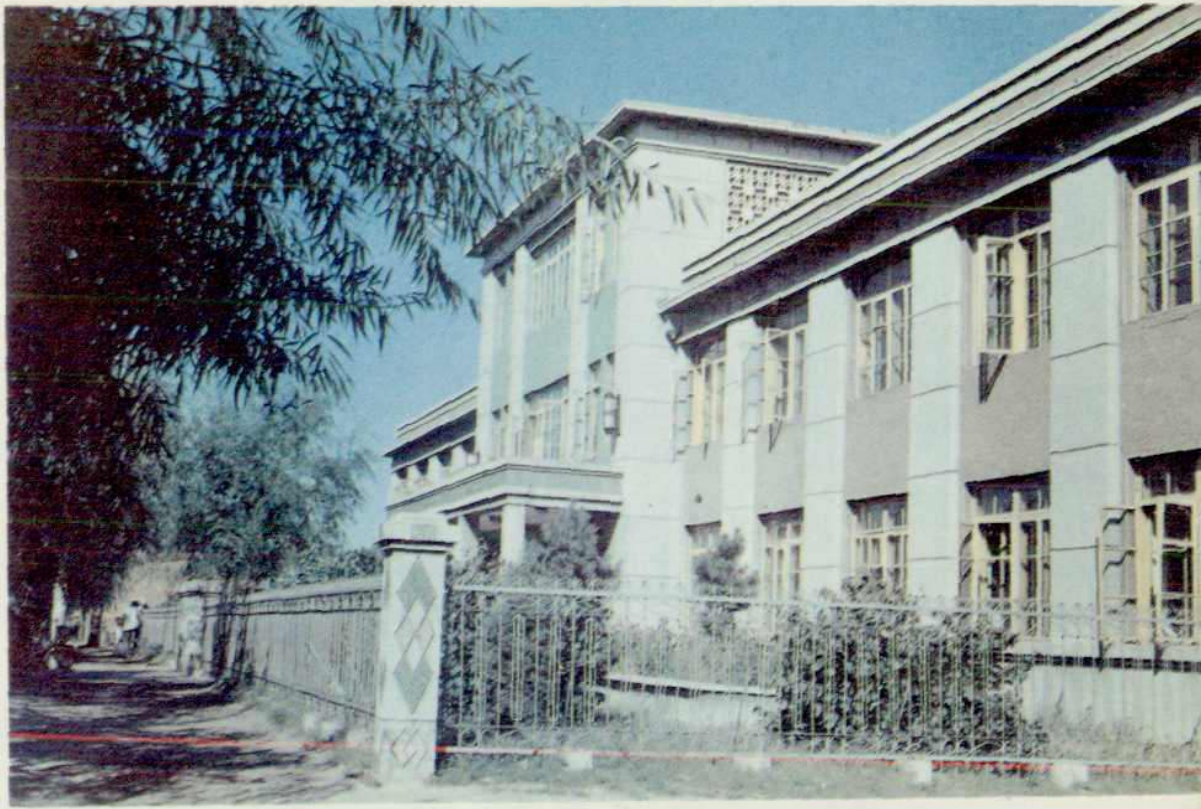
通榆县粮食局办公楼