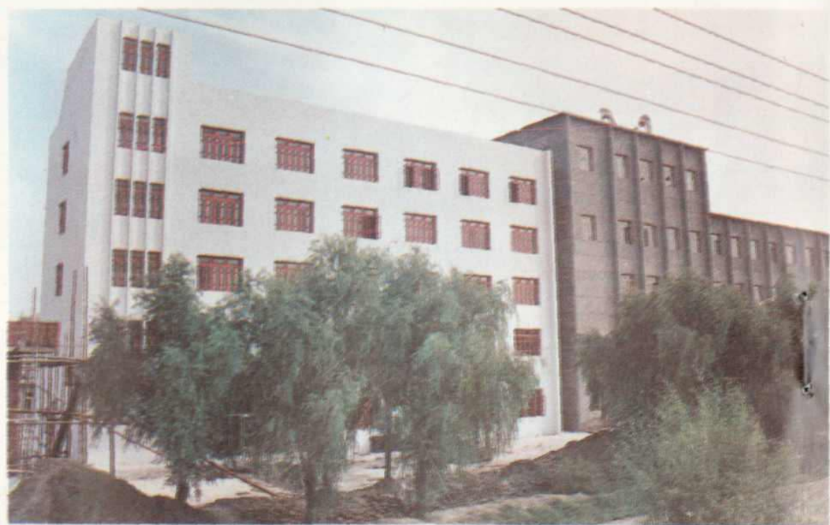
粮油工业厂房与车间