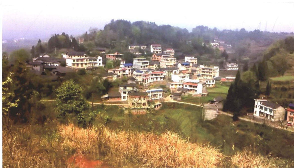
刘家岭、草寨、挖断岗组