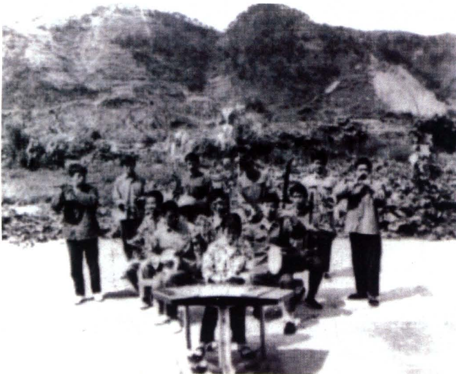
钟灵水库工地宣传队