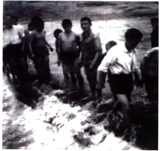
县委书记冉海光（右二） 在抗洪抢险第一线