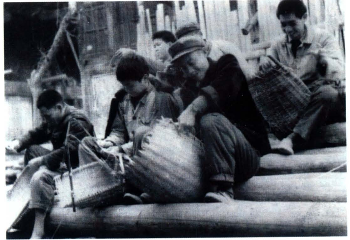
自力更生修钟灵水库