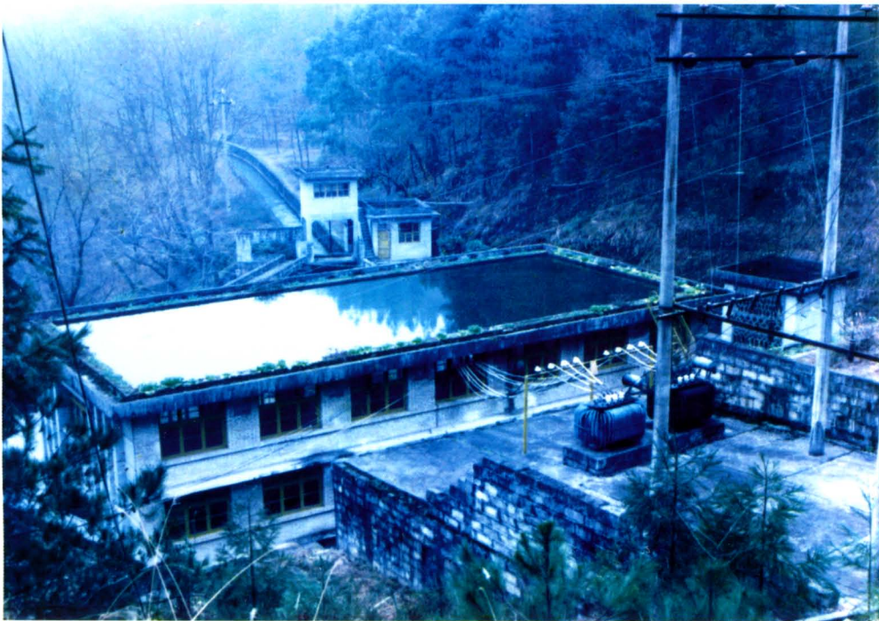
钟灵水库坝后电站