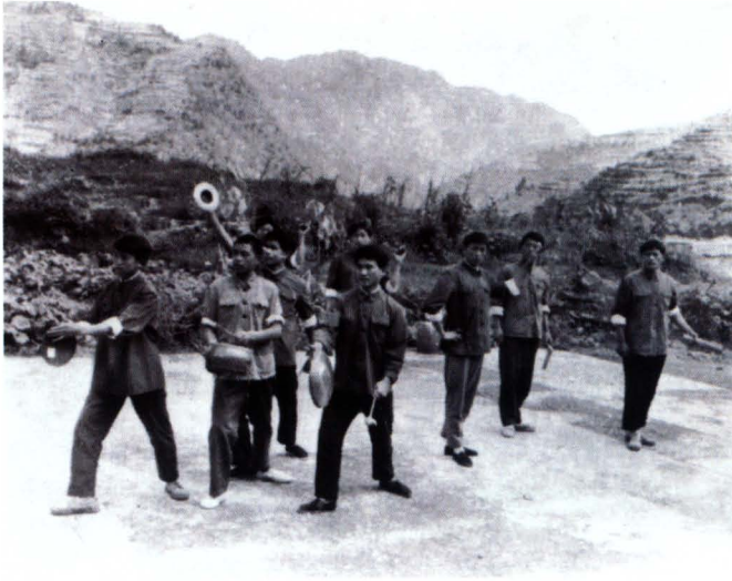
钟灵水库战地宣传队