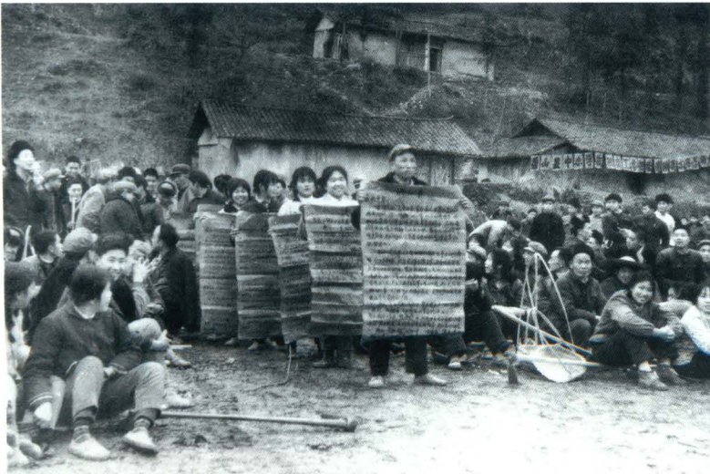
民工为修好钟灵水库表决心