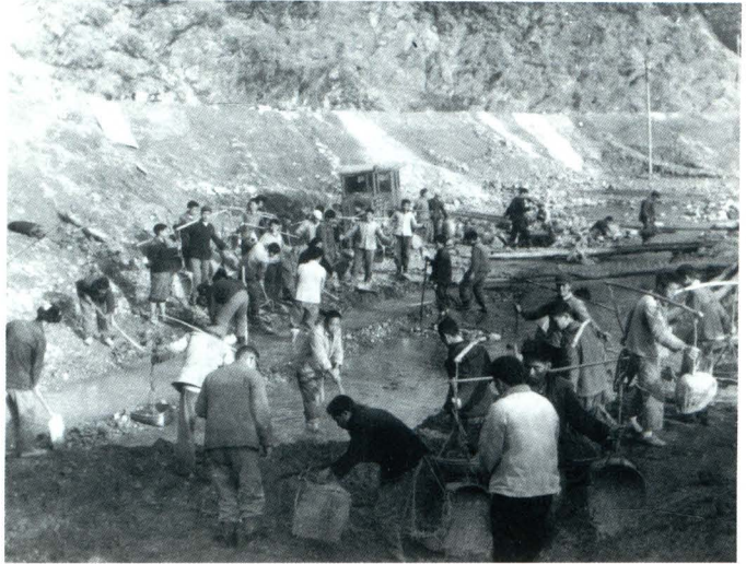
钟灵水库大坝清基现场