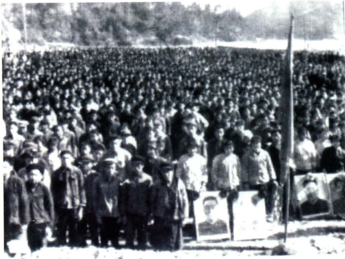
修建钟灵水库的民工 在工地上庆祝粉碎「四人帮」