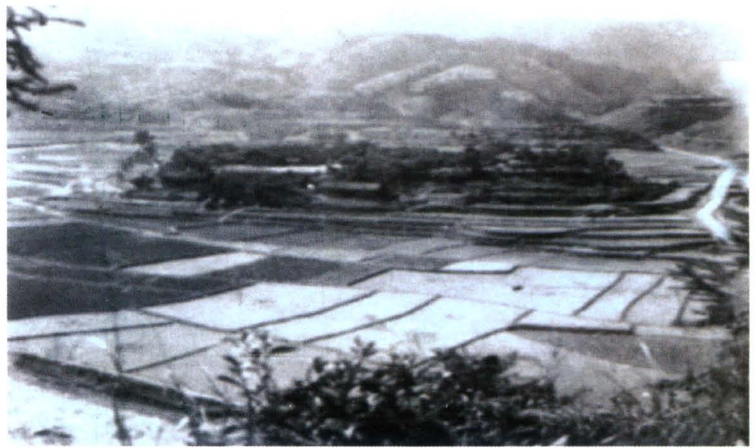
村落与良田 被钟灵水库淹没的