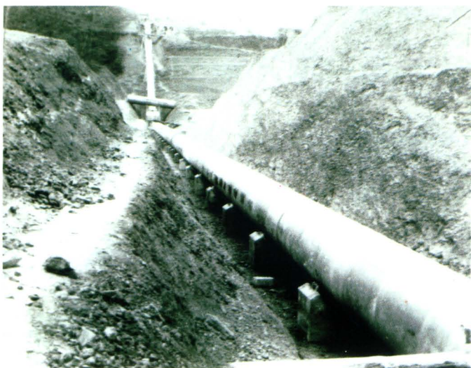
钟灵水库红星倒虹管