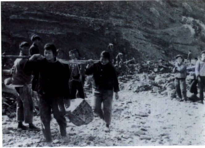
修建钟灵水库时的铁姑娘