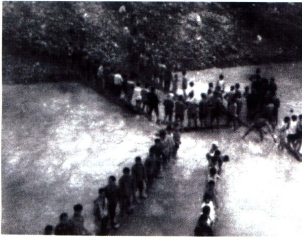
抢险现场 钟灵水库修建时抗洪