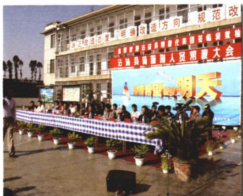
○沾益法院到曲靖监狱开展帮教活动