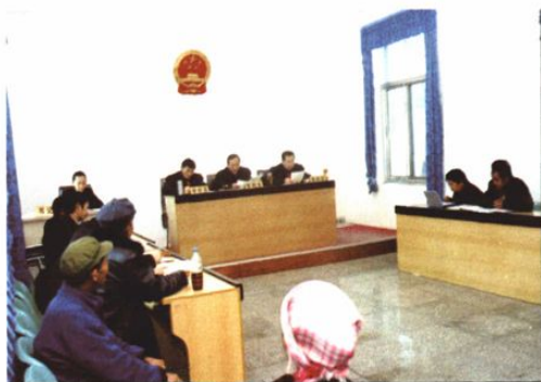
○中级法院审判监督庭开庭审理再审案件