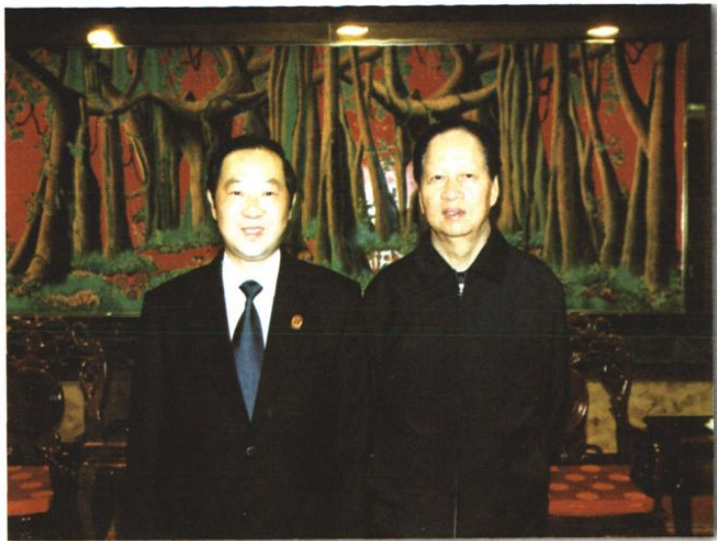
○ 2002年5月,最高法院院长肖扬到云南考察时接见曲靖中级法院院长杨照民