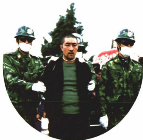
2003年，“亚洲第一毒品案”案犯王兴昌被押赴刑场，执行枪决