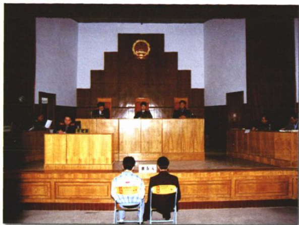
少年刑事案件审判