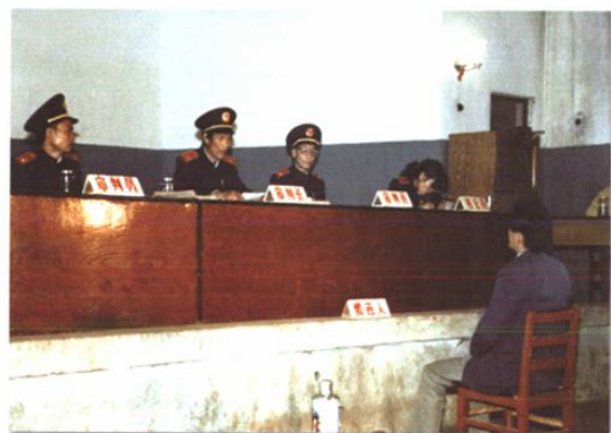
○ 20世纪90年代法官审理刑事案件