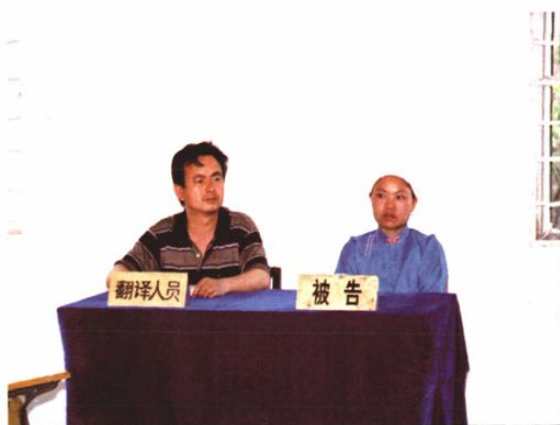
○为少数民族指定翻译人员进行诉讼