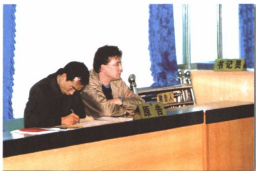
○ 审理首例外国人离婚案