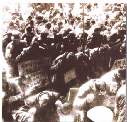
○ 1969年1月31日,“文化大革命”期间法制被践踏,广大干群被批斗