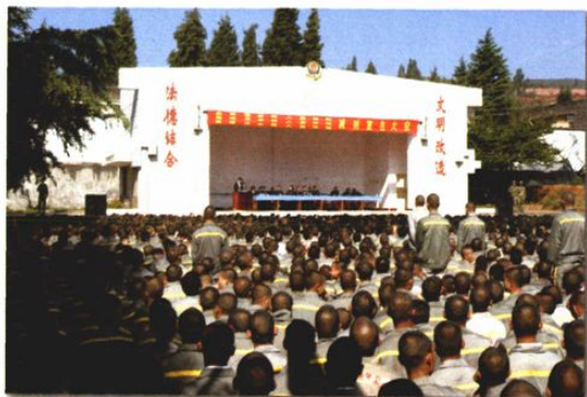
省高院、昆明中院、曲靖中院在少管所对未成年犯减刑