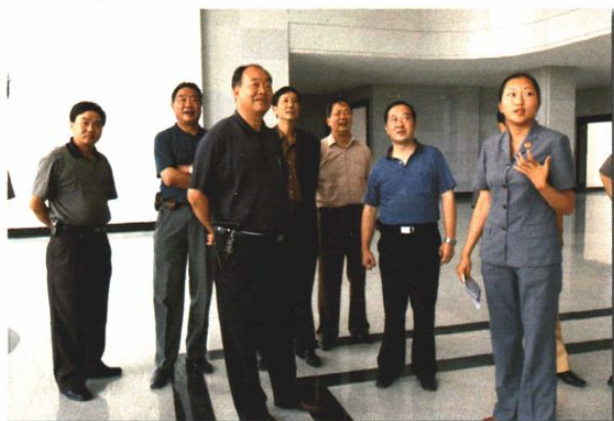
○2004年6月,曲靖市人大主任黄有能等领导到曲靖中院检查指导工作