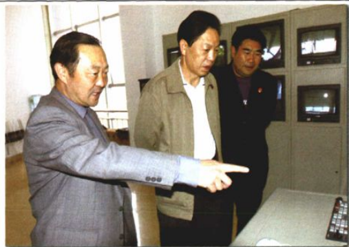
○2004年5月,市委副书记陈世贵到中院调研