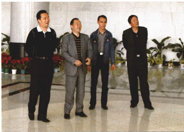
○2005年4月初,省法院王君正副院长视察曲靖中院