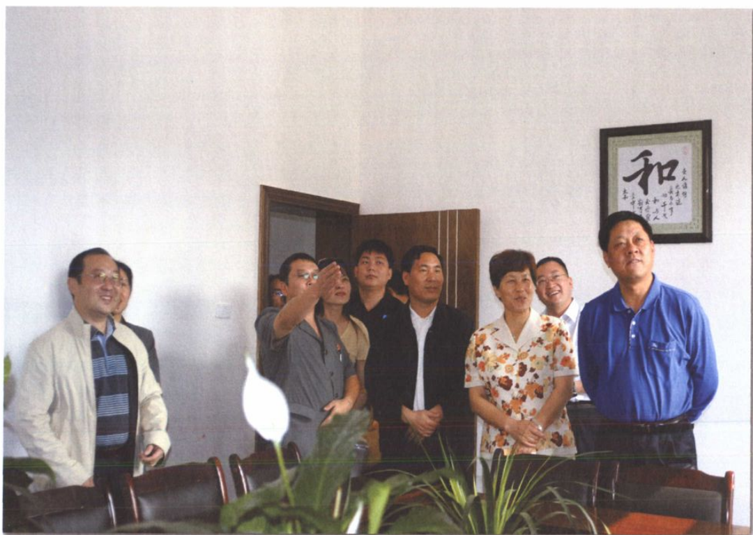
○2008年7月10日,省高级人民法院院长许前飞到沾益法院花山中心法庭调研指导工作