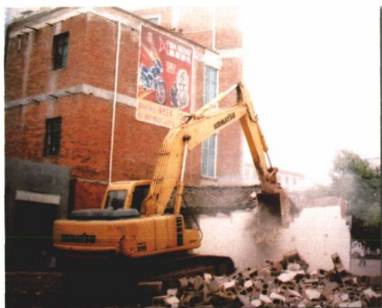
○师宗法院对违法违规建筑强制拆除