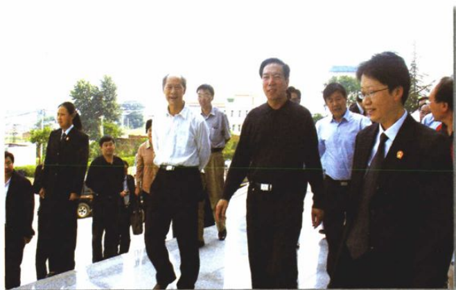
○2006年9月，省人大副主任江巴吉才视察沾益法院少年审判工作