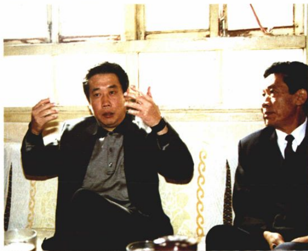
○1998年11月，省高院院长孙小虹视察宣威法院