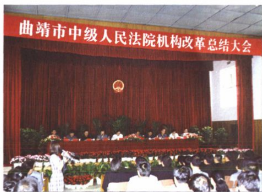
○2002年7月,中院举行机构改革总结大会