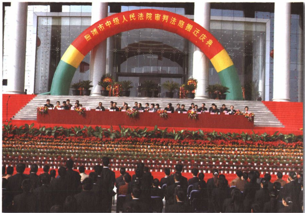
○2004年11月,曲靖中院举行搬迁庆典