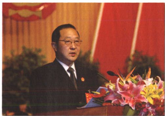
○2003年3月,杨照民院长在市二届 人大一次会议上作法院工作报告