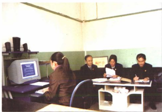
○ 合议庭认真评议案件