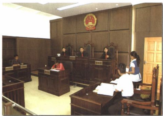
○ 当事人在民事诉讼活动中举证