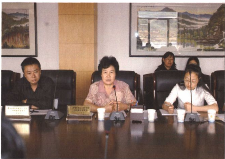
○2005年7月,省法院副院长赵佩丽到曲靖中院检查指导工作