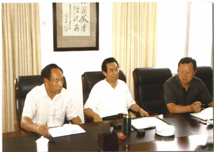
○ 2005年8月,最高法院党组副书记、副院长姜兴长与曲靖市委书记米东生,市长李培到中院检查指导工作