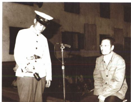
○ 20世纪80年代庭审中,法警向被告出示证据