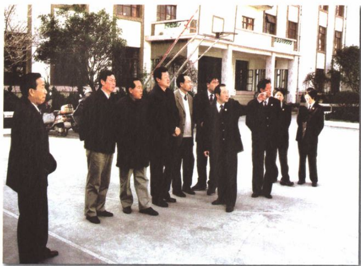
○ 2003年春节前,省委副书记陈培忠在市委书记王学智、市长米东生、市纪委书记李培等领导陪同下视察曲靖中级法院