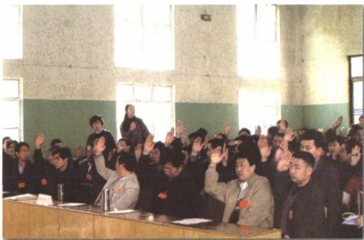
○ 债权人表决破产分配方案