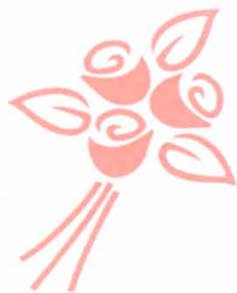
岩井公路剪彩通车