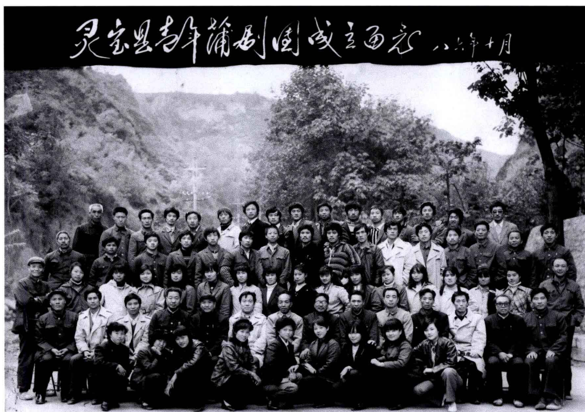
1986 年灵宝县青年蒲剧团成立留念