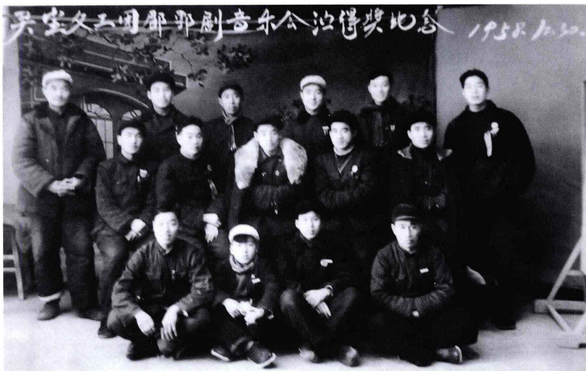
1958 年灵宝音乐会演眉户剧得奖留念