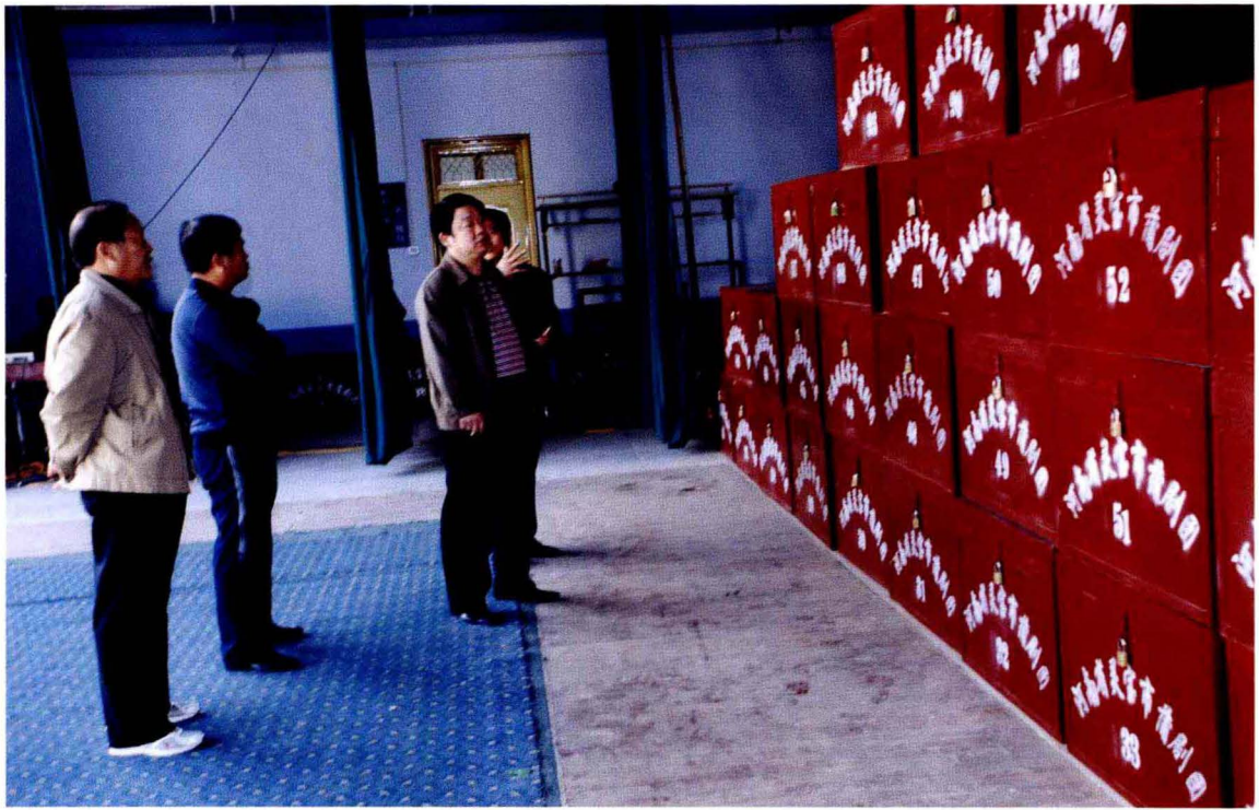
市文广新局局长张建华率班子成员为蒲剧团配送服装箱