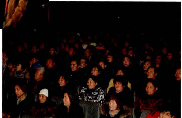
灵宝市四大班子有关领导在观看蒲剧现代戏《山村情》汇报演出。演出结束后领导们走上舞台,祝贺演出成功。