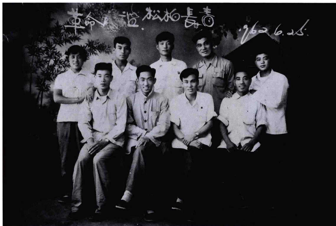
灵宝县眉户剧团主要领导、导演、演员合影