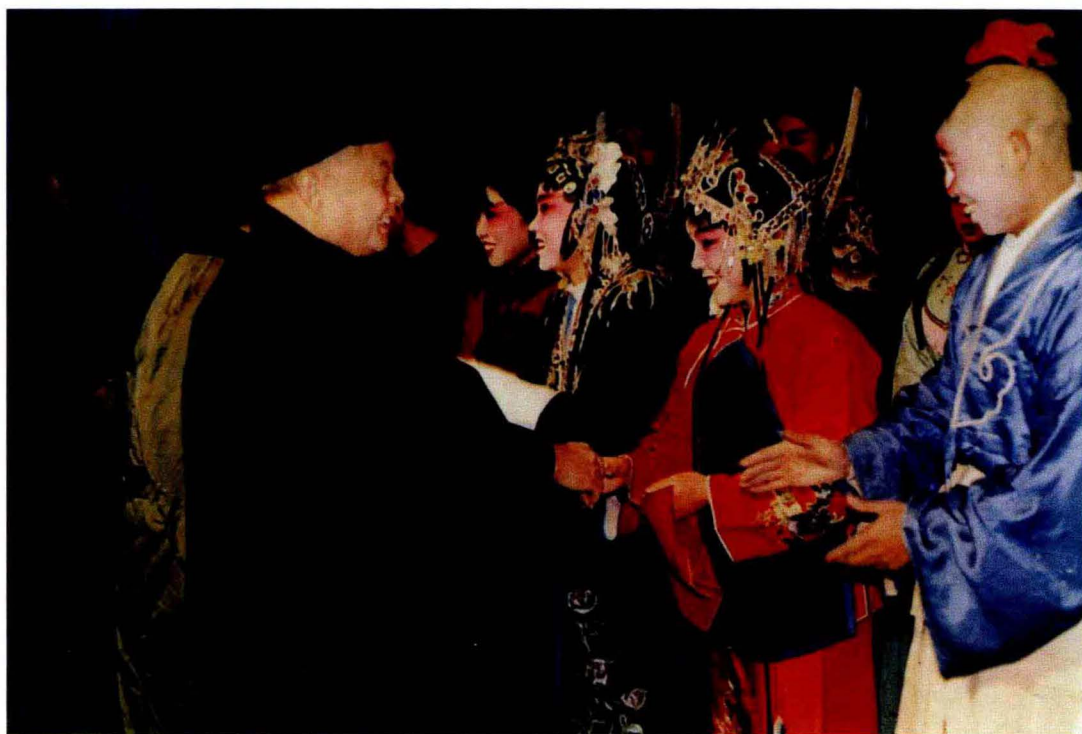
1988年,原三门峡市委书记吉长荣接见灵宝蒲剧团人员