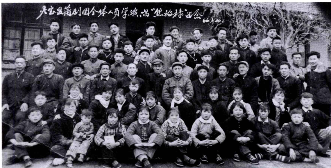
1966 年灵宝县蒲剧团全体演职员工留念