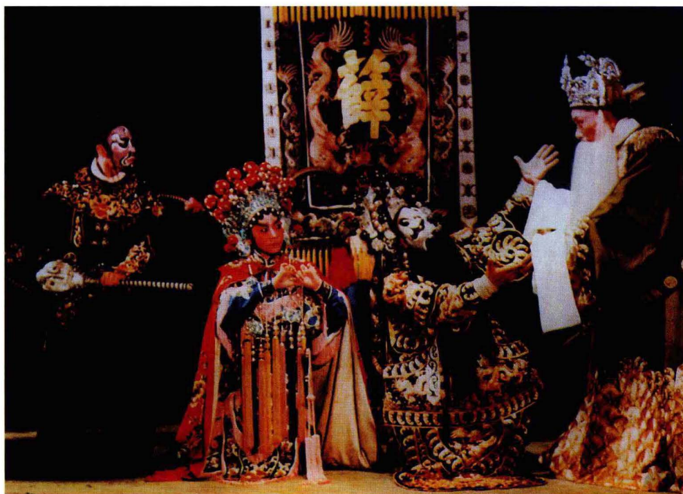
2012年灵宝市蒲剧团恢复排演了《薛刚反朝》