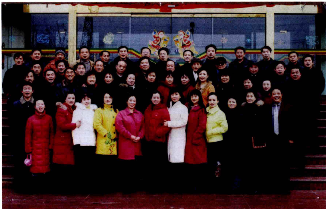
2006年元月,原洛阳戏校灵宝蒲剧班师生聚会合影