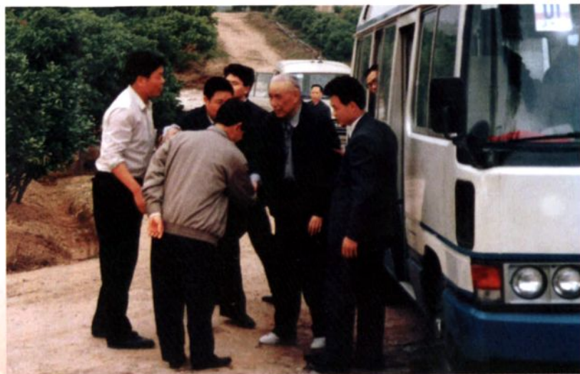
1992年，国务委员、中国人民银行行长李贵鲜到大岭山联发柑场视察。