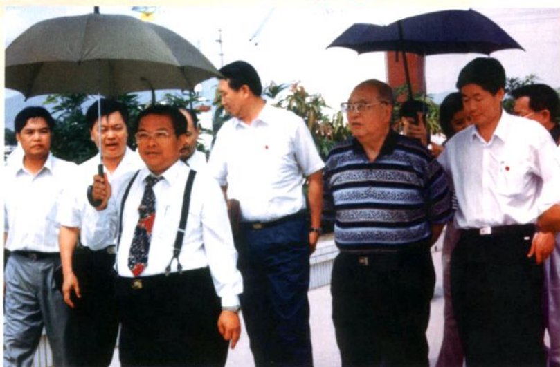
1996年7月7日，全国人大常委会副委员长王光英（右二）到大岭山德实利集团视察。