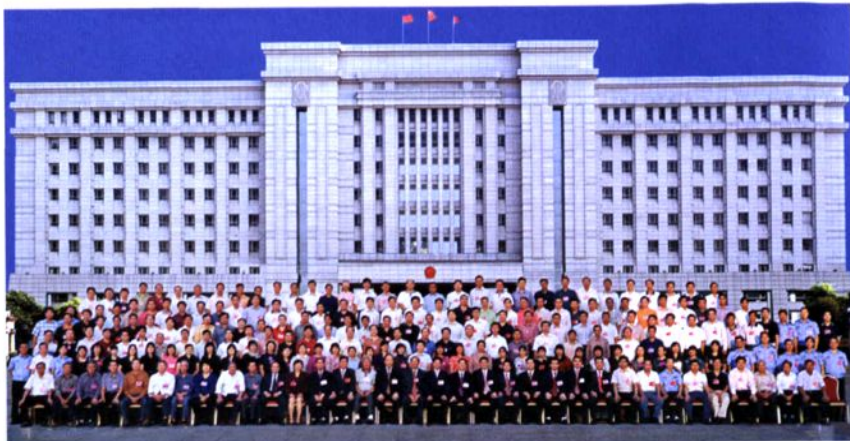
2006年11月6日，中共大岭山镇第十一次代表大会召开。图为全体代表（含列席代表）合影。