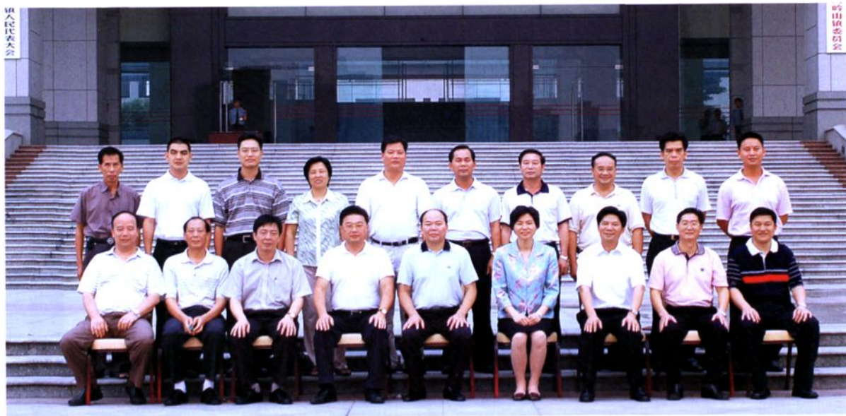
2006年换届后的大岭山镇两套班子合影。（其中前排左五为市委常委、市委副书记黄双福，右四为市委常委、组织部部长庞国梅，左四为原大岭山镇委书记镇人大主席黎惠勤，左三为市委组织部副部长陈柏南。右三为大岭山镇委书记、镇人大主席梁荣业，右二为镇委副书记、镇长胡浩举。