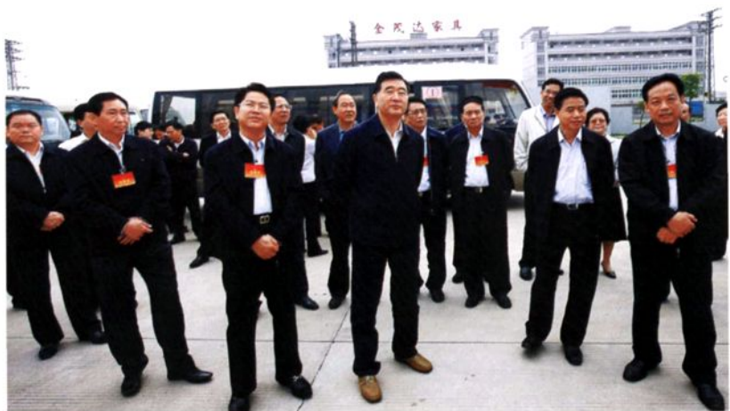
2009年4月9日，中共中央政治局委员、广东省省委书记汪洋（前左三），省长黄华华（前右二）等省市领导到大岭山镇视察连马污水处理厂。