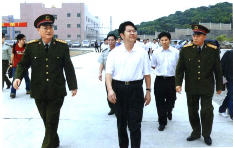
2006年11月13日，市委书记、市人大常委会主任刘志庚（中）到大岭山镇视察新启用的东莞国防教育基地。