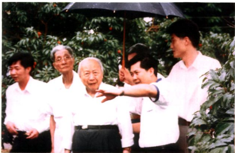
1997年7月4日，原全国政协副主席钱伟长（前左三）到大岭山柑桔场视察。