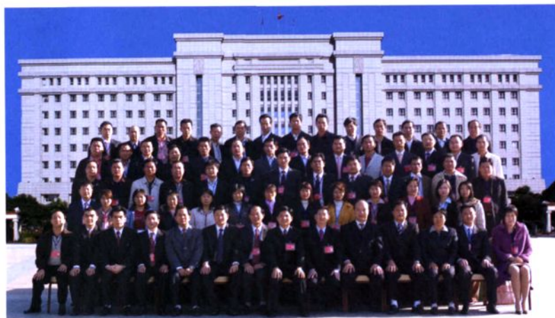
2006年12月19日，大岭山镇第十五届人民代表大会召开。图为全体代表合影。