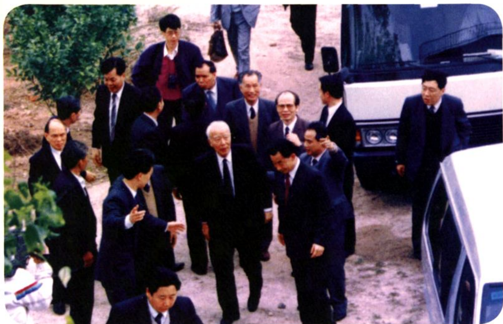
1991年2月17日，全国人大常委会委员长万里（中）到大岭山联发果场视察。