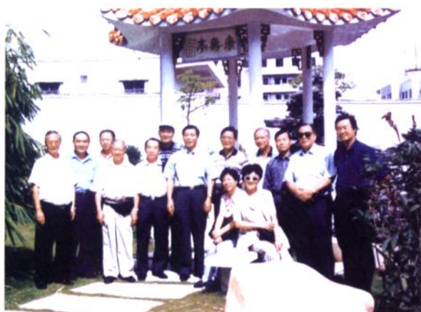
东莞市政协第八届港澳委员为大岭山敬老院捐款20万元。图为1998年7月7日，该委员会成员视察大岭山时，在敬老院“康寿亭”前留影。