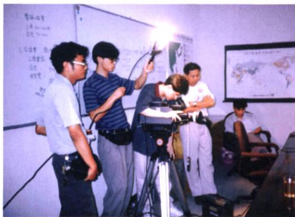
1994年8月17日，中央电视台采访大岭山镇嘉财电子厂。