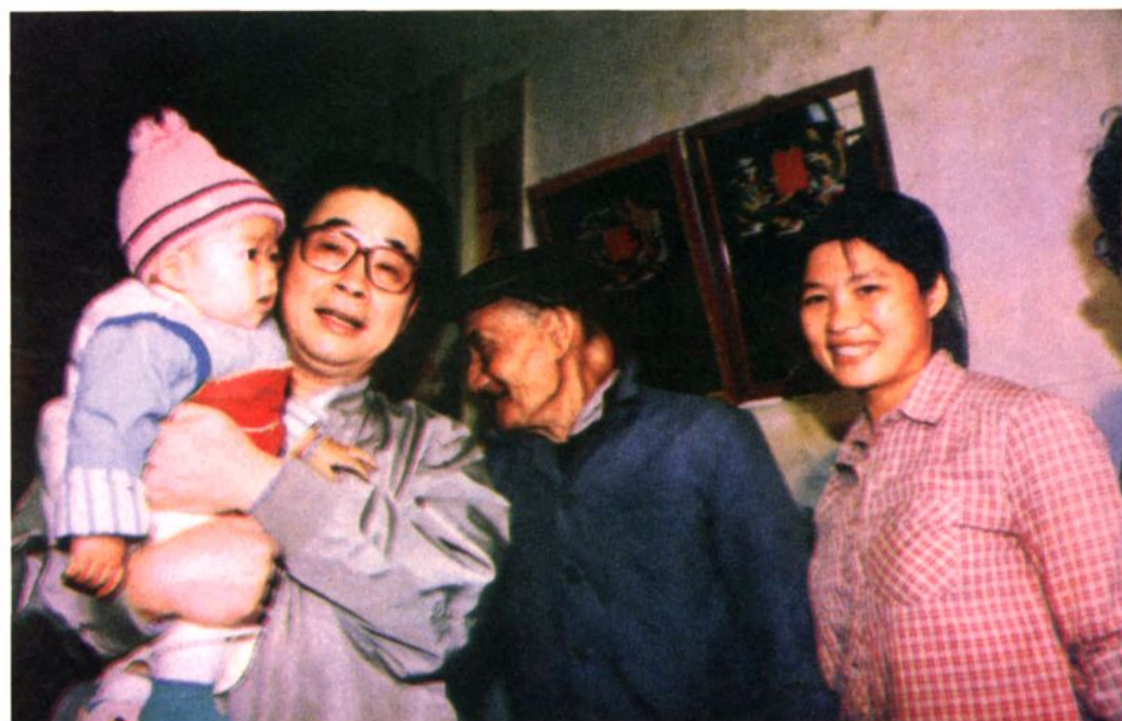
1988年1月5日，中共中央政治局常委、国务院代总理李鹏（右三）在矮岭田村叶庆福家访问。