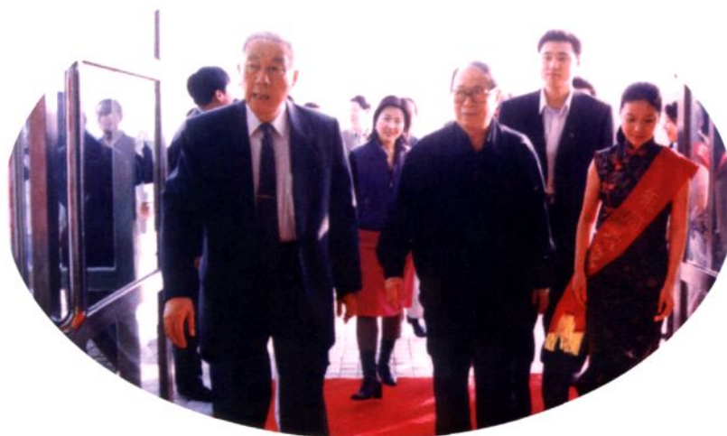
2000年11月25日，全国政协副主席孙孚凌（前左二）到大岭山钜同厂视察。