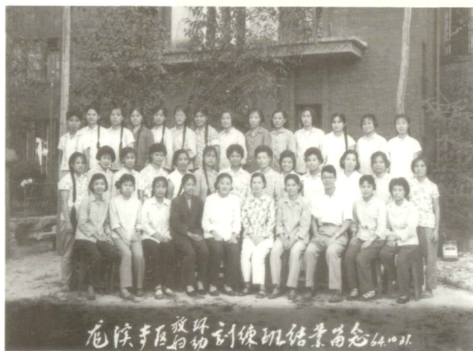
龙溪专区放环妇幼训练班结业留念