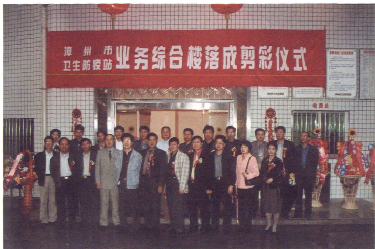
2001年4月8日业务综合楼落成