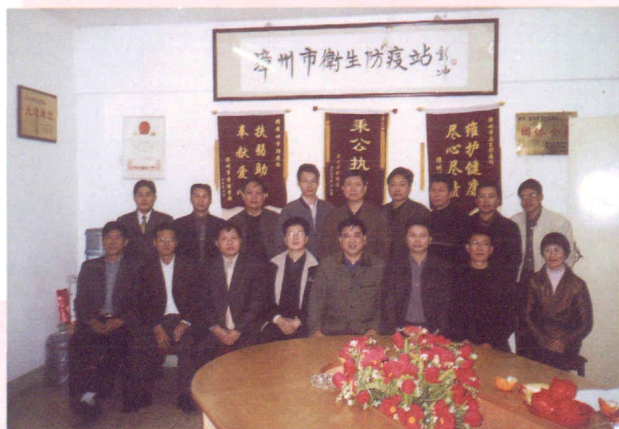
2003年1月召开各县(市、区)防疫站长参加的疾病控制研讨会