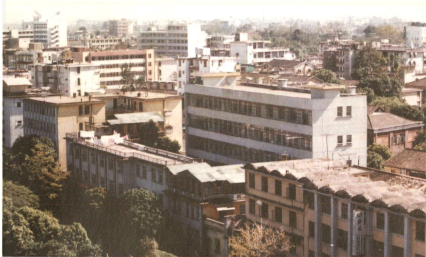
漳州市卫生防疫站旧貌全景