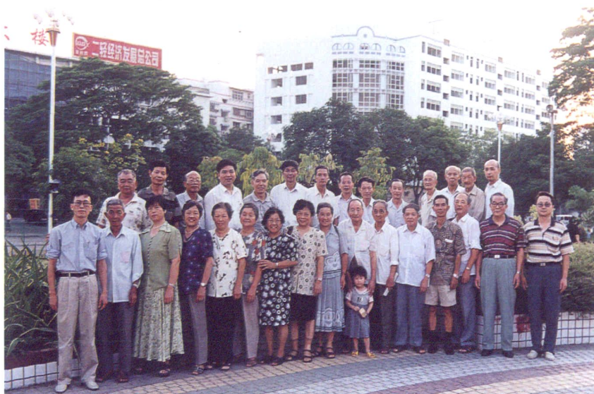
2000年市卫生防疫站领导与离退休老同志合影留念