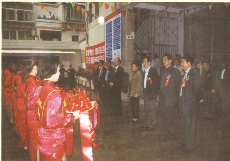
2001年4月8日，中共漳州市委书记郑立中、市长李天森、副书记郑道溪、市政协主席林碧华、副市长林奕斌、副市长黄和东、副主任何红孙和市卫生局局长李惜真等领导为业务综合楼落成剪彩