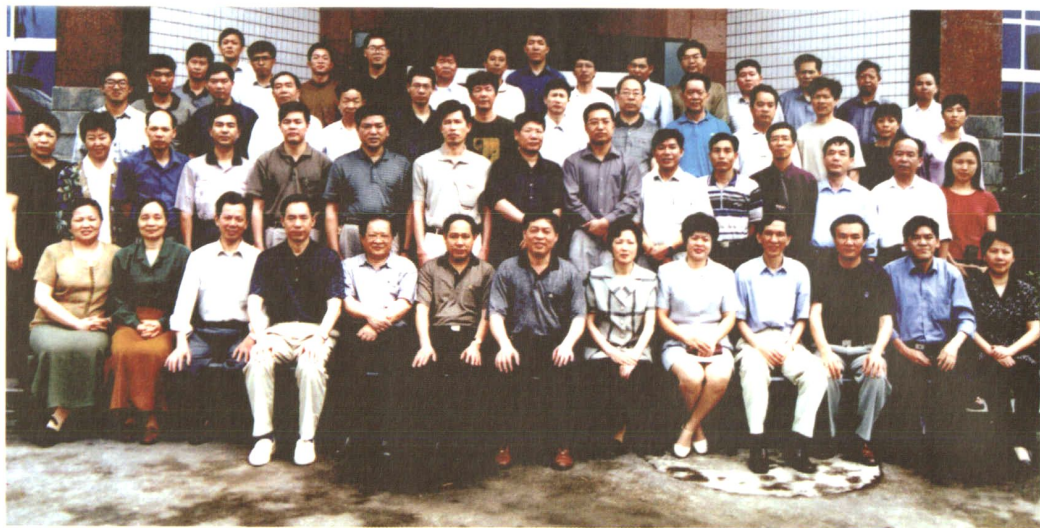
2001年5月，省卫生厅陈文加副厅长与参加省世行贷款卫九项目代表合影