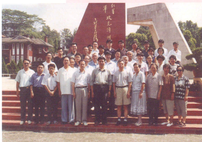
中共市卫生防疫总支组织党员参观红军进漳纪念馆