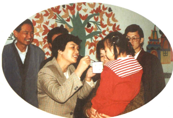
市政府林瑞华副市长为儿童喂服预防小儿麻痹糖丸