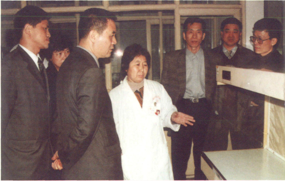
省卫生厅杨平厅长、黄和东副市长视察市卫生防疫站