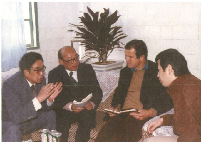
WHO官员到漳州考察计免工作