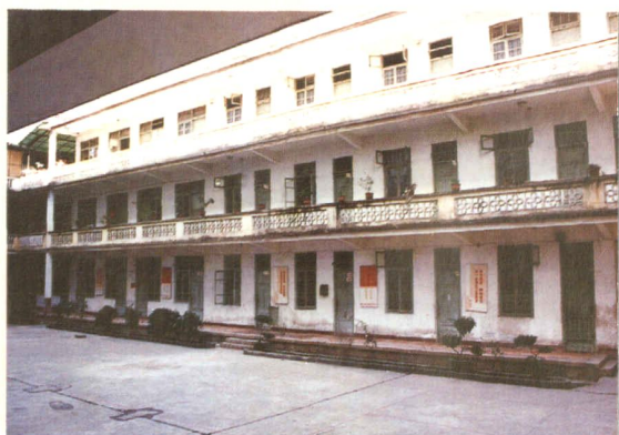
漳州市卫生防疫站旧办公楼