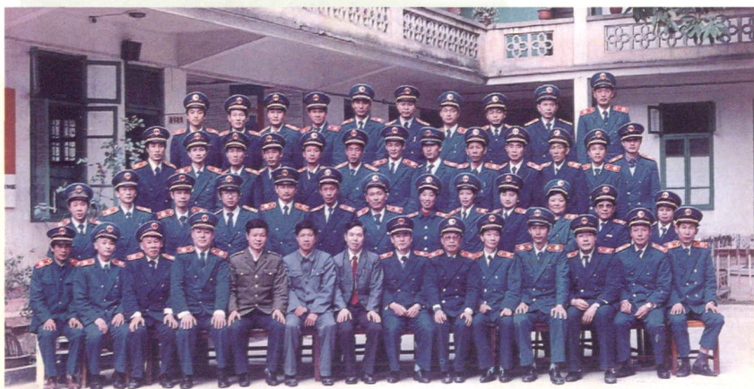
1990年5月全市卫生监督员合影