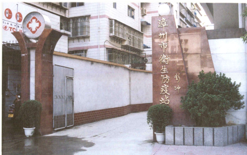
漳州市卫生防疫站大门外景