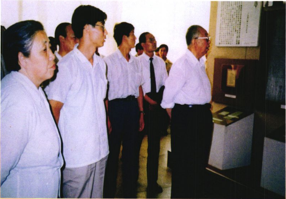
1991年，原中共中央主席、国务院总理、中央军委主席华国锋参观八路军太行纪念馆