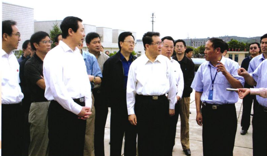
2004年8月，中央政治局常委李长春在省、市领导陪同下在武乡视察，指出要将八路军太行纪念馆建成全国一流的爱国主义教育基地