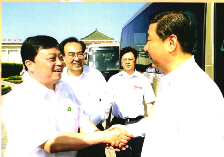
2009年5月25日，中共中央政治局常委、国家副主席习近平在省、市、县领导陪同下视察武乡。图为习近平与县委书记周涛亲切交谈