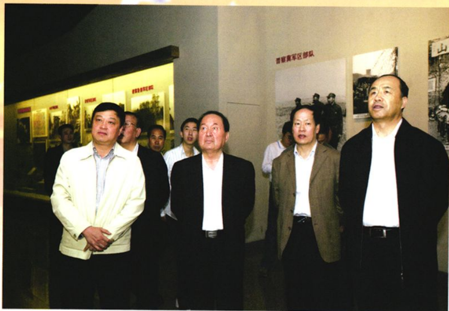
2008年5月16日，全国人大常委会副委员长司马义·铁力瓦尔地在省人大副主任郭海亮、县委书记周涛、县人大主任袁俊山陪同下视察八路军太行纪念馆