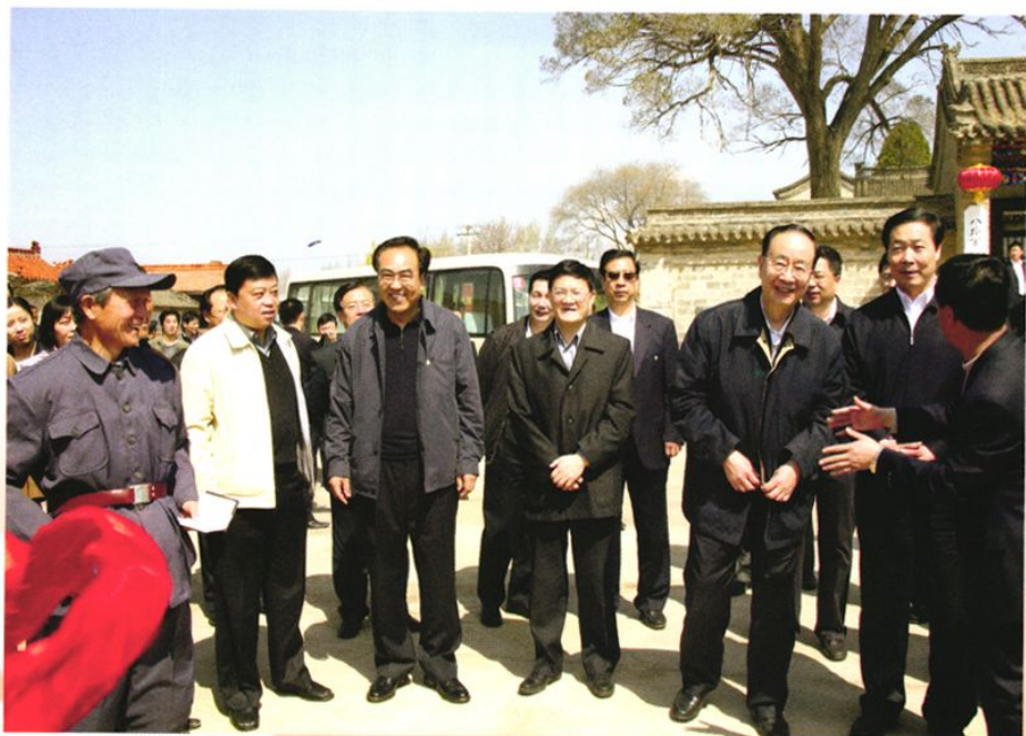
2008年，中共中央办公厅主任、中纪委副书记何勇在省委书记张宝顺、市委书记杜善学、县委书记周涛等省、市、县领导陪同下参观武乡砖壁百团大战指挥部旧址