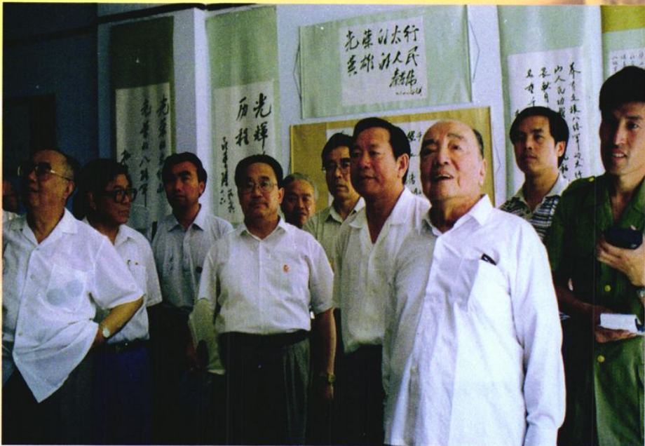
1995年7月，原国家主席杨尚昆视察八路军太行纪念馆