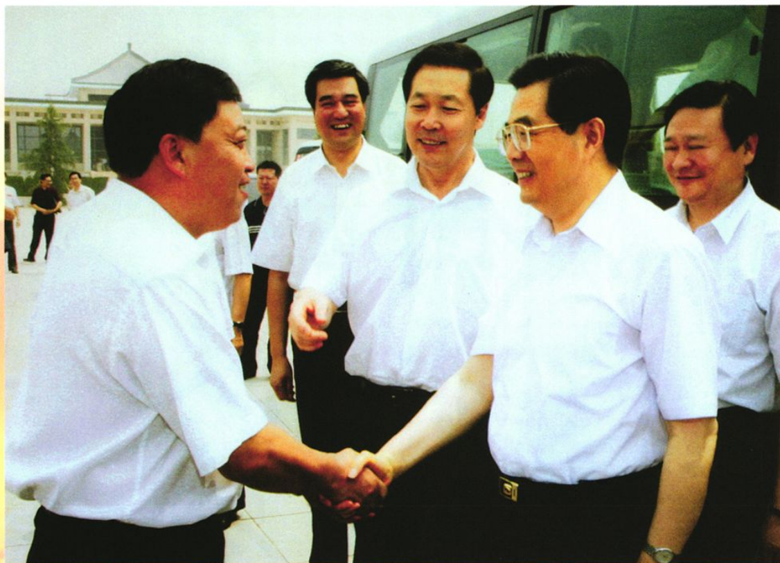
2005年7月29日,中共中央总书记、国家主席、中央军委主席胡锦涛在武乡视察,与周涛亲切交谈