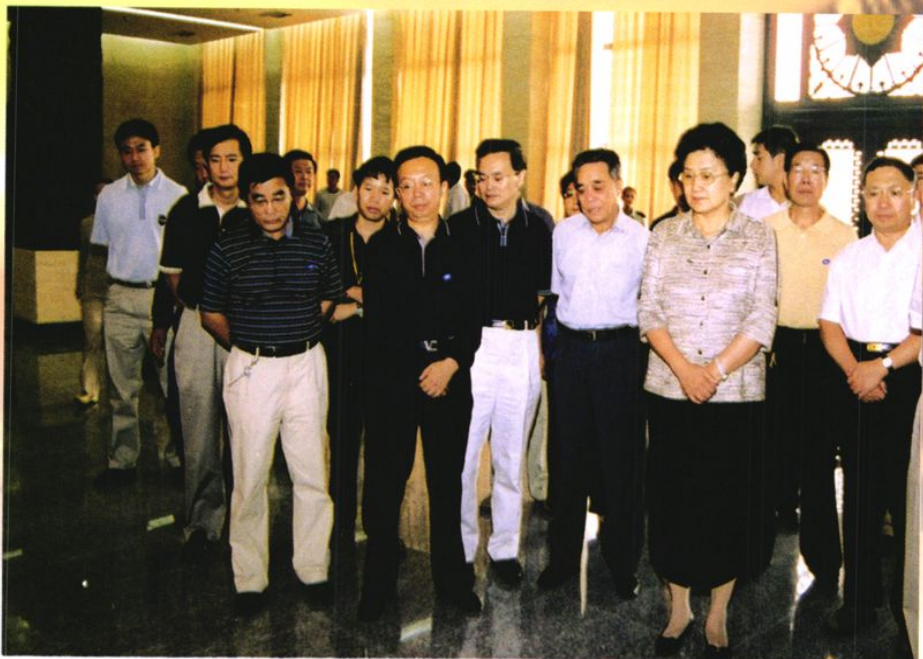
2005年9月8日，时任十届全国政协副主席、中央统战部部长刘延东参观八路军太行纪念馆