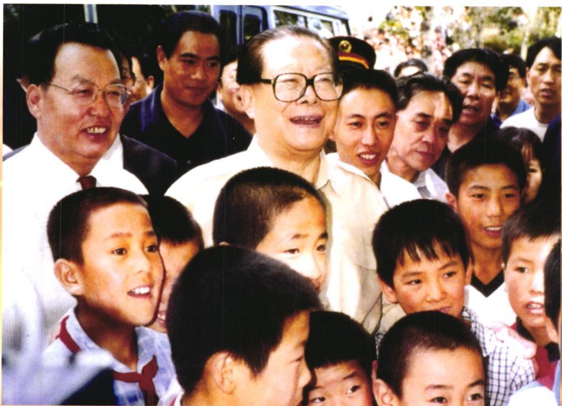
2001年8月20日,时任中共中央总书记、国家主席、中央军委主席江泽民在八路军总部王家峪旧址视察