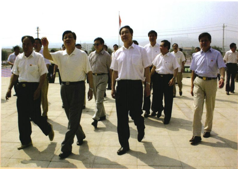
2004年，中共中央政治局委员、中央书记处书记、中央宣传部长刘云山在省委书记张宝顺等省、市、县领导陪同下视察八路军太行纪念馆改陈扩建工程