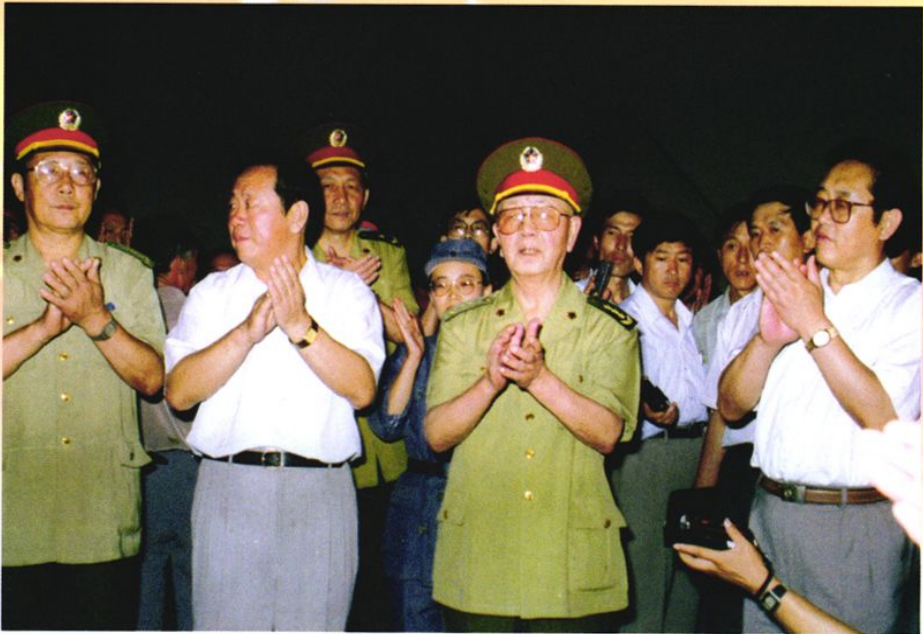
1995年8月，中共中央政治局常委、中央军委副主席刘华清回访武乡