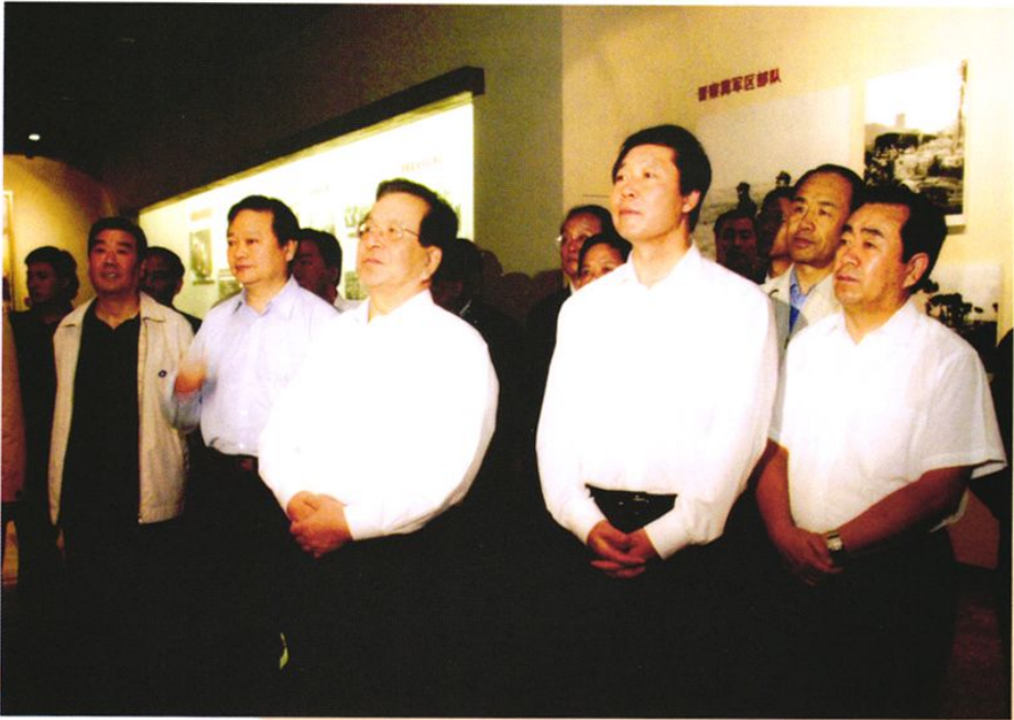
2007年，时任中共中央政治局常委、国家副主席曾庆红在原省委书记张宝顺等省、市、县领导陪同下视察八路军太行纪念馆