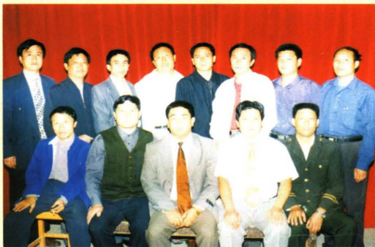
◆ 2001年10月，黄亭市镇召开第十届党代会时大会主席团成员合影