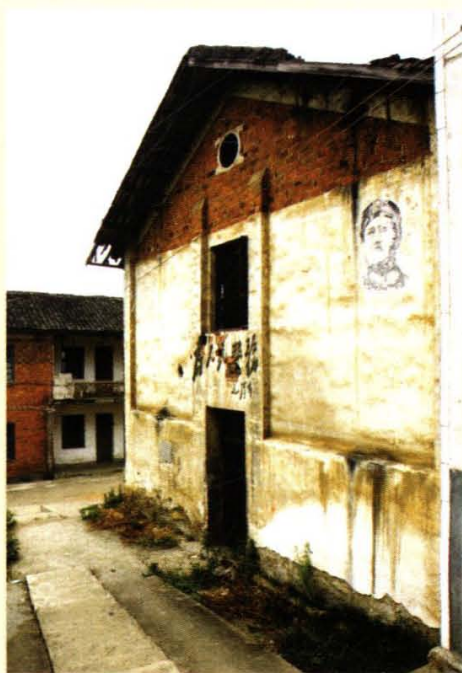
◆ 原双清人民公社办公楼一角