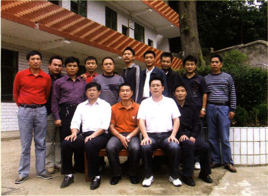
◆ 2009年9月黄亭市镇党政领导成员合影