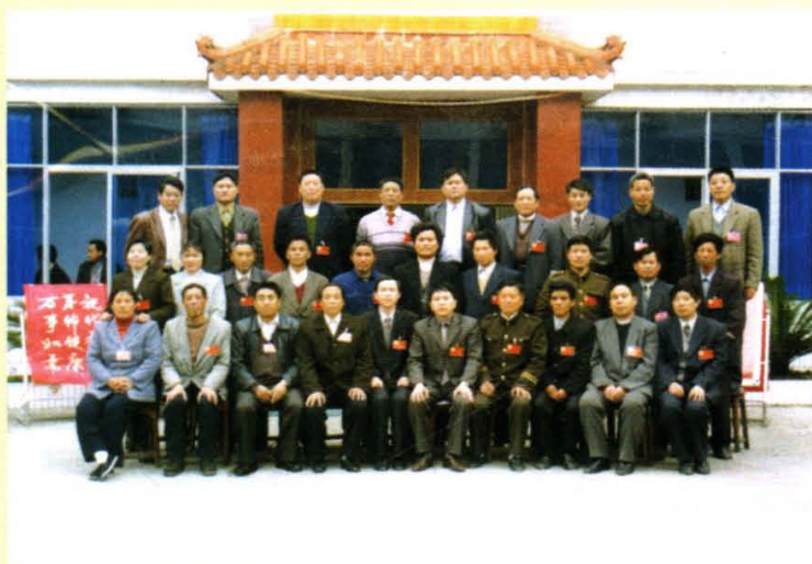
◆ 2002年3月出席县十三届人大六次会议的黄亭市镇、诸甲亭乡的县人大代表（第五代表团）及列席人员合影