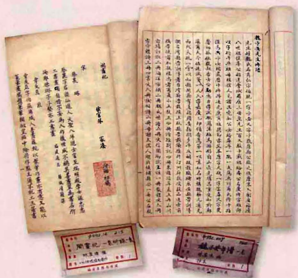
《闽画纪》、《魏子安先生年谱》书影