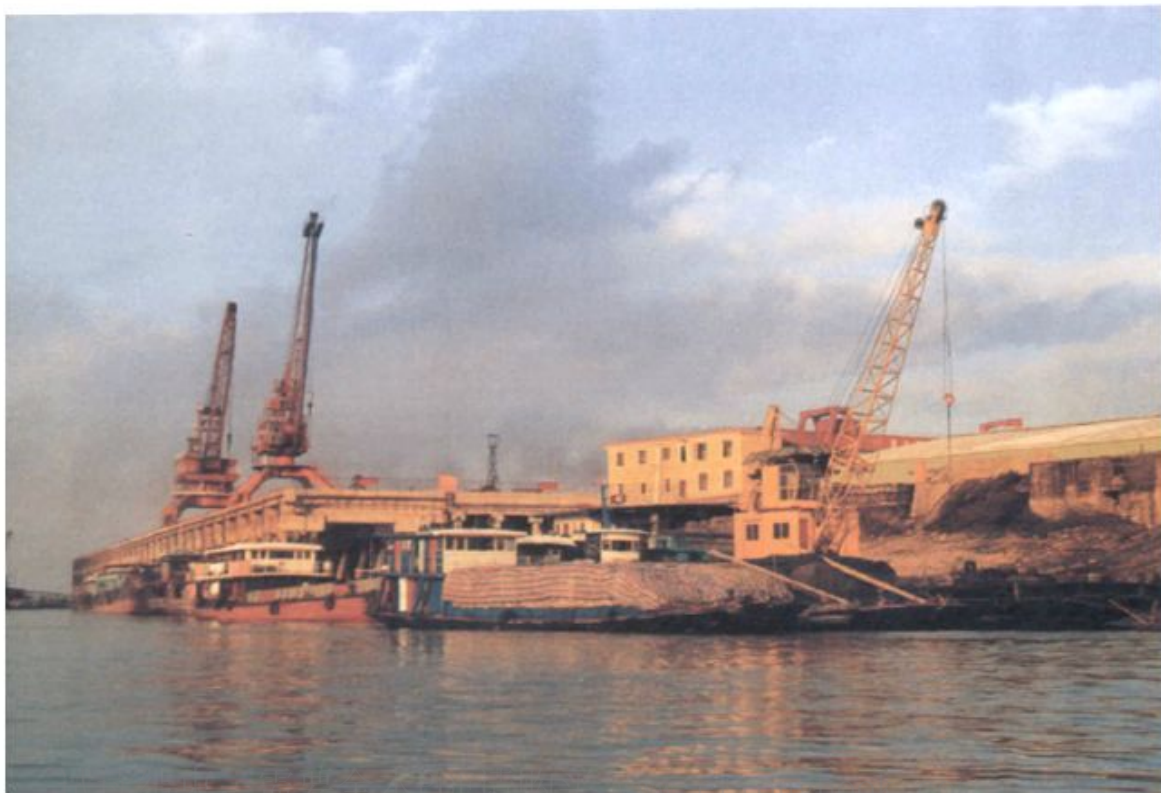
岳阳城陵矶口岸 5000 吨级外贸码头