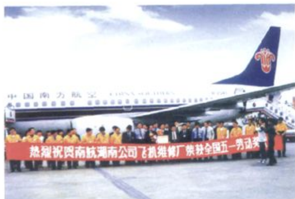
南航湖南分公司飞机维修厂荣获全国“五一劳动奖状”

中国南方航空集团公司湖南分公司1992年8月28日成立。1993年7月30日以后，更名为“南方航空（集团）湖南公司”。1998年该（集团）公司完成股份制改造，更名为中国南方航空股份有限公司湖南分公司。1992年，民航广州管理局实施管理体制变革，按照“飞行部队成建制划归航空公司”的规定，原民航湖南省局所辖“长沙飞行中队”成建制纳入南方航空公司湖南分公司，改名称为南航湖南分公司飞行部，是湖南民用航空系统中人数最多、力量最强的一支空勤队伍。1992年10月25日，南航调拨湖南分公司的两架波音737-500型飞机在黄花机场举行首航仪式，正式投入营运，成为南航湖南分公司的第一批大型客机，也结束了湖南省无大型客机的历史。