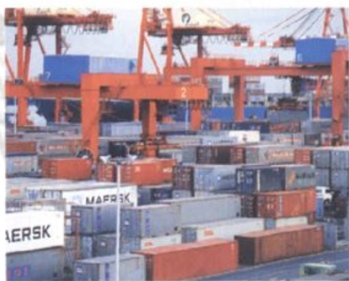
岳阳城陵矶口岸集装箱仓库