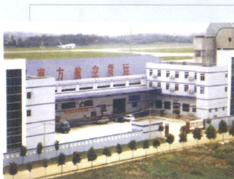
南航湖南分公司货运大楼

1999年南航湖南分公司飞机维修厂被全国总工会授予“全国五一劳动奖状”。2002年9月，民航湖南省局现场运行指挥中心客运部候机室荣获全国“青年文明号”称号。