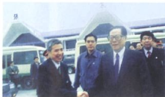
江泽民视察张家界机场