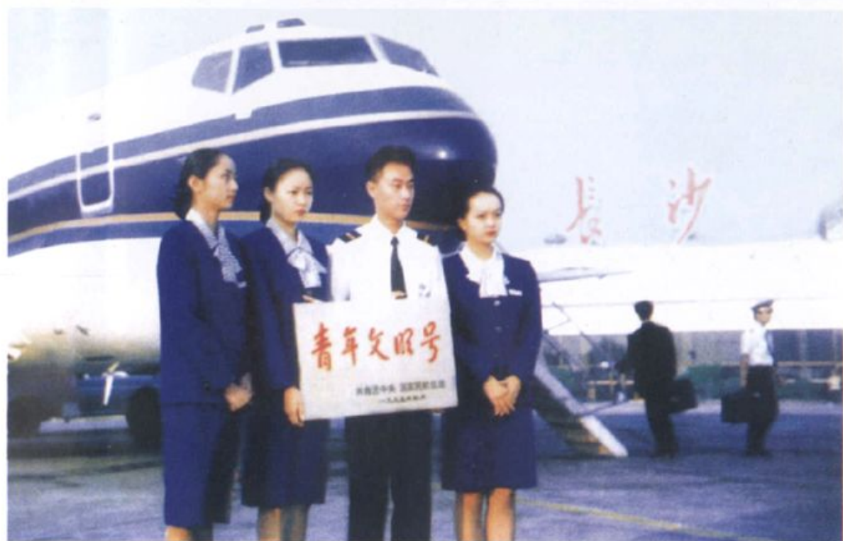
南航湖南分公司“芙蓉”乘务组获全国“青年文明号”

公司1993年有波音737-500型飞机3架，1994年有4架，1996年5架，1997年6架，2002年底起有7架。1992年后公司已开通国内航线80多条，国际航线4条，地区航线4条，航线总长达75000多公里，跨越24个省、市、自治区，实现了飞出中国、飞向世界的目标。每周担负着130余班的客货运输任务，年旅客运输量达100万人次。