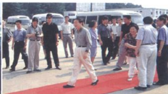
朱镕基途经长沙黄花国际机场

量达 260 万人次，跻身于国内前 20 名，货邮吞吐量达 25438 吨，列全国第 26 名。