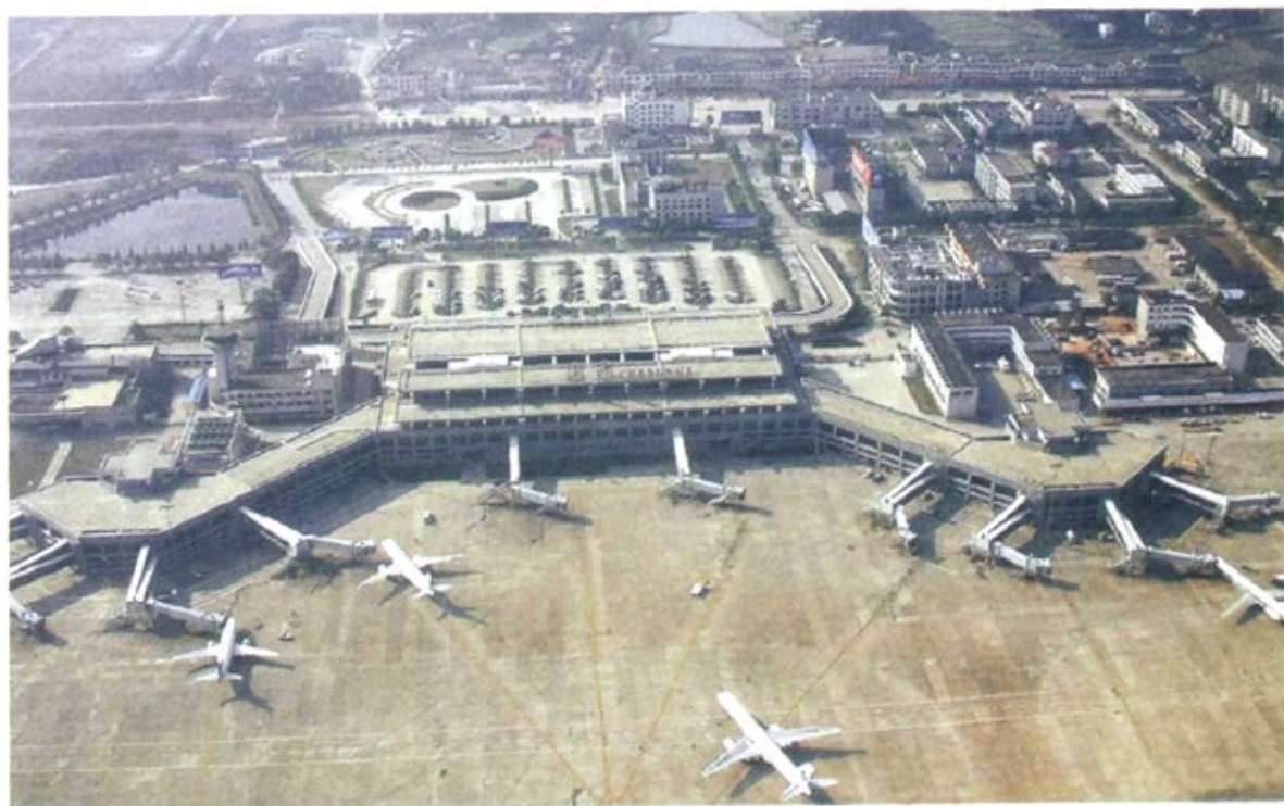
长沙黄花国际机场全景