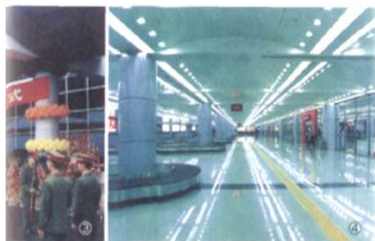
①张家界荷花国际机场

湖南省机场管理集团有限公司始终立足于提供高品质的空港服务，创造高品位的航空文化，以“服务顾客、完善自我、回报社会”为企业的宗旨，致力于为航空公司、旅客、货主提供高效率、高品质的服务，致力于湖南地区的经济腾飞，致力于社会的繁荣进步。