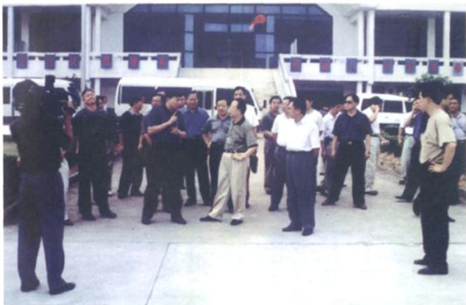
湖南省委书记杨正午视察长沙黄花国际机场