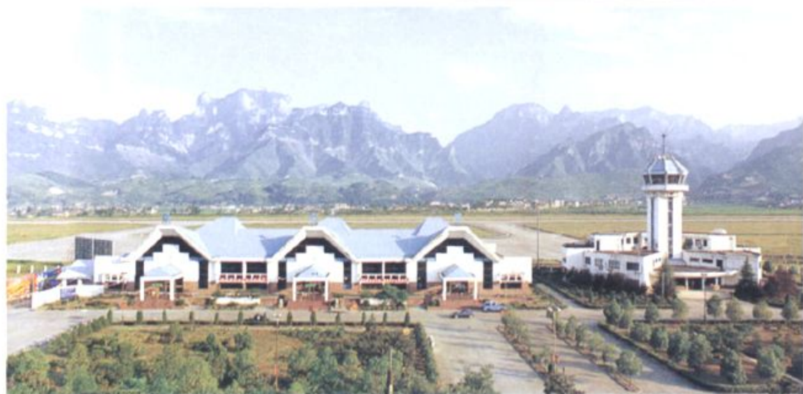
张家界荷花国际机场全景