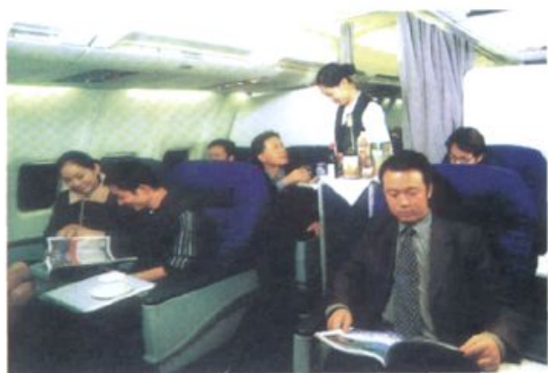
南航湖南分公司的客舱服务