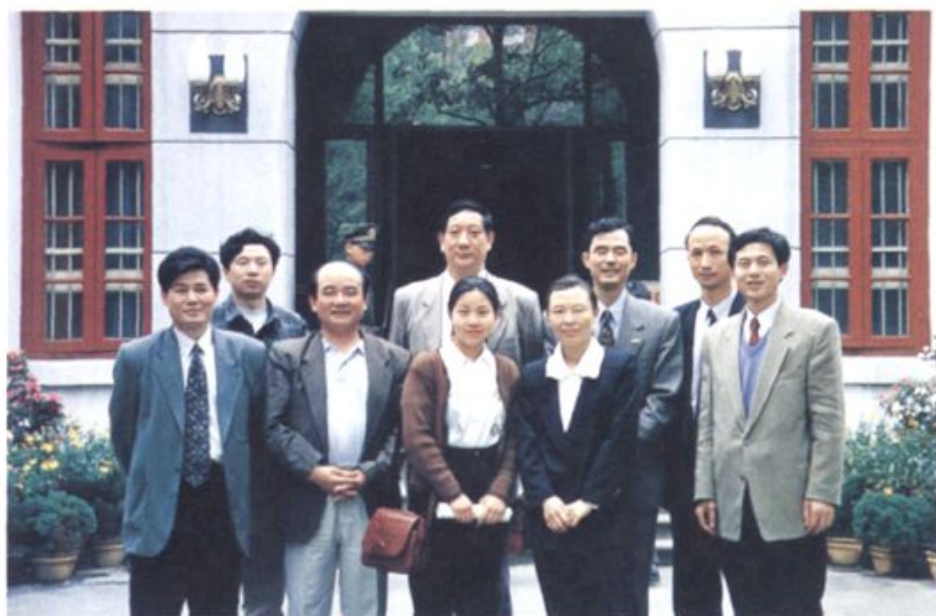
国家口岸办主任叶剑(后排左二)在政府办公厅助理巡视员曾署凡(前排左二)、湖南省口岸办主任赵子冰(后排左三)的陪同下视察湖南口岸工作