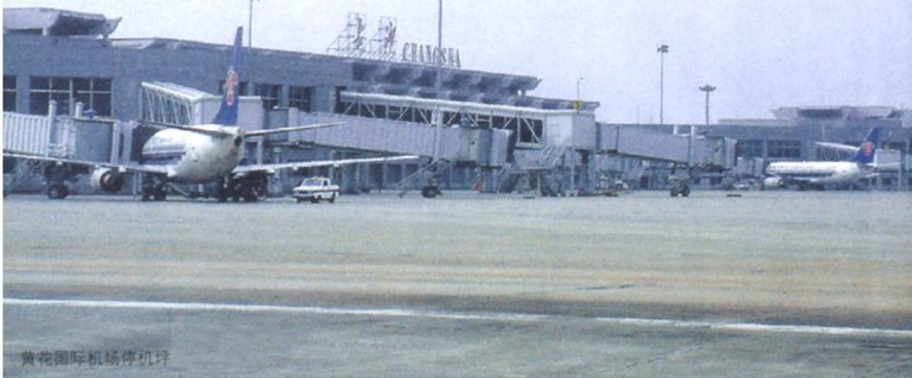
黄花国际机场停机坪

位于长沙黄花国际机场，于2003年4月18日挂牌成立。公司前身是民航湖南省管理局，2003年改制成为下辖长沙黄花、张家界荷花、常德桃花源、永州零陵四机场的湖南省直属的大型国有企业。公司始终强调以人为本，从推行规范化管理入手，着力加强人员素质建设，提高整体服务水平；以安全、质量、效益为中心，面向市场，适应市场，坚持走健康、持续、快速的发展之路。