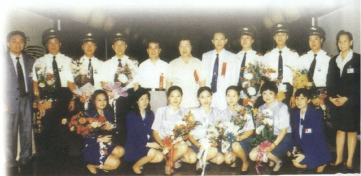
1995年7月20日長沙——曼谷通航機組