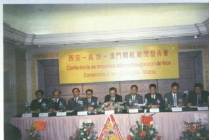
1995年7月在泰國舉辦慶祝長沙——曼谷首航招待會