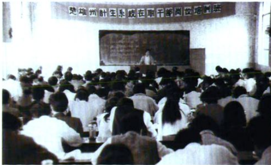
举办全州计生干部岗位培训班。