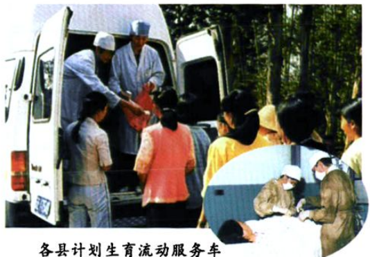
各县计划生育流动服务车下乡为群众服务。