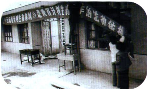
1990年《云南省计划生育条例》颁布后,全州各地展开了各种形式的宣传。