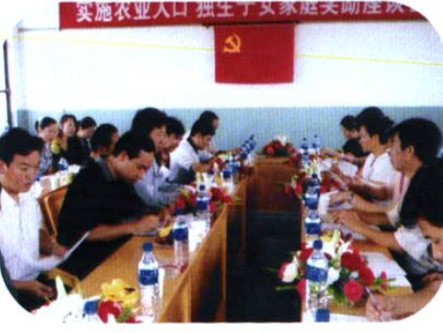
州计生委召开全州农业人口独生子女家庭奖励座谈会。