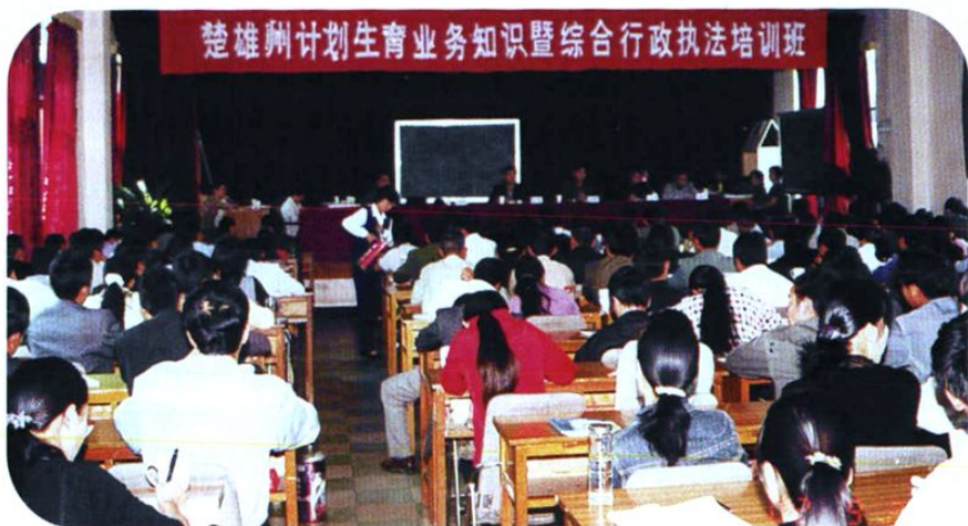
为做好依法行政工作,州计生委与法制部门共同举办行政执法培训班。