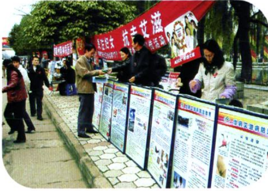
州市计生部门上街开展“关爱妇女、抗击艾滋”宣传。