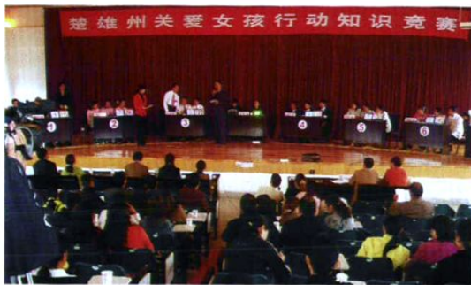
2006年全州关爱女孩行动知识竞赛现场