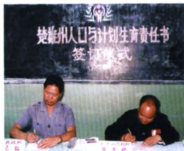
1991年4月州人民政府与各县(市)人民政府首次举行人口与计划生育责任书签字仪式。