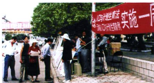
人口计生法实施一周年之际,楚雄州、市计生部门上街开展咨询服务活动。