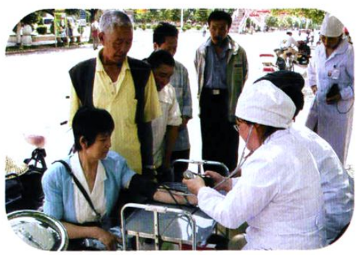
节假日,计生部门上街为群众服务。