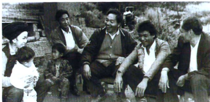
州委书记、人大主任普联和,州长罗正富,副州长樊以云在南华县岔河村向彝族群众了解计划生育情况。