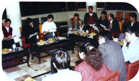
美国福特基金会官员在元谋县检查福特基金《生殖健康宣传服务》项目。