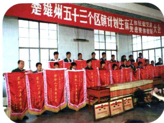
1986年,州政府召开全州53个区镇计生工作经验交流大会,并为进入先进行列的单位颁奖。