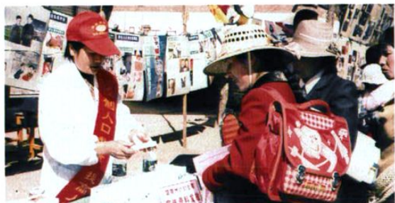
州避孕药具站工作人员上街宣传避孕药具知识，向群众免费发放避孕药具。