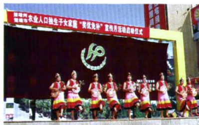
州、市计生部门宣传农村独生子女“奖优免补”政策。