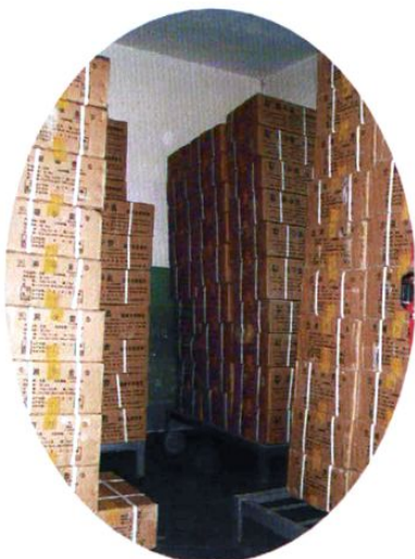
州避孕药具站药具仓库里摆放规范整齐的避孕药具。