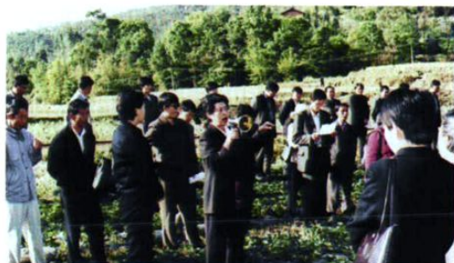
参观楚雄市鹿城镇鲍家村计划生育“三结合”林果基地。