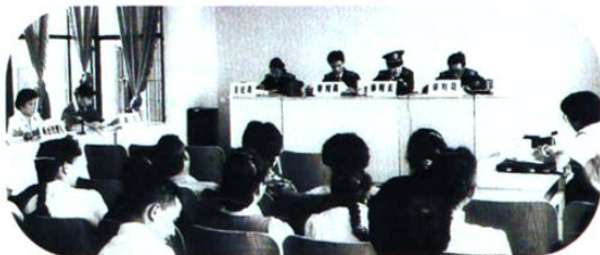
《云南省计划生育条例》实施以后,人民法院审理第一件强行超生案。