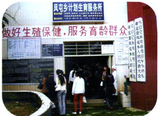
全州科技管理人员暨服务站站长、服务所所长在牟定县凤屯乡服务所参观考察。