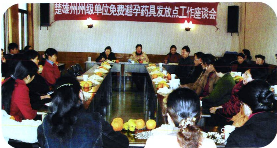
州计生委召开州级单位避孕药具发放工作座谈会。