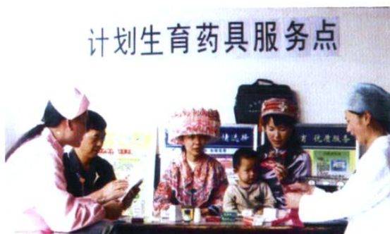
计生服务站人员在避孕药具服务点向群众介绍避孕药具。