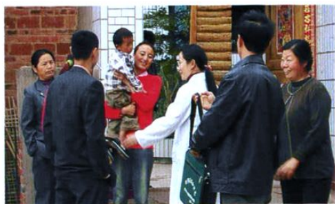
乡镇计生服务人员进村入户发放避孕药具。