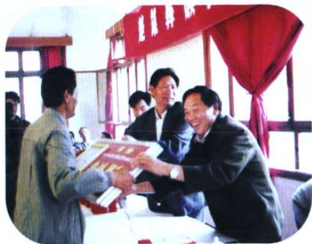
1991年,在全州计生工作会议上,州政府领导为先进单位颁奖。