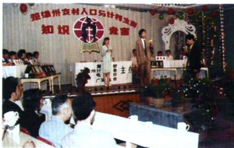
1990年5月,中共楚雄州委宣传部、计生委、电视台、广播电台共同举办全州农村人口与计划生育知识竞赛。