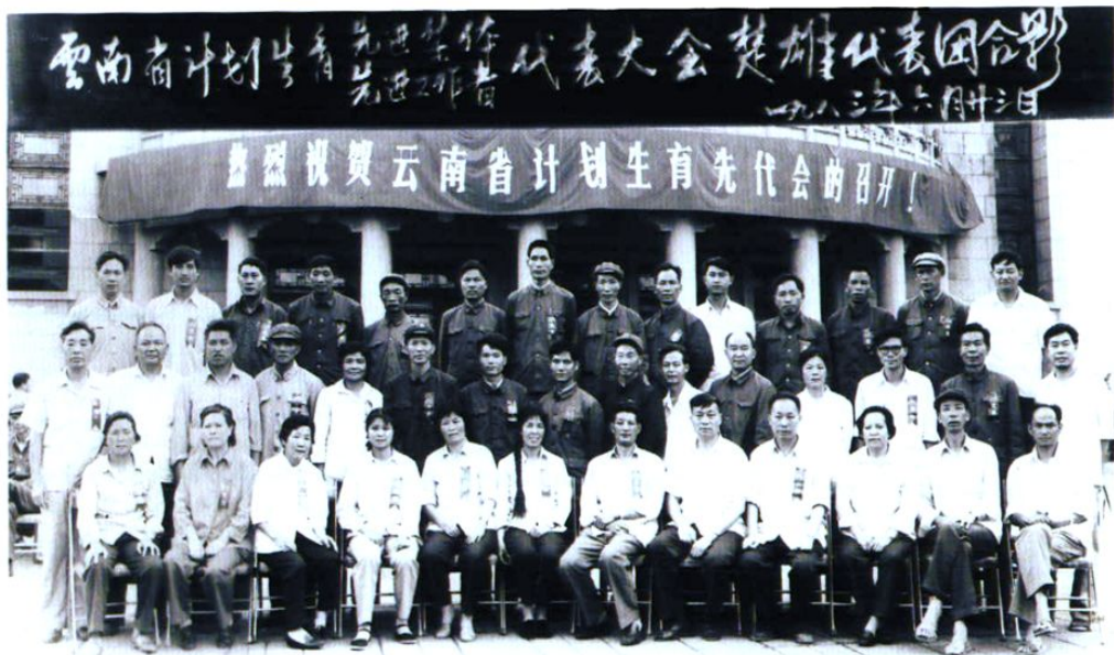
的楚雄州代表合影。 参加全省首届计划生育「双先会」。