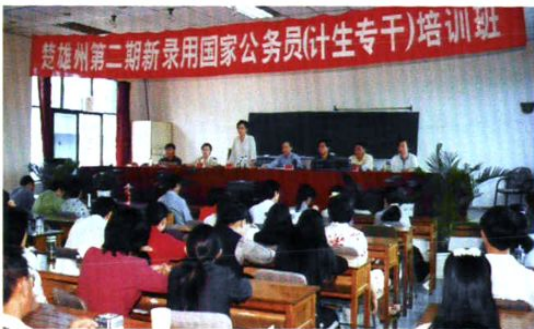
培训新录用计生公务员。