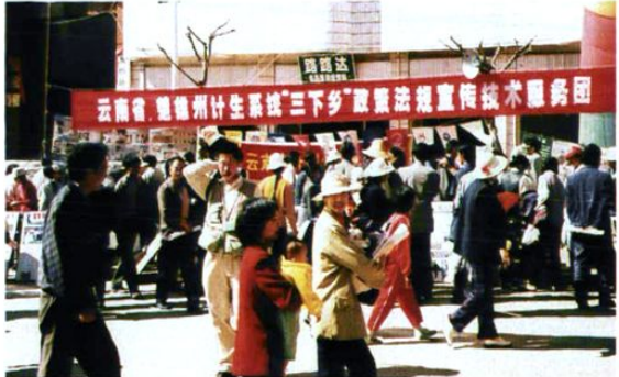
计生系统在“三下乡”活动中向群众开展计生政策、法规技术宣传。