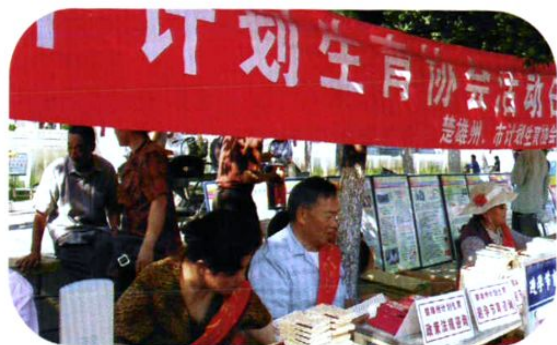
在全国第一个计生协会活动日,楚雄州、市计划生育协会领导上街开展宣传服务。