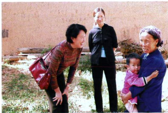
州人大副主任程建华深入基层调研。