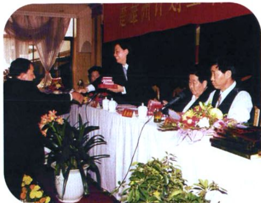
在全州计生工作会议上,州计生委领导为先进单位颁奖。