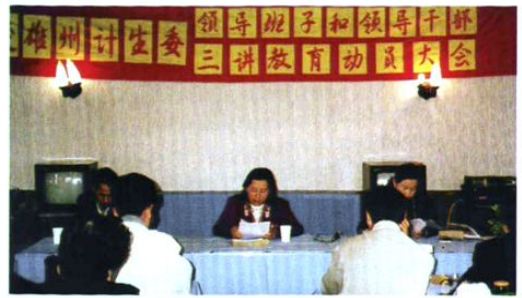
州计生委召开领导班子和领导干部“三讲”教育动员大会。