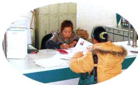
计生部门热情为群众办理各种计划生育证件。