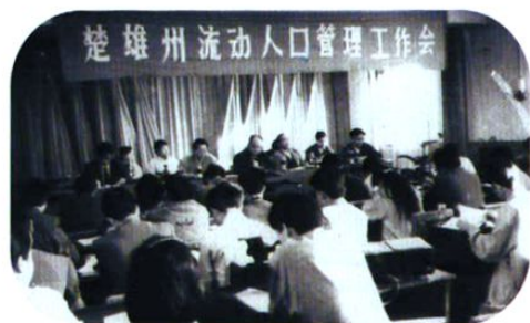
召开流动人口计划生育管理工作会议,研究部署抓紧抓好流动人口计划生育工作。