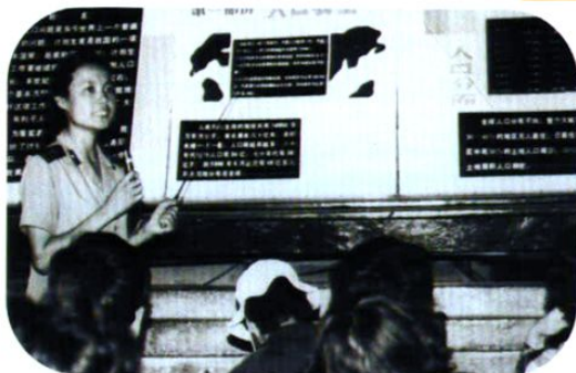
云南某集团军派出计划生育、优生优育宣传队到楚雄开展宣传活动。