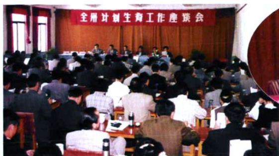
1992年4月,在州人代会期间,中共楚雄州委、州人民政府首次召开计划生育工作座谈会,并与各县市签订人口与计划生育工作目标责任书。