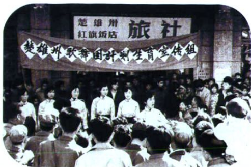
1983年春节期间,州、县文艺团体上街宣传计划生育。