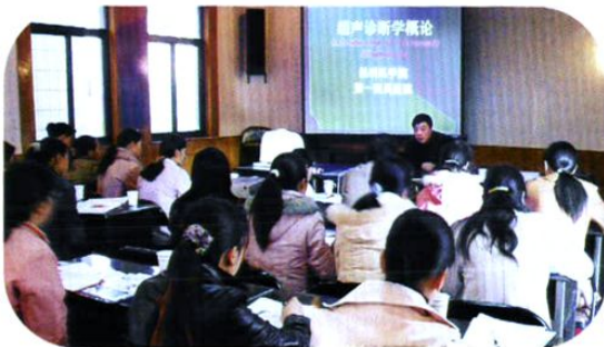
昆医附一院超声影像学专家在楚雄培训服务站、所技术人员B超诊断学知识。