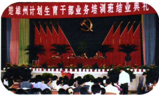
计生干部业务培训。