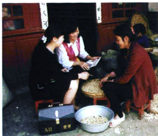
县计生服务站人员到农户家中走访和发放避孕药具。