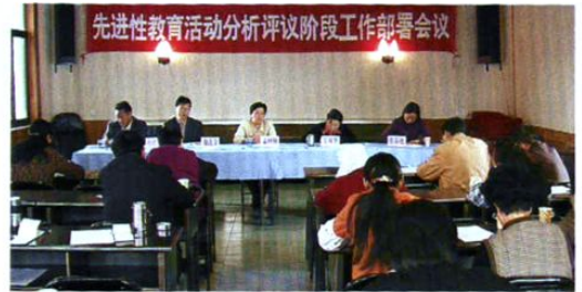
州计生委召开先进性教育活动大会。