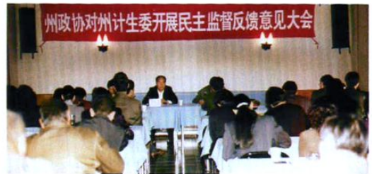
州政协对州计生委开展民主监督。