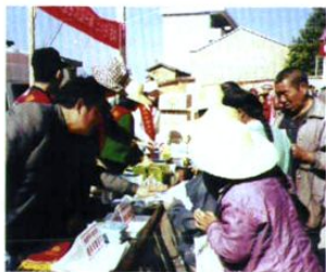
计生部门利用节假日上街宣传计划生育。