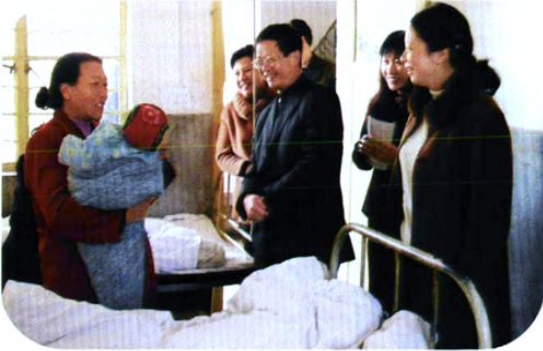
云南省计生委副主任朱建琨(中)在南华县计生服务站检查指导工作。