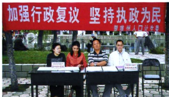
州人口计生委上街开展依法行政咨询服务。