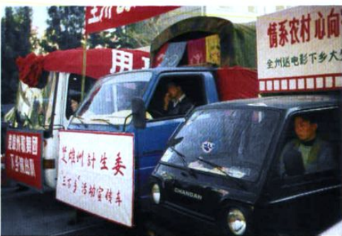
1997年2月26日,楚雄州首次“三下乡”活动启动,州计生委组织了宣传材料和避孕药具等物资参加了“三下乡”活动。