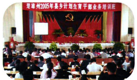
州计生委对县、乡计生干部开展业务培训。