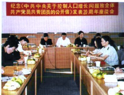
召开纪念《中共中央关于控制人口增长问题致全体共产党员共青团员的公开信》发表20周年座谈会。