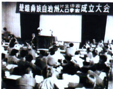
1988年5月20日,州计生协会、人口学会成立