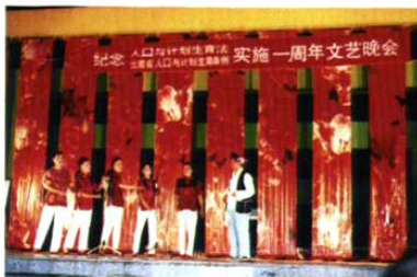
为纪念国家《人口计生法》和省人口计生《条例》实施一周年,楚雄州开展了各种形式的宣传活动。