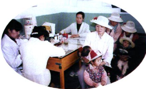
计生服务站、所热情为育龄群众服务。