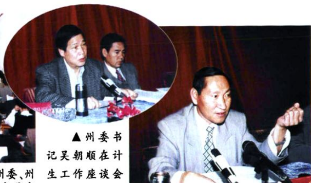
▲州委书记吴朝顺在计生工作座谈会上讲话。