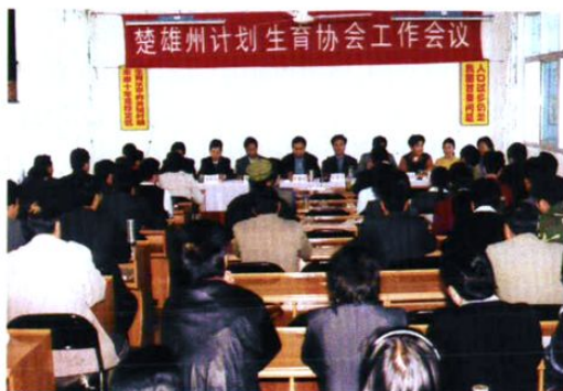
州计生协会召开全州协会工作会议。