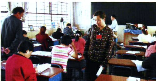
全省技术服务人员专业理论考试楚雄考点监考现场。