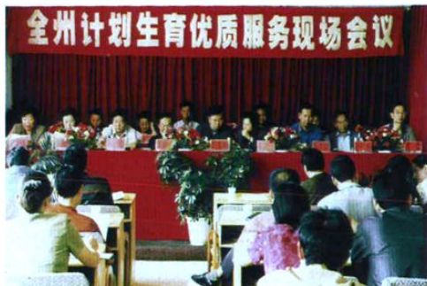
州计生委在牟定县召开全州计划生育优质服务现场会议。