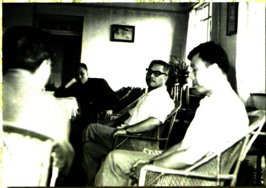
▲1983年中共安徽省委书记黄璜(右二)来校检查工作,看望老干部。