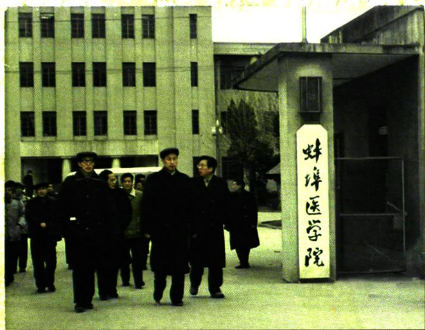
▼1990年中共安徽省委书记卢荣景(中)和省委常委、组织部长(右一)刘广才来校视察。