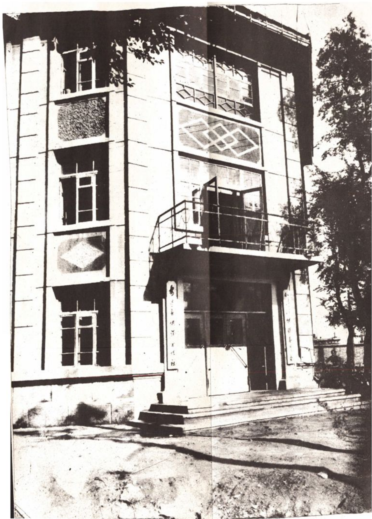
安达县供销社办公楼