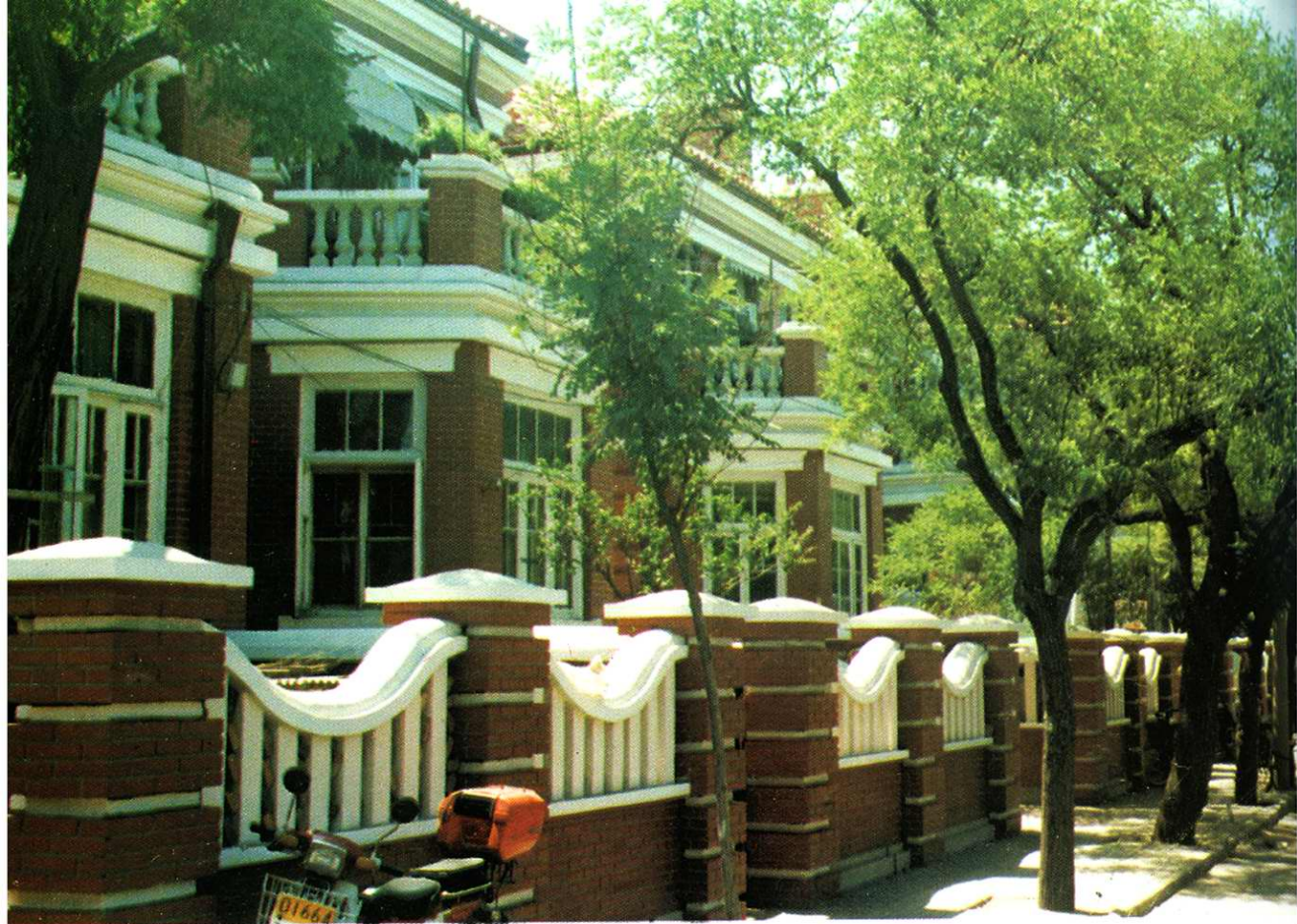
整修一新的马场道旧式小洋楼