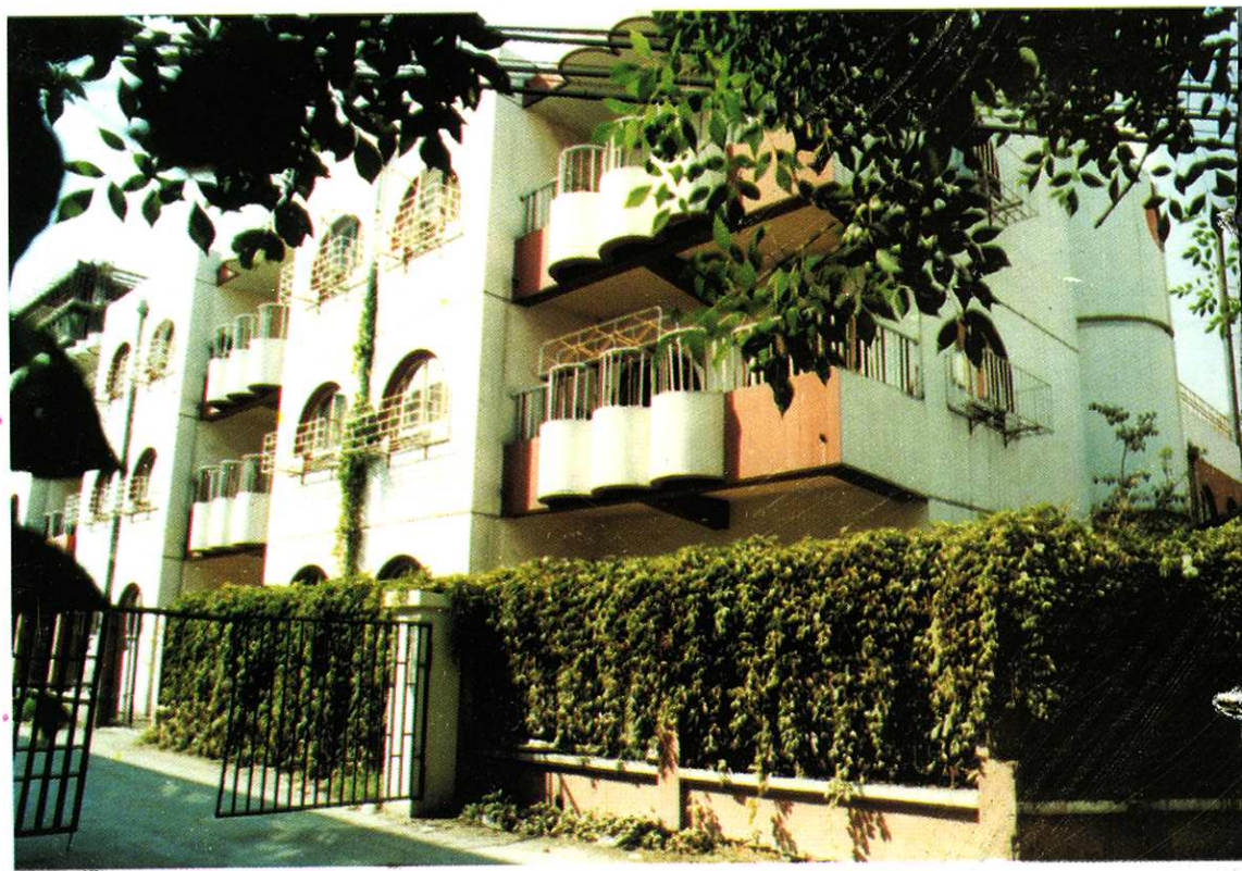
改造后的西南楼工人新村幼儿园