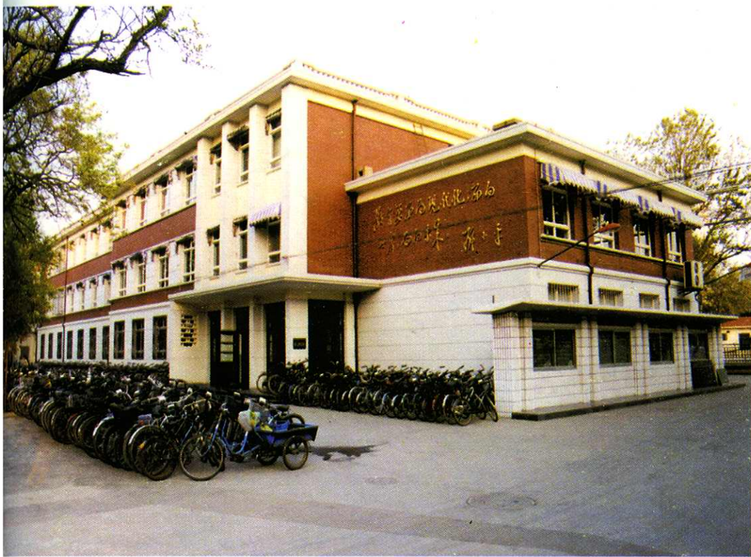
天津市第四十一中学