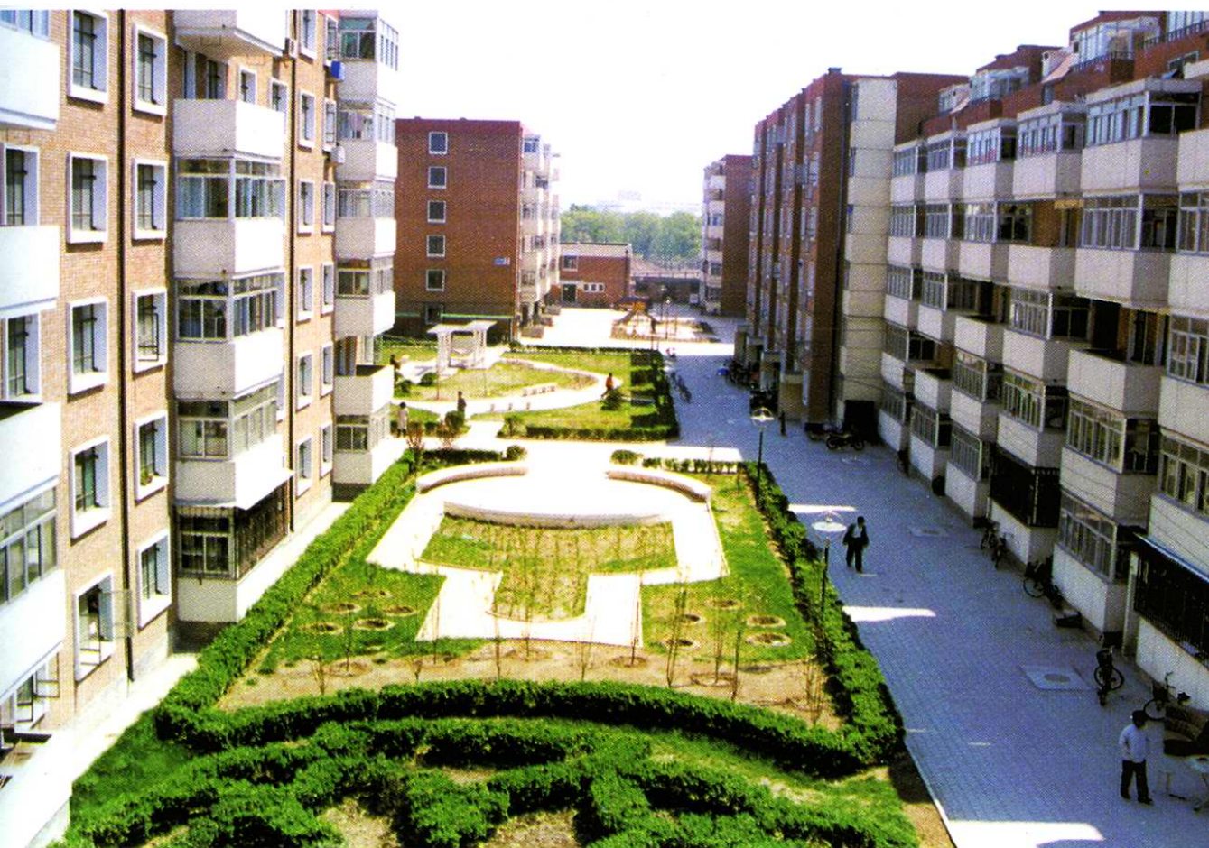
被称为小海地地区居民住宅的“一颗明珠”——昌源公寓