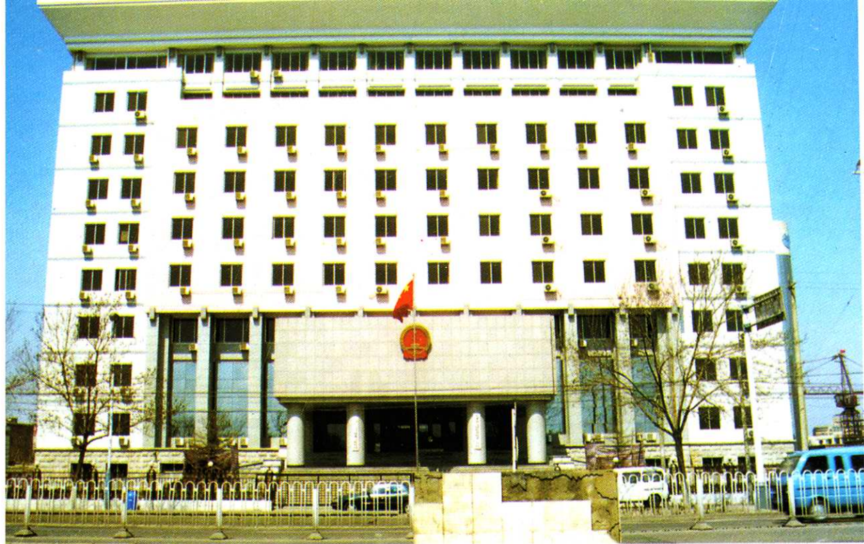
天津市检察院第二分院