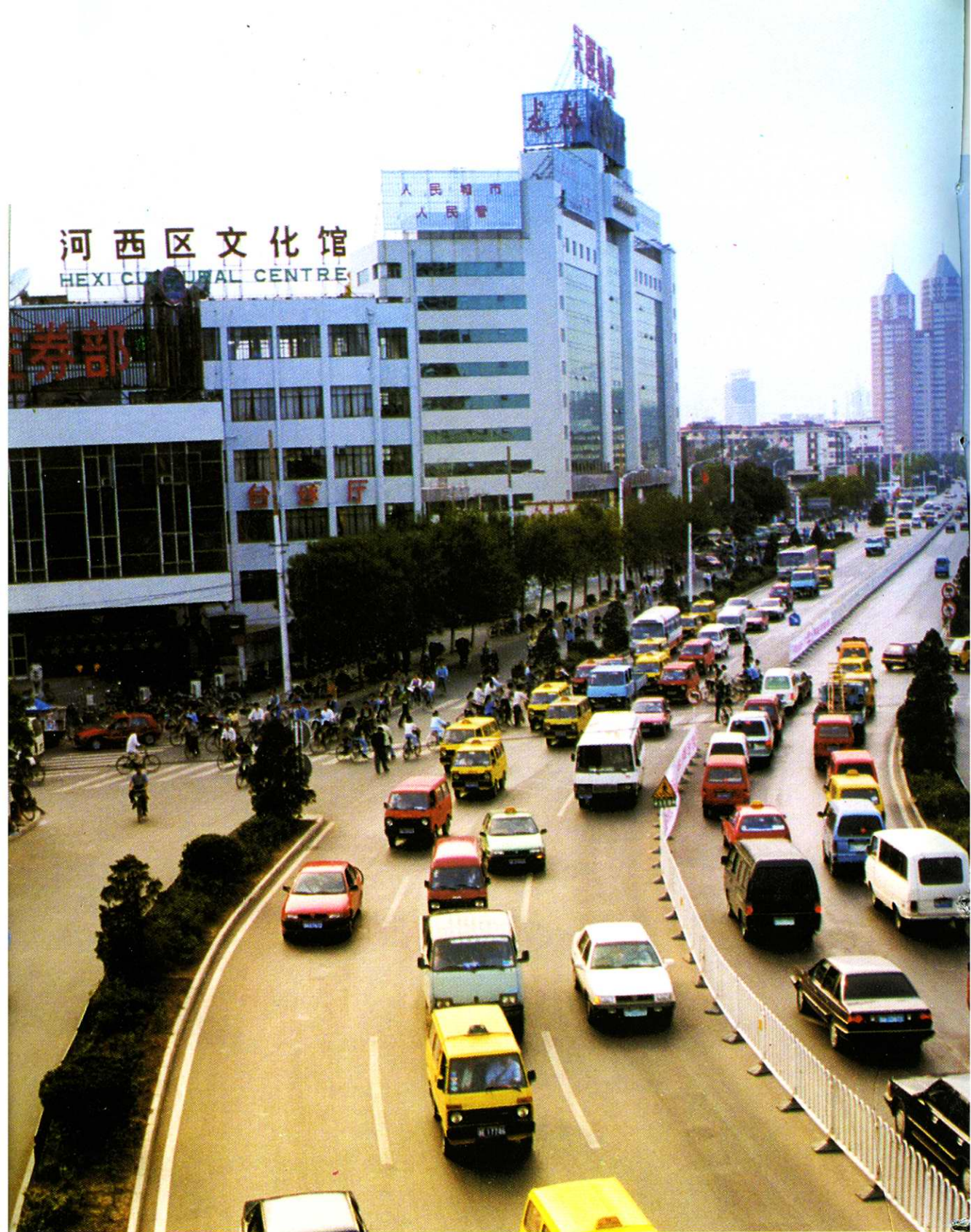
坐落在围堤道的河西文化馆和天津市房地产交易大厦