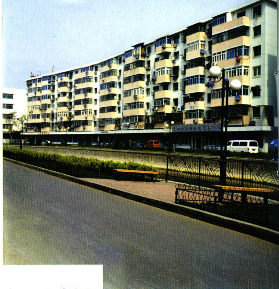
河西区房管局开发改造的 津河岸边的信昌厚大楼