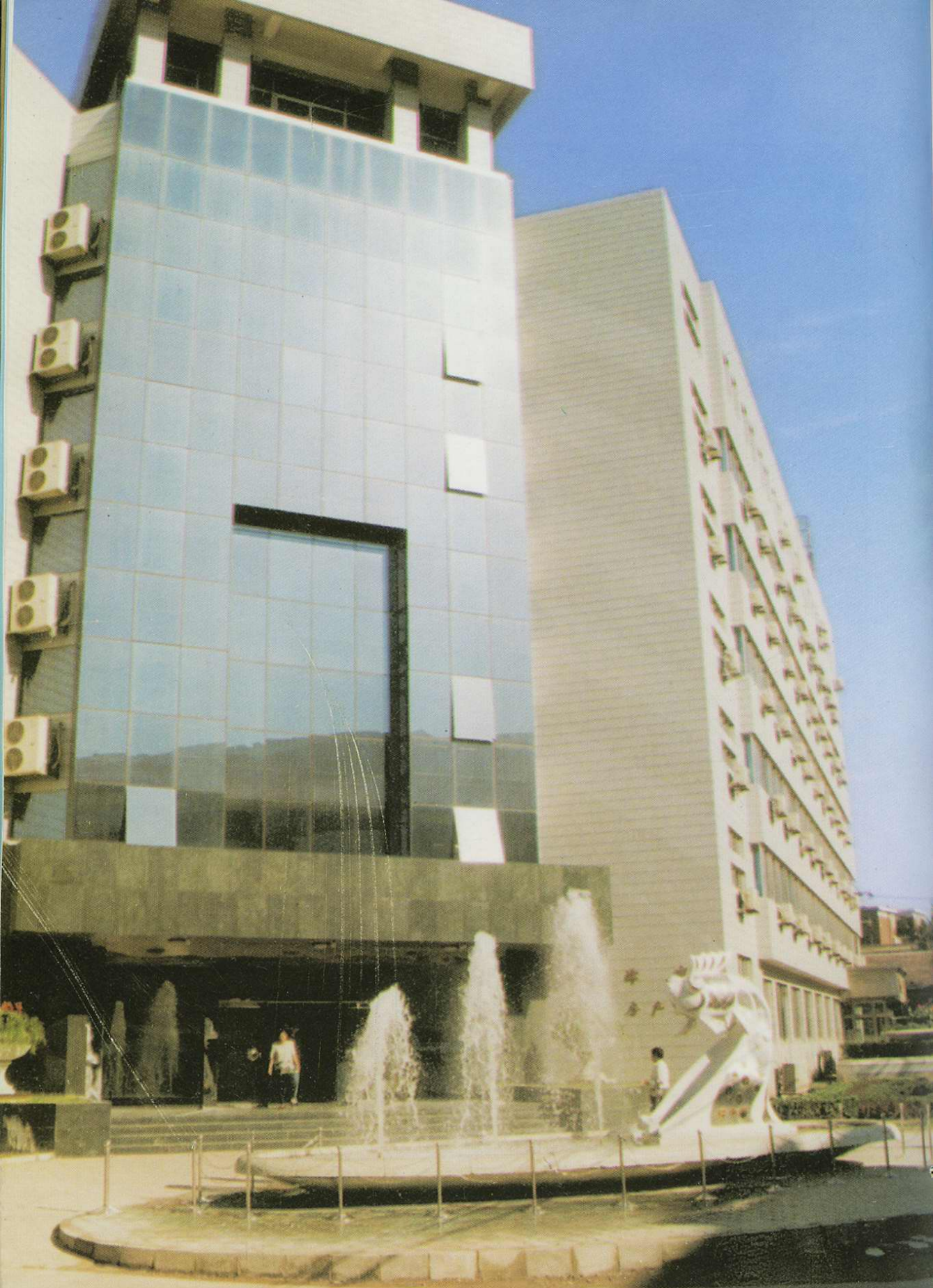
河西区房地产管理局办公大楼