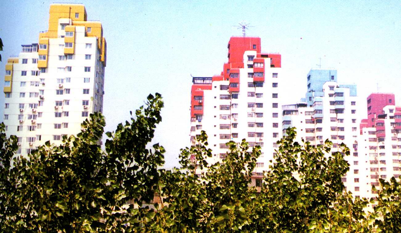
体院北高层居民住宅区