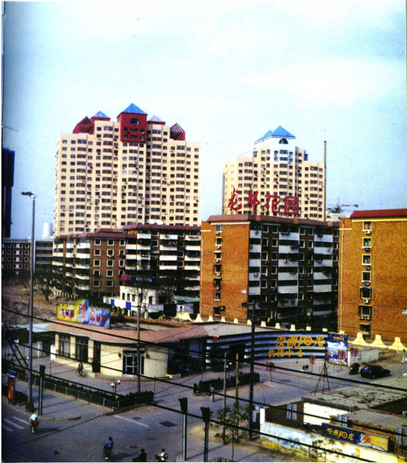
河西区房管局开发改造的大沽路龙都花园一景