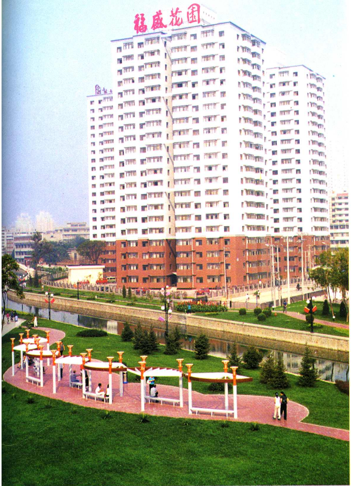
坐落在解放路津河起点的商住楼福盛花园