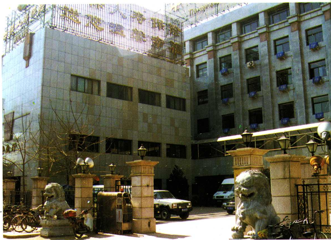
天津人壽保險公司