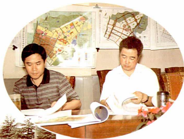
区委书记弓继权、区长陈光厚 在城市城划工作会议上(2001年)