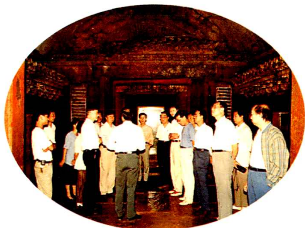
1996年9月，建设部陈总工(前右2)参观蜀僖王陵地宫建筑