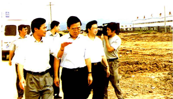
2001年9月，市长李春城(中)视察成都经济技术开发区