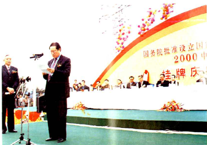
2000年3月18日，省委书记周永康在成都经济技术开发区挂牌庆典上讲话