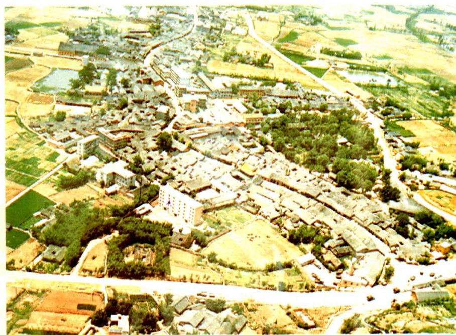
镇子场(洛带)俯瞰(1985年)