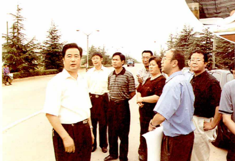
区领导和规划人员研究城市规划(2001年)