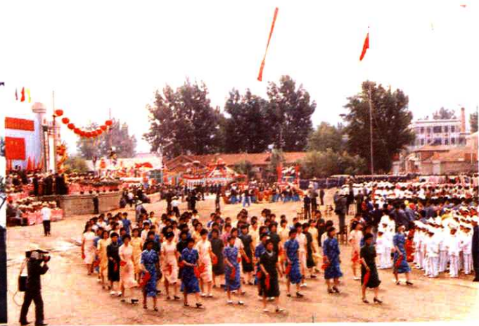
凤城满族自治县成立大会