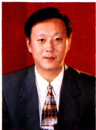
凤城市人民政府市长