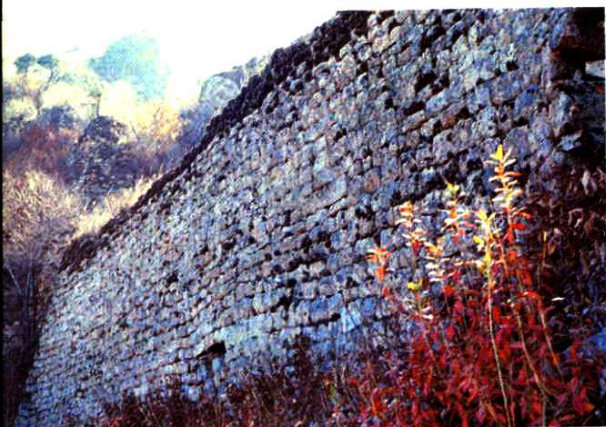
乌城(凤凰山山城)城墙