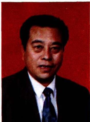
中共凤城市委书记