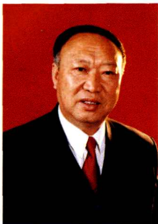
凤城市人民政府常务副市长