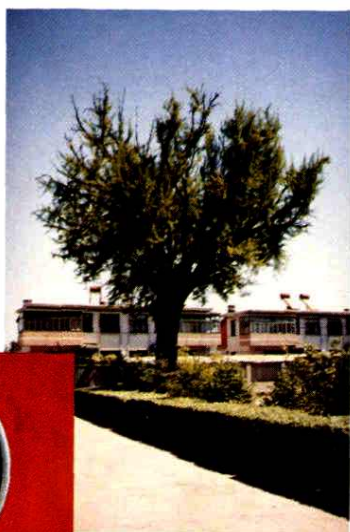
植于辽朝的白果树