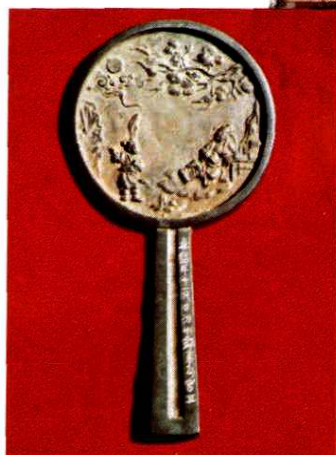
金朝长柄人物风景图铜镜