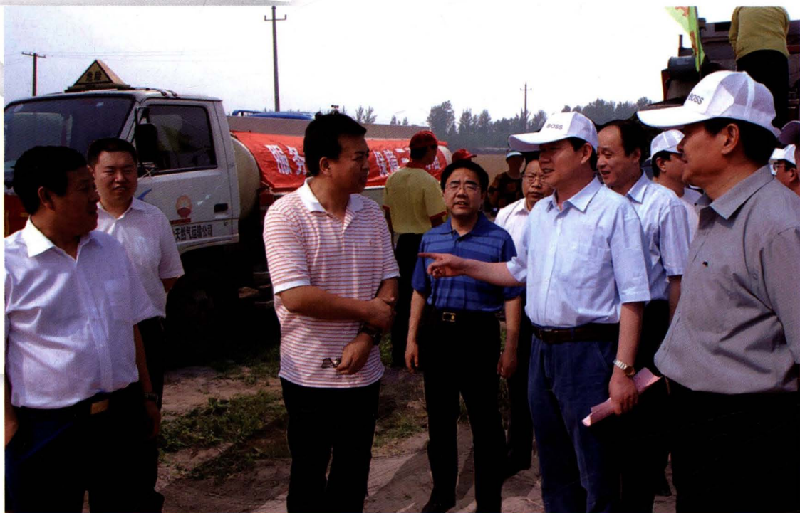
山东省副省长贾万志（右二）到济南章丘检查中国石油“三夏”保供情况