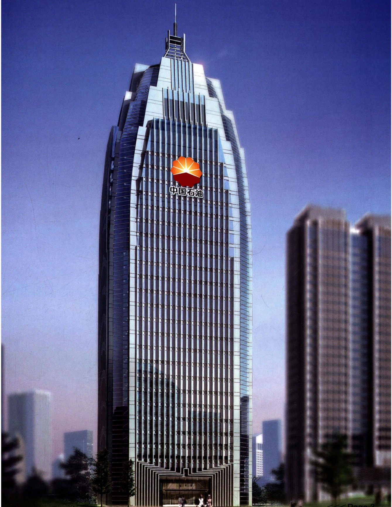
中国石油山东销售公司办公大楼