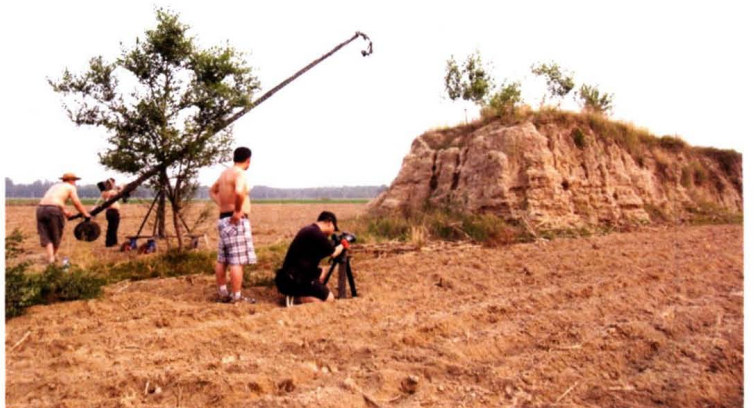
中央电视台拍摄宋代杨六郎 溃水阵“长城堤”遗迹