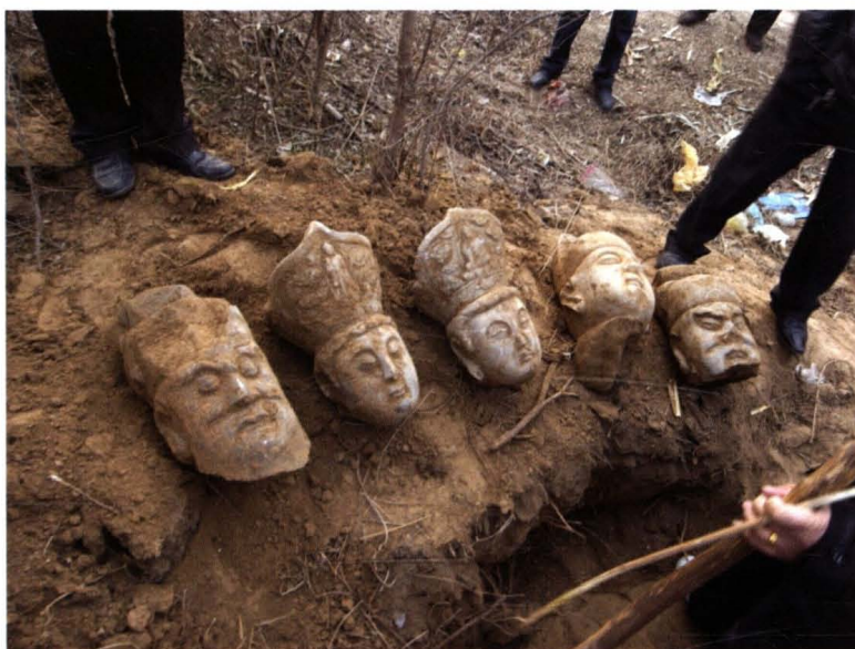
东岔河村出土的明代 “群体石佛头像”