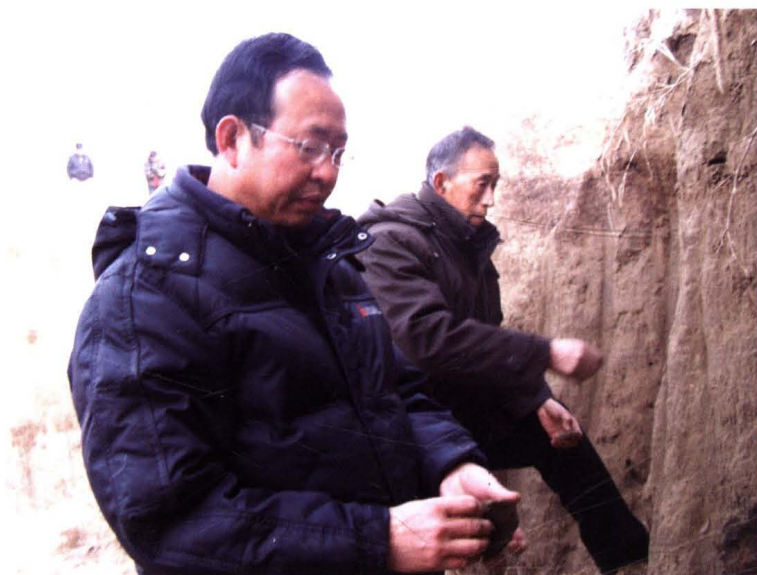
2010年5月18日，河北省文物调查队考察周窝村南“商代古村落遗址”