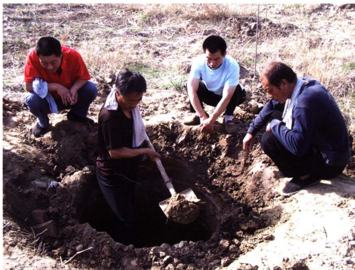
2010年5月18日，在西刘堤村村北发现2500年前的一口“古井”