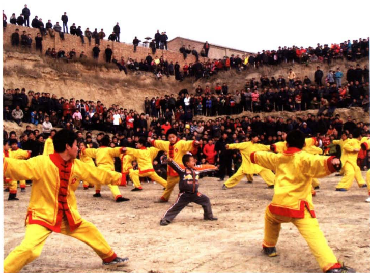
“健身、保家、卫国”的武强梅花拳