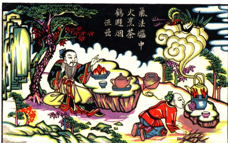
古画师“恒岳”创作的武强年画《烹茶鹤避烟》