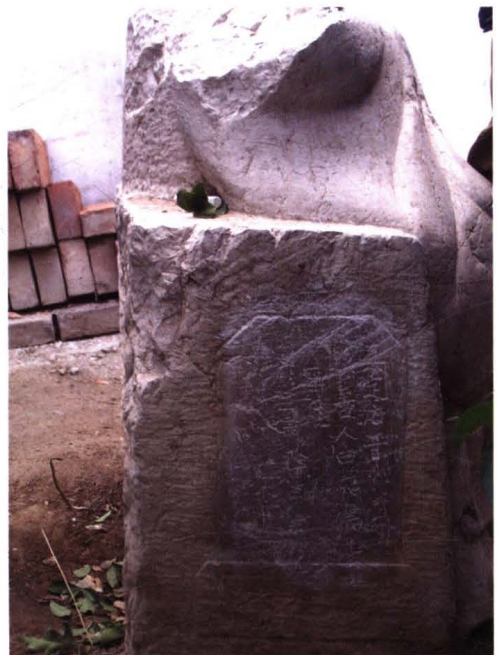
衡水东明村“真定府晋州武强”石佛像