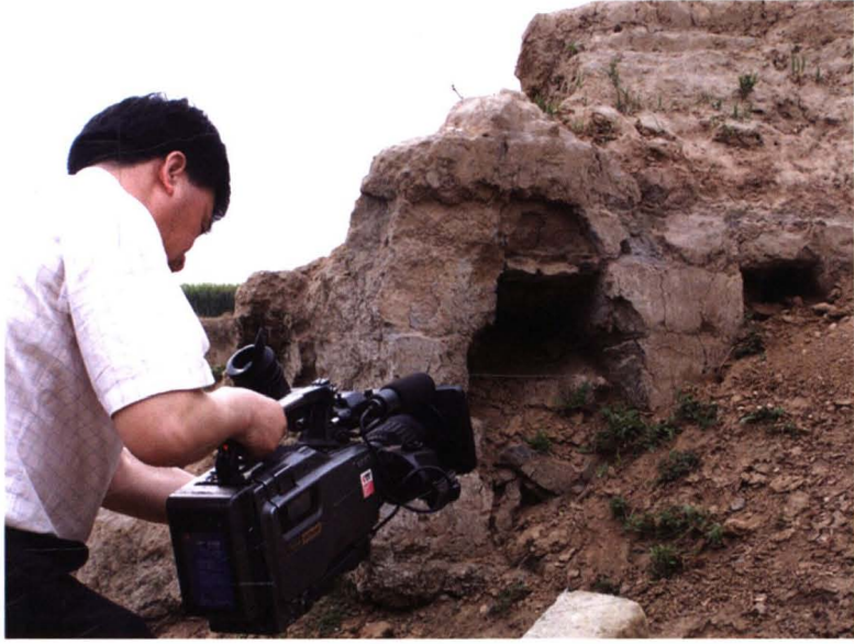
谷沙村明代皇窑遗址