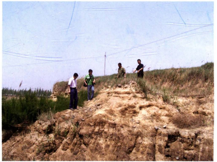
市县文物工作者在古代 武隧遗址考察