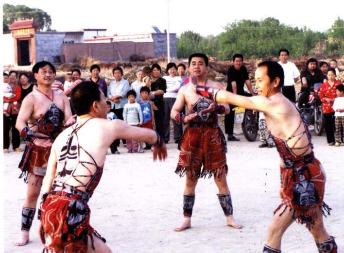
农耕时代的民间舞蹈“打花膀”