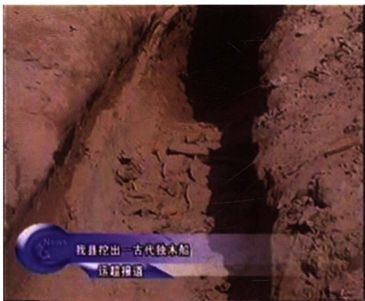
2004年4月21日，在杜林村村南发现“东周时期的独木舟”