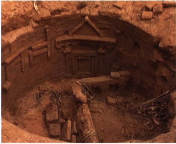
大王庄村出土的宋代古墓