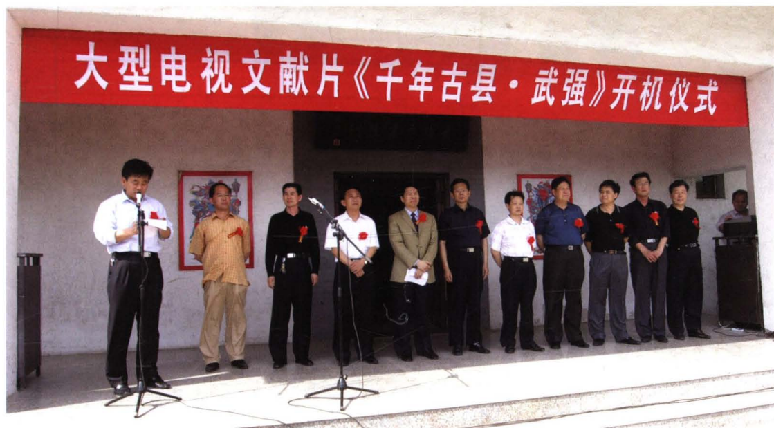
2006年5月17日，大型文献片《千年古县·武强》在武强年画博物馆举行开机仪式