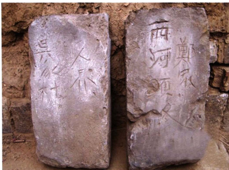
“五代时期”建武强街关 县城时的民工分活界砖