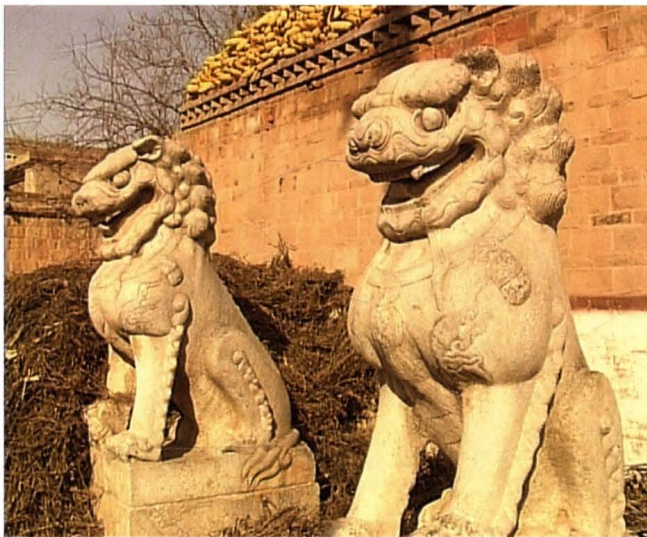
清代乾隆御赐北堤南村张氏 家族的石狮