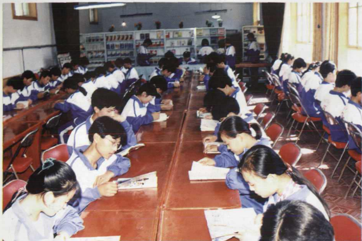
学生们在阅览室读书