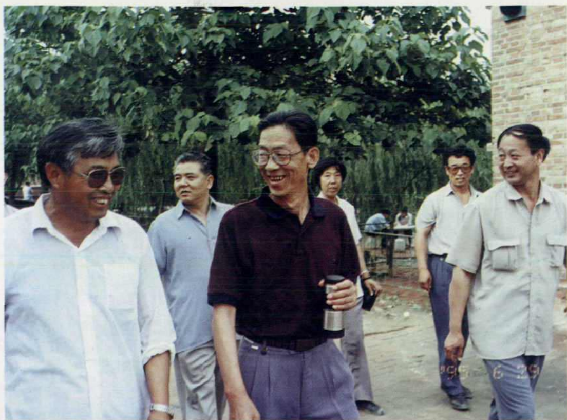
省市教委领导莅临学校视察