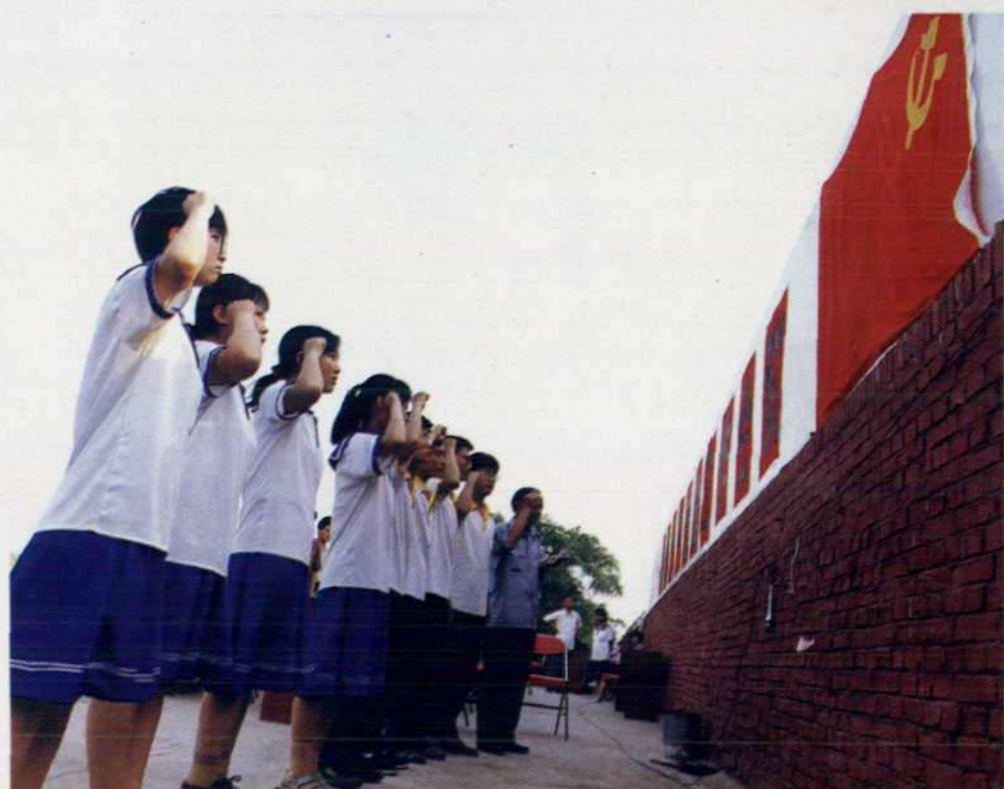
学生党员入党宣誓