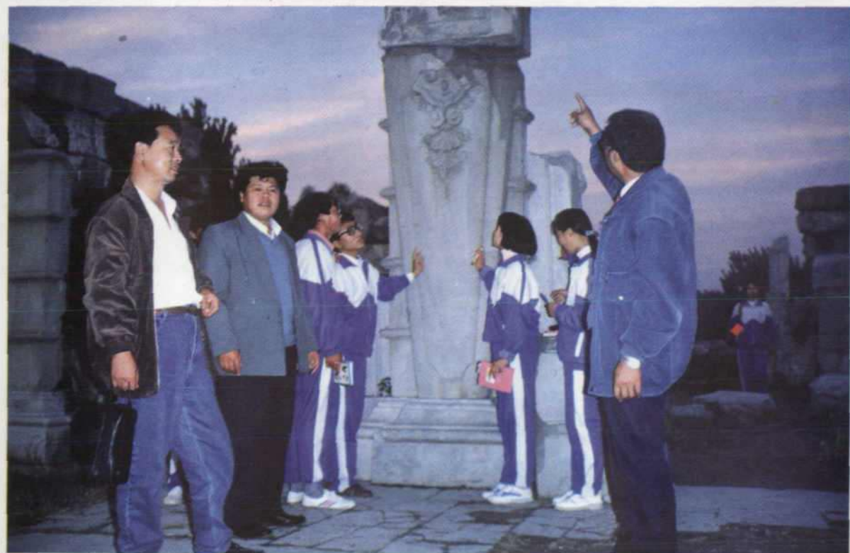
校领导在圆明园遗址对学生进行“毋忘国耻”教育