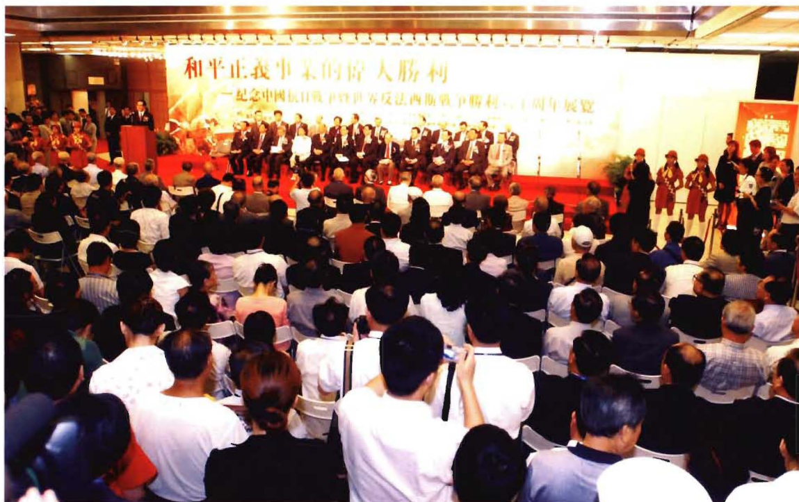
8月10日，由大公报社、中国国家博物馆等单位联合主办的《和平正义事业的伟大胜利——纪念中国抗日战争暨世界反法西斯战争胜利六十周年展览》在香港隆重开幕