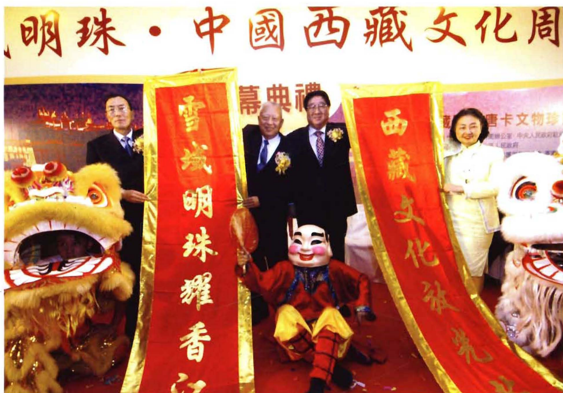
7月15日,中国西藏文化周在香港会展中心开幕