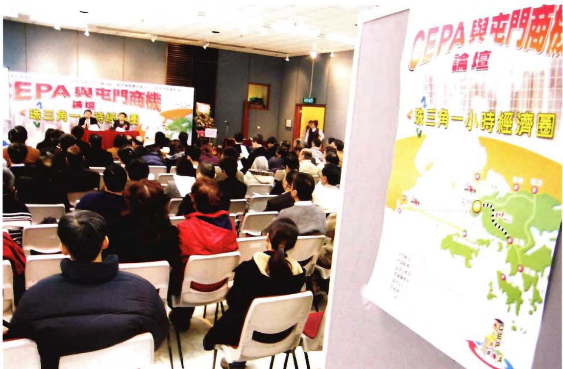
近二百位工商等各界人士3月4日在屯门大会堂聚会，探讨CEPA与屯门商机