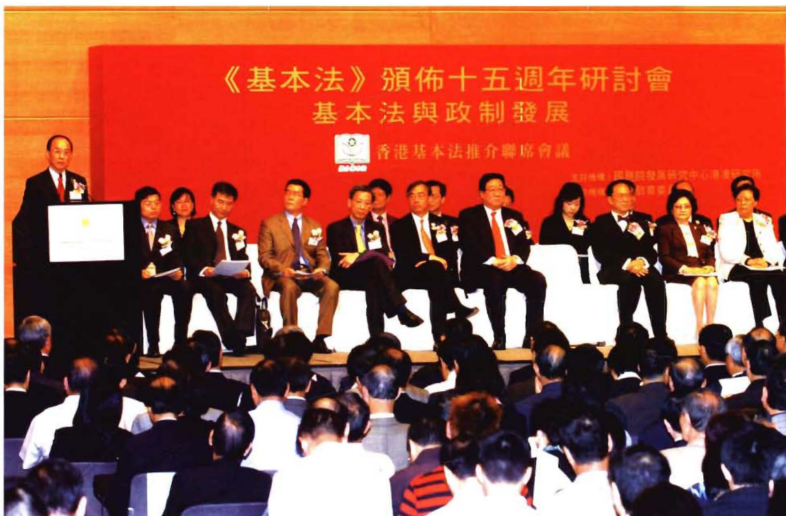
香港基本法推介聯席會議在香港會展中心舉行基本法頒佈十五週年研討會