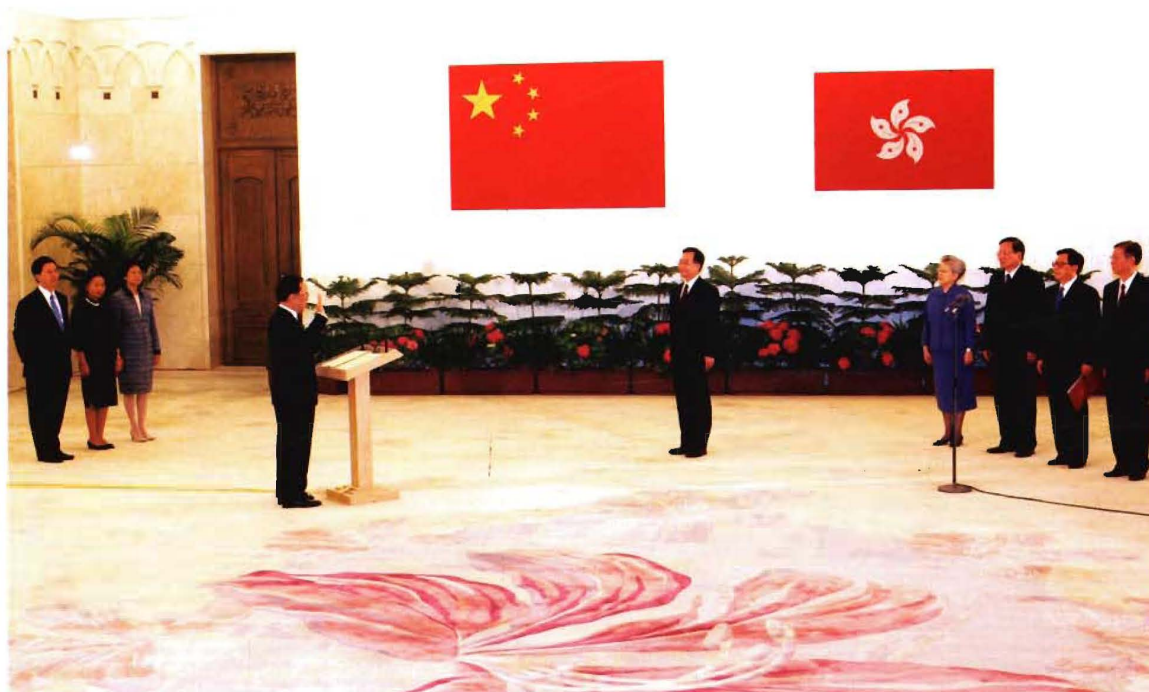
6月24日，香港特区行政长官曾荫权在北京人民大会堂香港厅宣誓就职