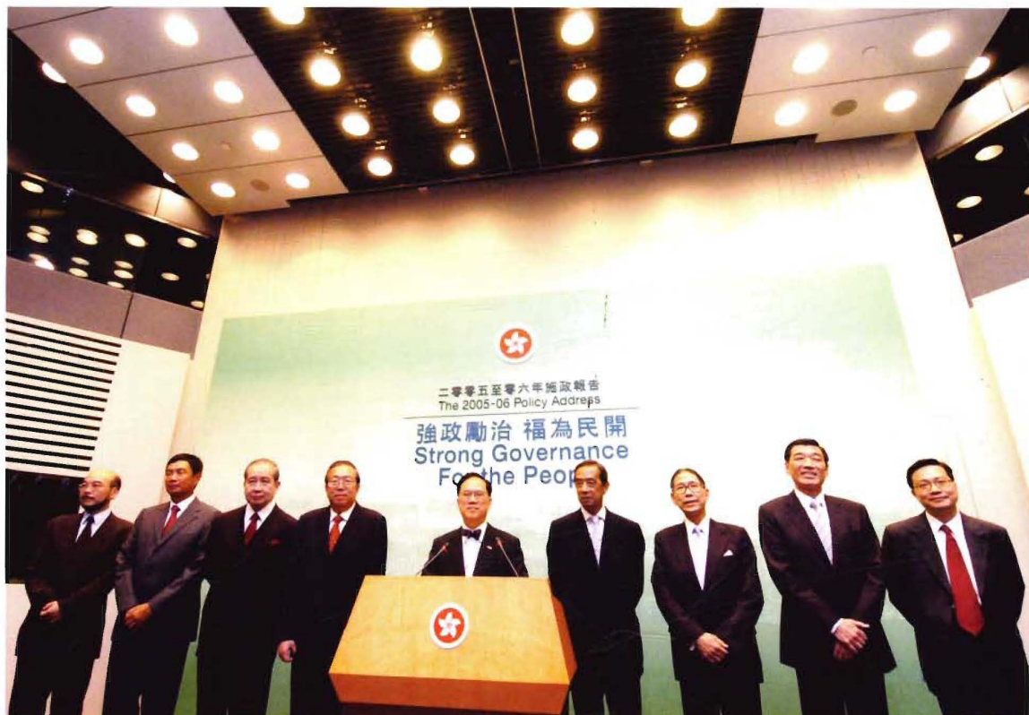
10月14日，香港特區行政長官曾蔭權率領八名新委任的行政會議成員與媒體見面