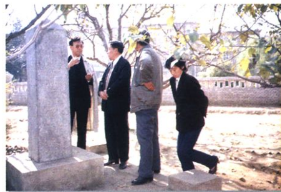
台湾同胞来校参观考察(1991年)