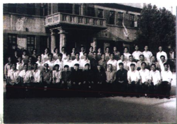
辽宁省教育厅长肖文来校指导工作(1985)