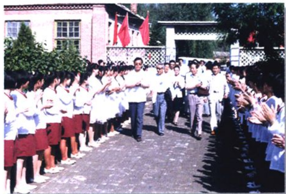
全国师范校长培训班代表来校参观考察(1990年)