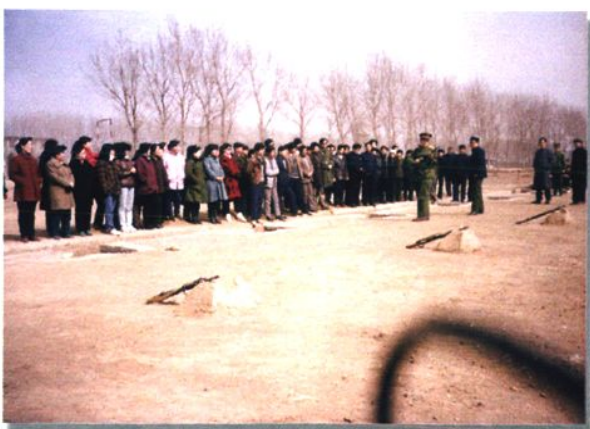
1991年去海城驻军116师参观