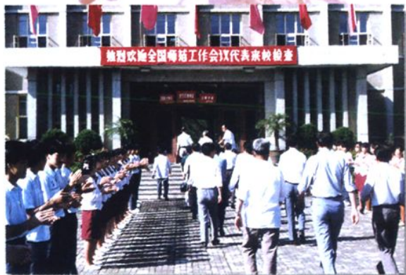
全国师范工作会议代表来校参观考察。(1989年)