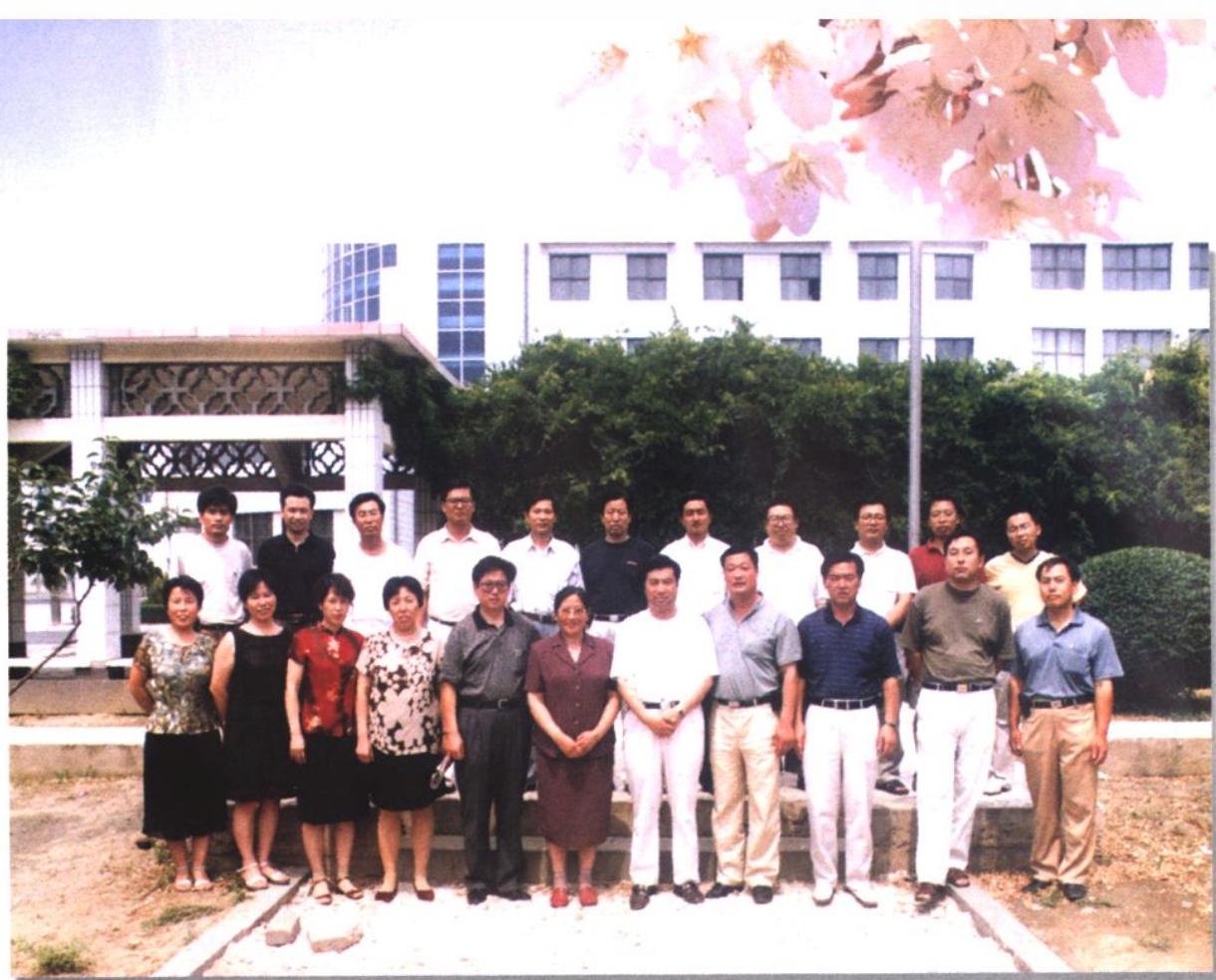
鞍山市广播电视学校中层以上干部合影（2002年）