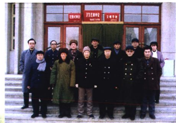
海城市教育局领导来校指导工作与校领导教师合影(1985)