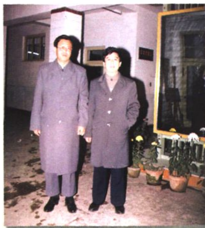
全国书协副主席，辽宁省书协主席聂成文先生来校考察（1992年）