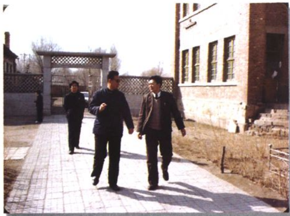
时任海城市委书记，后任辽宁省委常委、组织部长，现任北京市委副书记、市人大常委会主任于均波同志来校视察。（1996年）