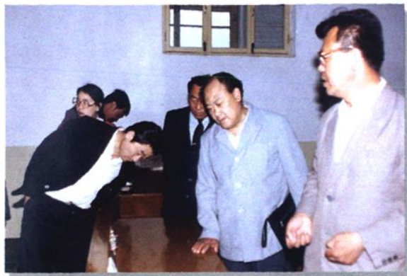
国家教委师范司司长来校考察。(1987年)