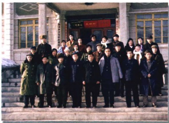
1988年到海城王家堡子调研