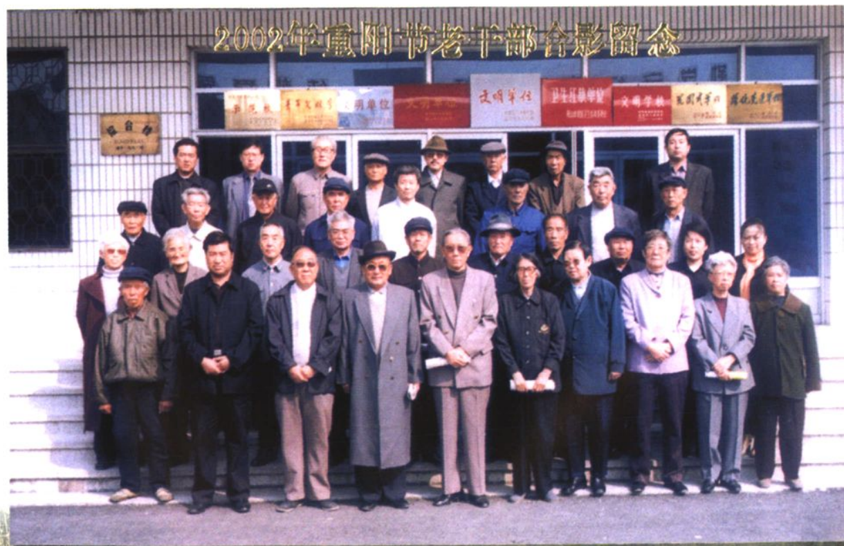
鞍山市广播电视学校离退休老教师合影（2002年）