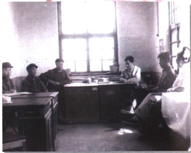
1982年海城师范领导班子开会研究毕业生实习方案