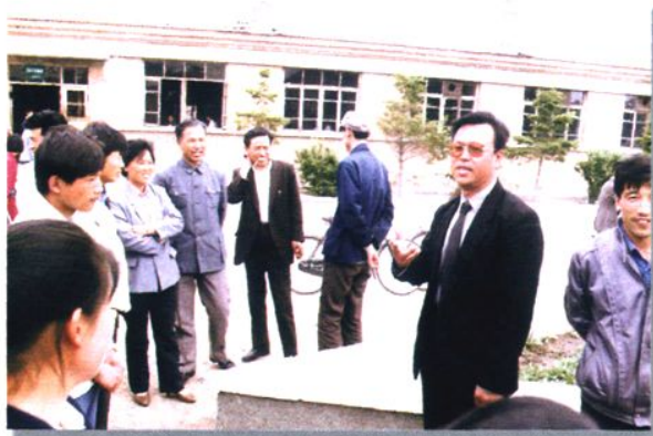
1986年到台安小学调研