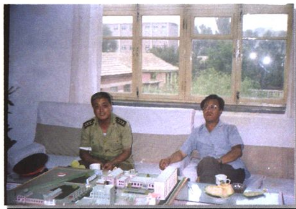
时任116师师长，后任39军军长，现任辽宁省副省长阎锋同志来校视察（1990年）