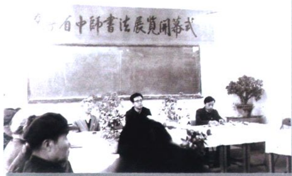
1994年省中师书法教学研究会在我校召开