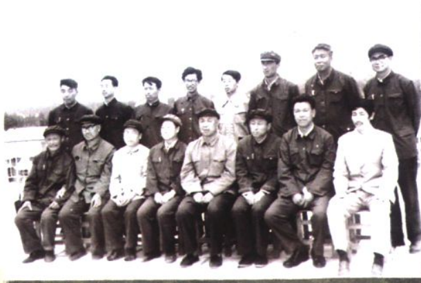
鞍山市海城师范主要领导与来校参观的海城社会各界人士座谈合影