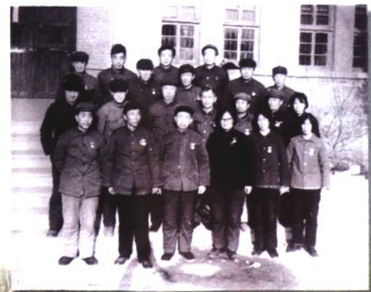
海城师范三十年教龄的老教师合影(1983年)