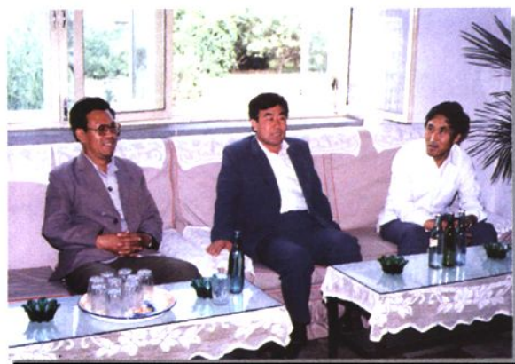
时任海城市市长，现任江西省委副书记兼省纪委书记傅克诚同志来校视察（1997年）